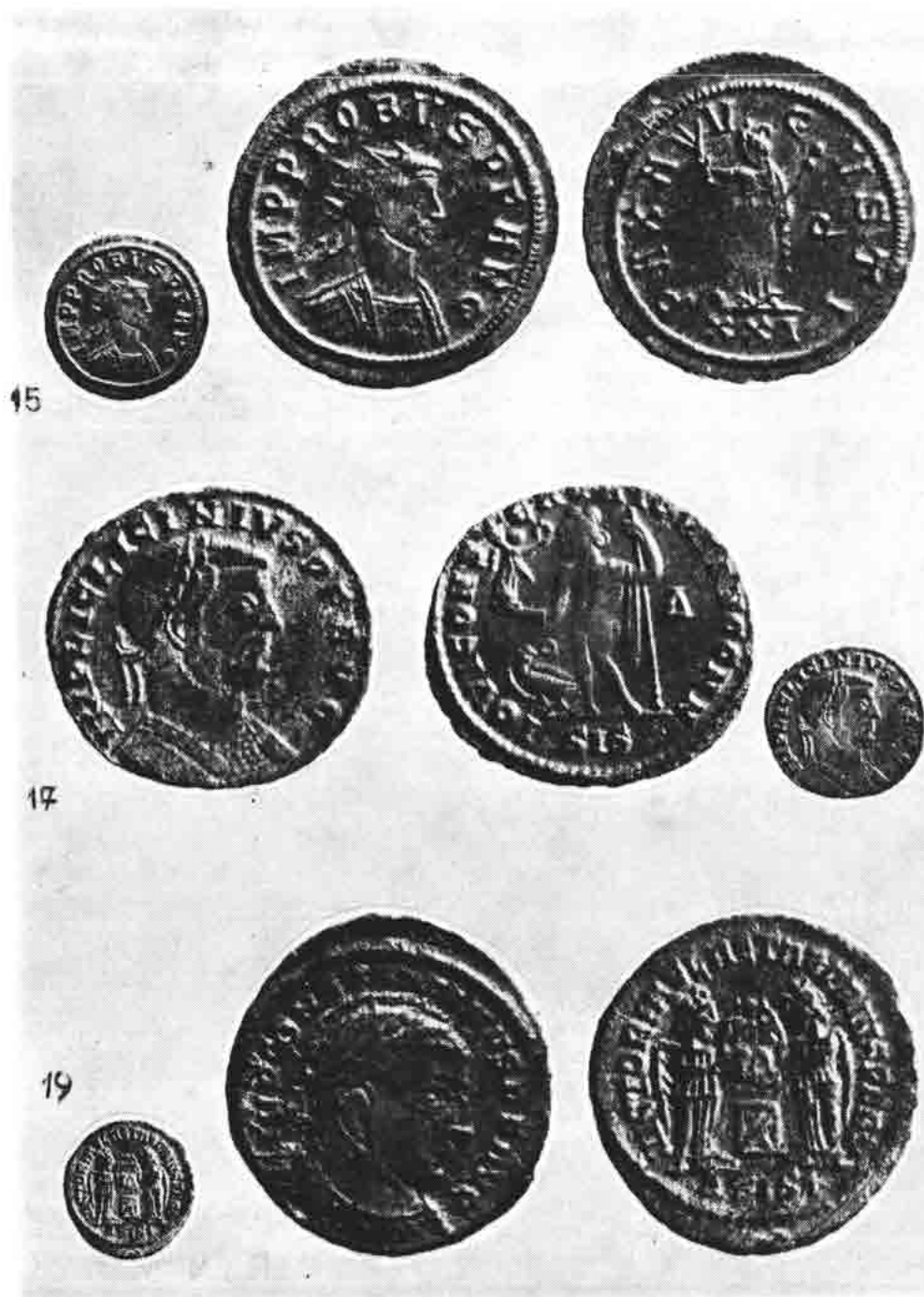
Sl. 45 — Rimski carski novci: Proba (br. 15), Licinija (br. 17) i (br. 19), Konstantina, pronađeni u Senju (Tabla I.)