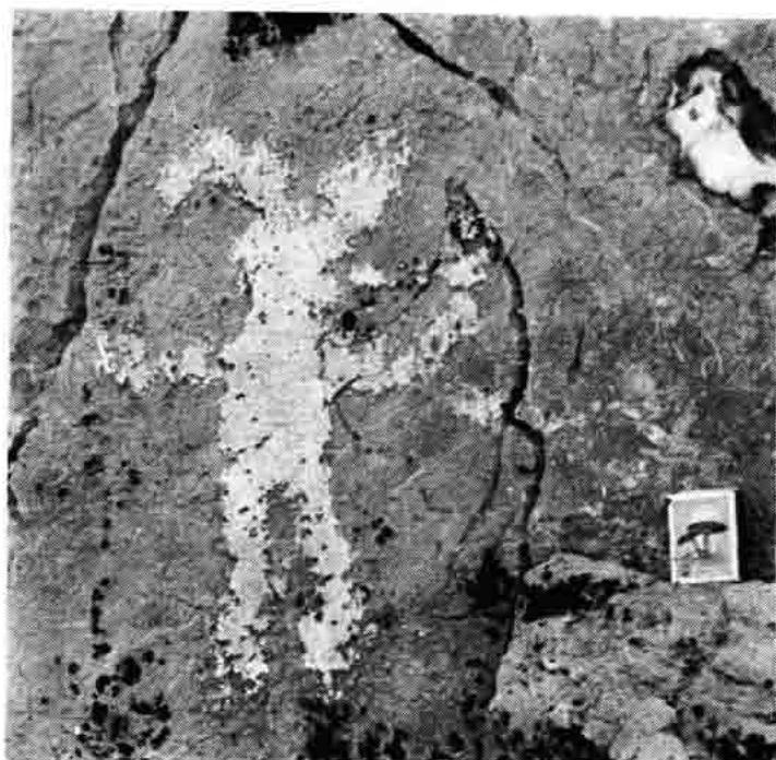
Sl. 55 — Još jedan prikaz demona ili vražića (?) s Lukovačkih greda, snimio A. Baričević 1973.