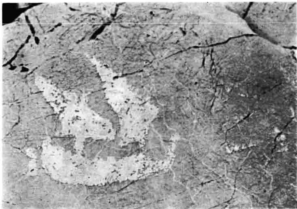
Sl. 56 — Slika jedrenjaka s dva latinska jedra, Lukovačke grede, snimio A. Baričević 1973.