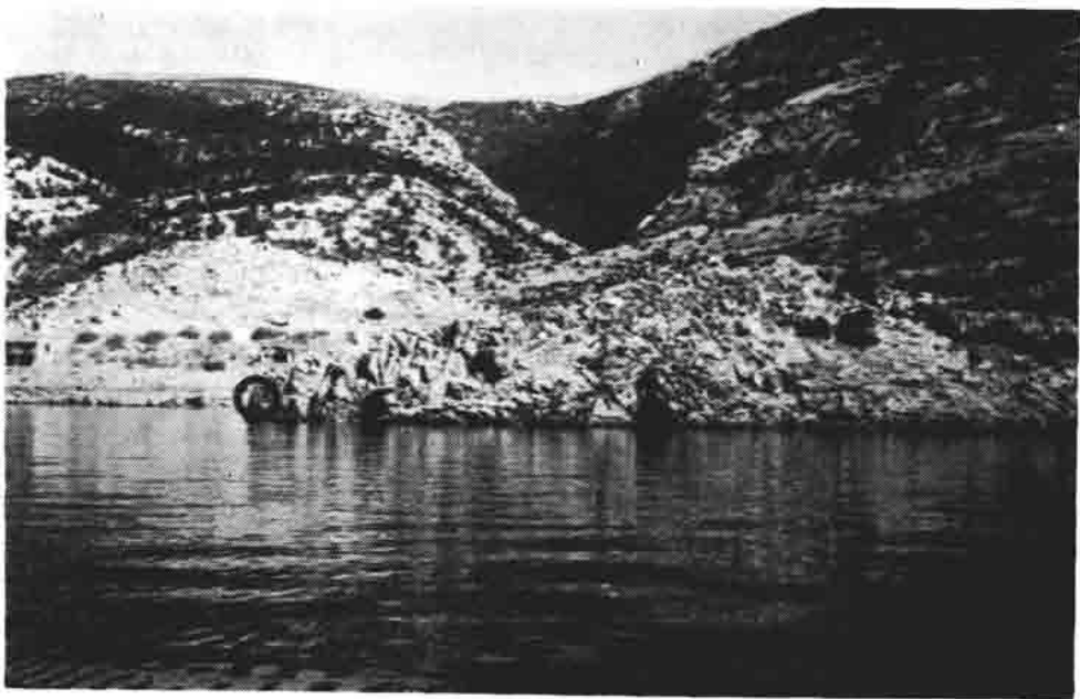
Sl. 53 — Punta Col — rt južno od Jurjeva, mjesta nalaza starih nejasnih slikarija. 1973.