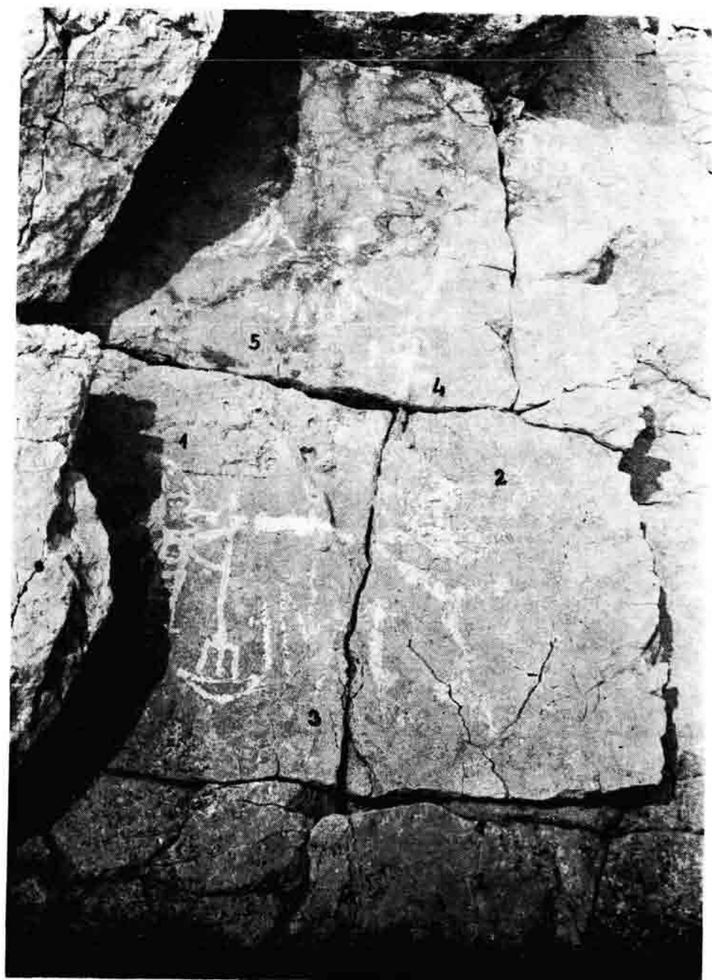
Sl. 50 — Stare slikarije na stijinama iznad mora, lokalitet Bili brigovi, detalji broj 1, 2, 3, 4 i 5. Snimio A. Baričević 1969.