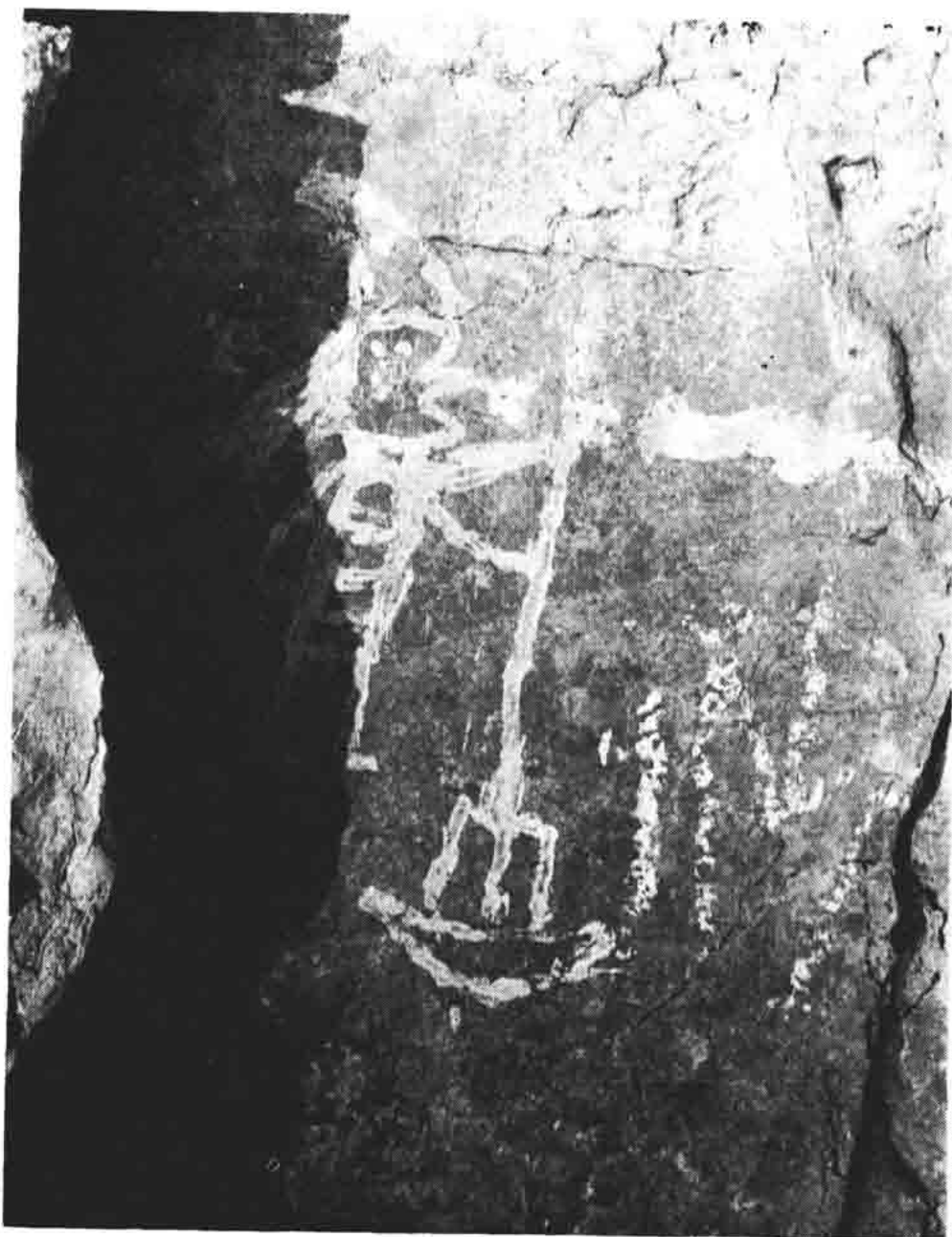
Sl. 51 — Stara slika na stijeni iznad mora, det. 1. prikaz Posejdona koji trozubom ubija ribu.