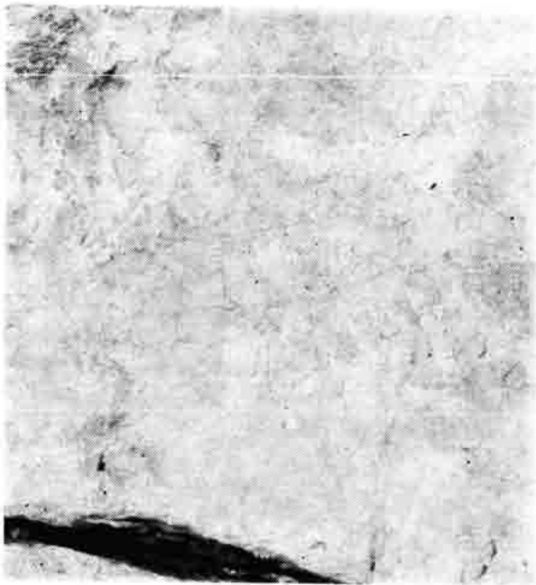
Sl. 52 — Lokalityet Bili brigovi, det. 4., prikaz demona — vražića (?) na stijeni iznad mora