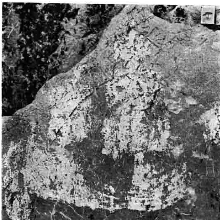
Sl. 57 — Slika broda »nava« s križnim jedrima i tri jarbola, Lukovačke grede, snimio A. Baričević 1973.