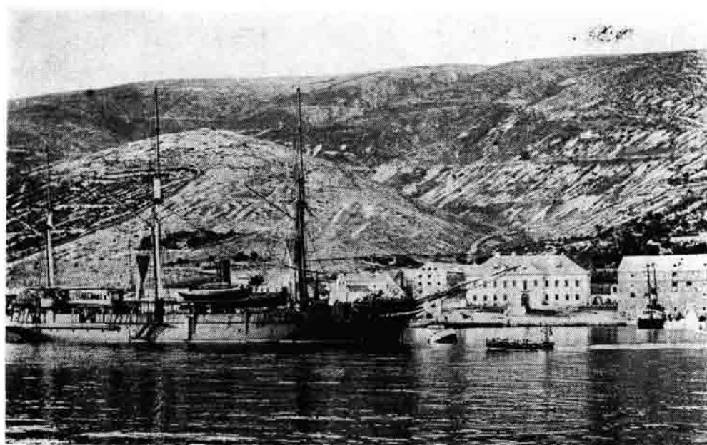
Sl. 83 — Veliki parobrod pristaje u senjsku luku, oko 1900.