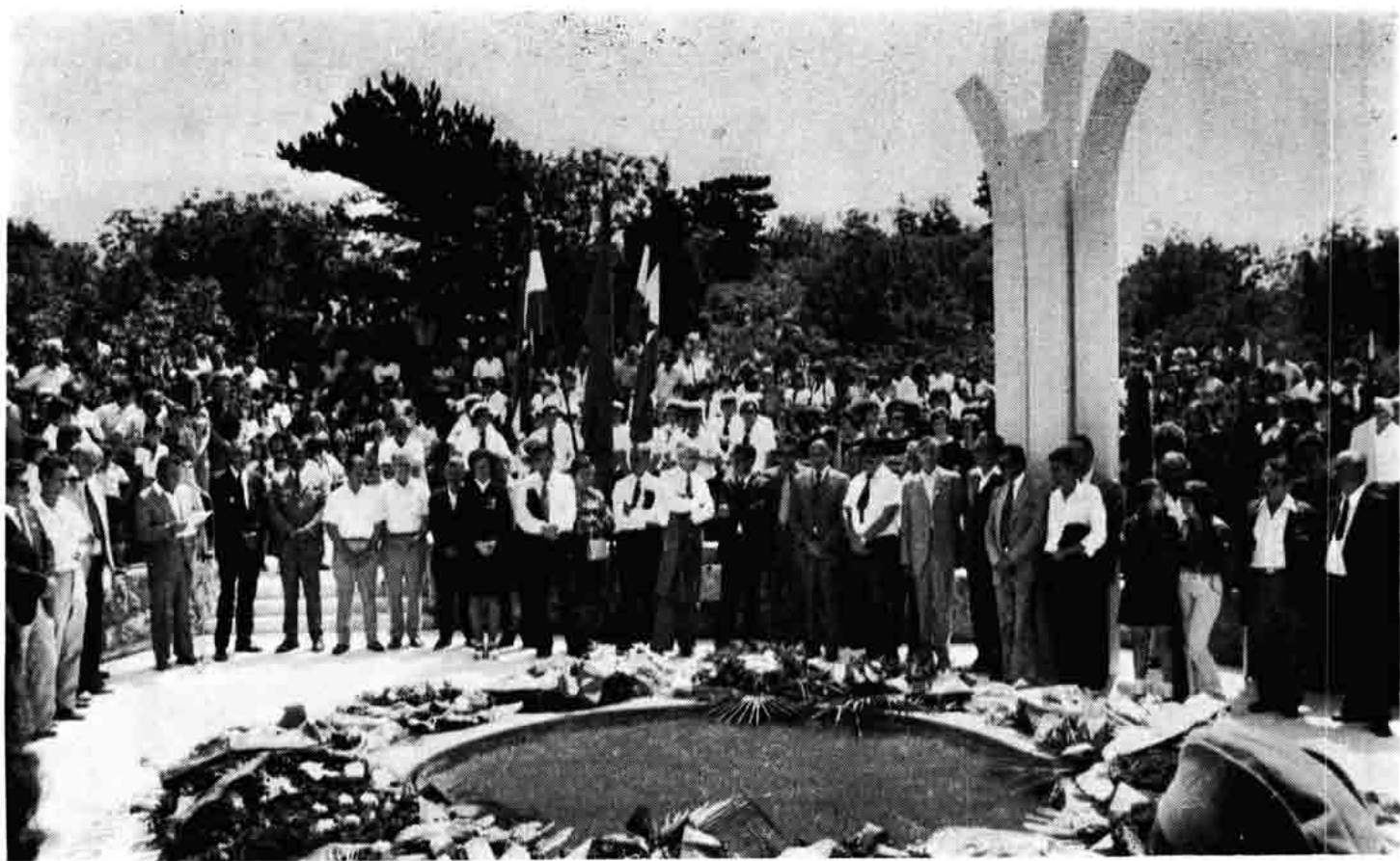
Sl. 93 — Otkriće spomenika-kosturnice na brdu Nehaj palim borcima 26. dalmatinske divizije uz Dan borca 4. VII. 1975.