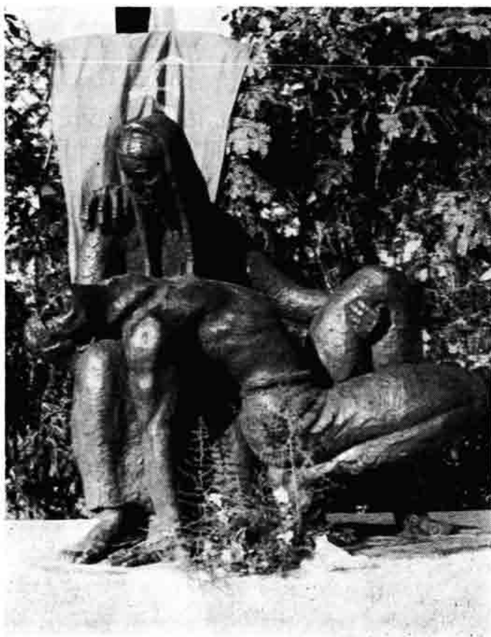
Sl. 91 — Spomenik palog borca na obali u Jablancu, rad akad. kipara Stjepana Tomljanovića