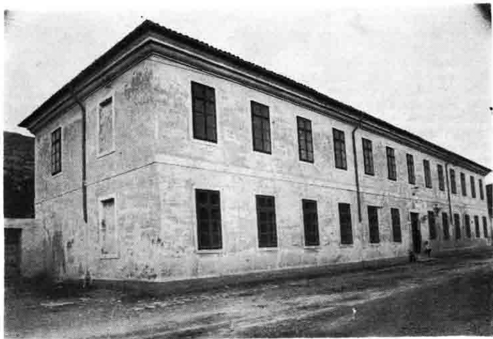
Sl. 102 — Stara artiljerijska i potom financijska kasarna u kojoj je od 1896. bila tvornica duhana, a od 1899. monopolsko skladište. Danas stambena zgrada

vilo poslovanje prepustivši svoje mjesto novoj tvornici duhana u Zagrebu, Dosta brzo nakon osnivanja novog duhanskog poduzeća u glavnom gradu Hrvatske pokrenuto je i pitanje otvaranja jedne tvornice duhana i u Senju. Pregovori oko osnivanja takva poduzeća započeti su u travnju godine 1872. pa je u tu svrhu na nalog ugarskog ministarstva financija određen direktor zagrebačke tvornice Eberle da izvodi sve »... na ustrojenje tvornice duhana odnoseće se okolnosti, osobito pako obstojeće tamo magazine, uporabive za svrhe tvorničke.« 17