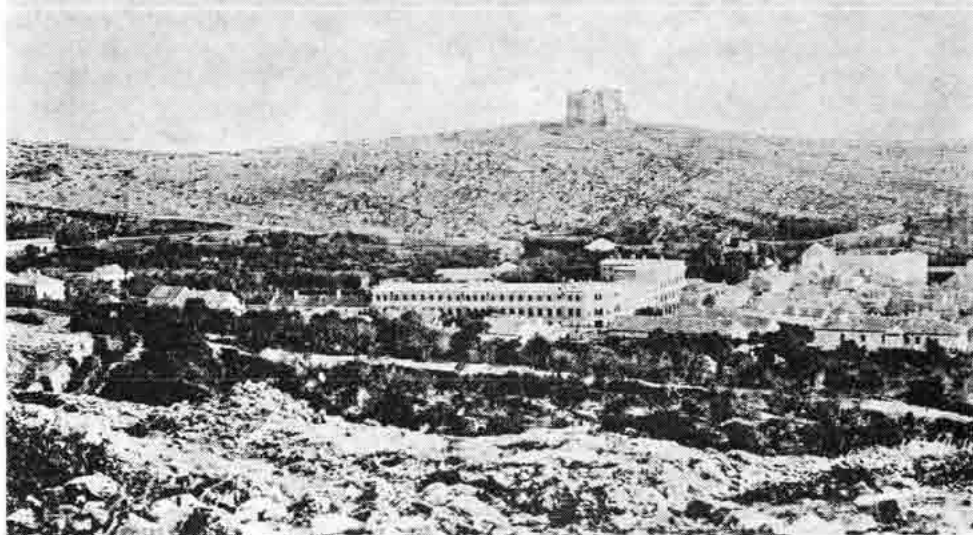
Sl. 103 — Pogled na Senj, novu zgradu tvornice duhana i Nehaj. Snimak oko 1910.

bi »kraj sadanjeg financijalnog položaja zemlje dale obrazložiti.« 30 Svakako da je i opće uzdrmano financijsko stanje, prouzrokovano nedavnim svibanjskim bečkim burzovnim krahom 1873., također ponešto djelovalo i na opću i financijsku situaciju Hrvatske, ali ono ipak nije bilo tako slabo, a da se ne bi mogla naći sredstva za osnutak tvornice. Vjerujemo da je i nova politička atmosfera u Hrvatskoj nakon nastupa »bana pučanina« Mažuranića bila upravo još ona »točka na i« zbog koje onda i tražena tvornica ipak nije osnovana. Ostvarenju toga prijedloga pristupilo se tek nakon desetogodišnje vladavine Khuenove.