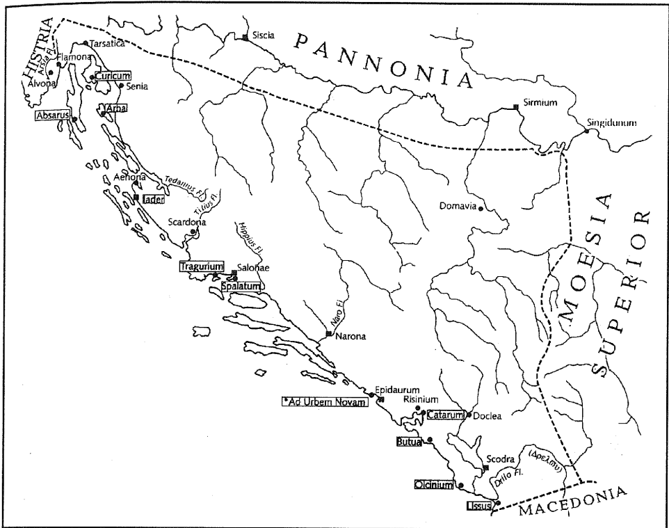
Karta 1: Urbana središta dalmatinskog i prevalitanskog latiniteta.

N.B. Nakon invazija u 6. i 7. stoljeću ostala su pod bizantskom vlašću samo središta čija su imena uokvirena.