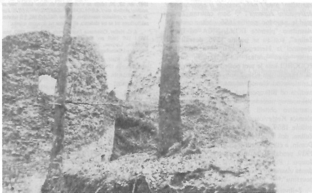
Sl. 3 - Ostaci Zelingrada