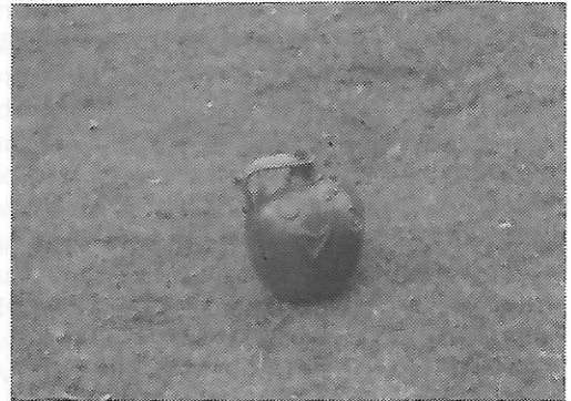
Sl. 1. ŠTUCA, KRUGLA, STUCKA, služi za nošenje vode, Kaniška Iva

mašinama), te stavljali na valjaču - drveni stol, gdje se mijesila tako dugo dok nije postala dovoljno mekana i podesna za izradu raznih