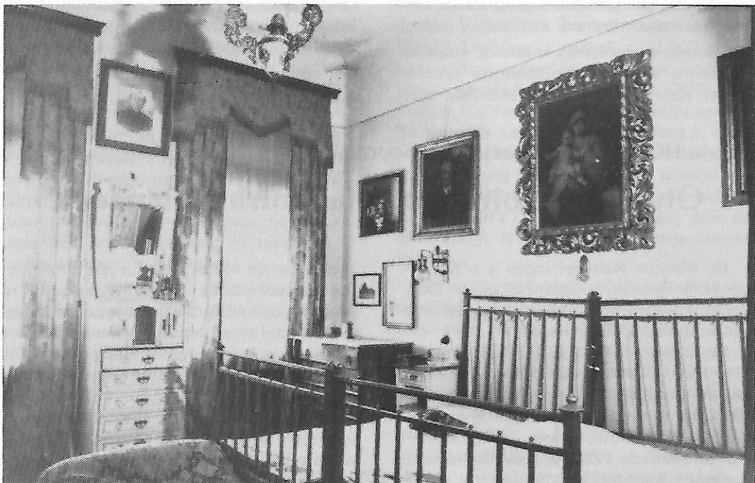
Sl. 2. Muzejska zbirka, secesijska spavaća soba

"Taj muzejski dio nastojao se tako postaviti da što više sačuva izvornost ambijenta i da