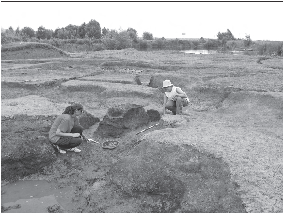
Sl. 2. Slavonski Brod - Galovo, lončarska peć 181/182