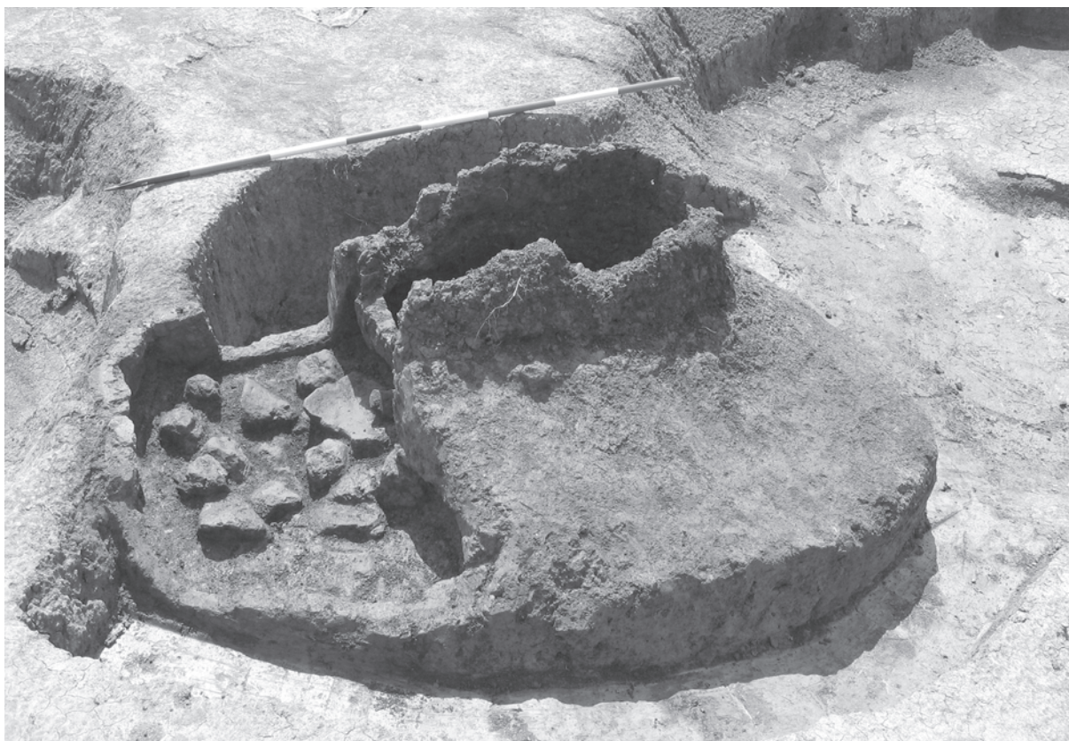
Sl. 4. Slavonski Brod - Galovo, lončarska peć 257/258 u radnoj zemunici 205/206