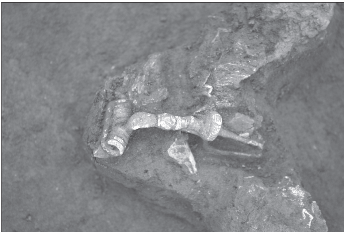
Sl. 3. Brončana fibula iz groba LT 67