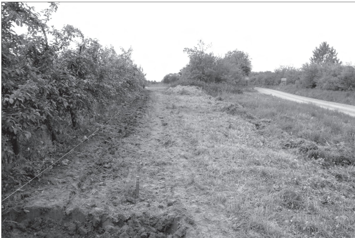
Sl. 1. Pogled na sjeverni, rubni dio nalazišta i cestu Zvonimirovo-Gačište