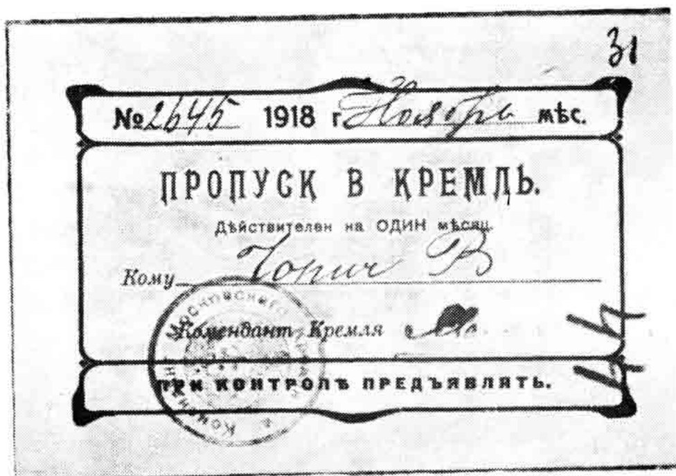
Sl. 146 — Foto original Propusnice od novembra 1918. izdane Vl. Čopiću (br. 22).

1 Bela Kun (1886—1939) osnivač Mađarske Komunističke partije i dionik međunarodnog radničkog pokreta.