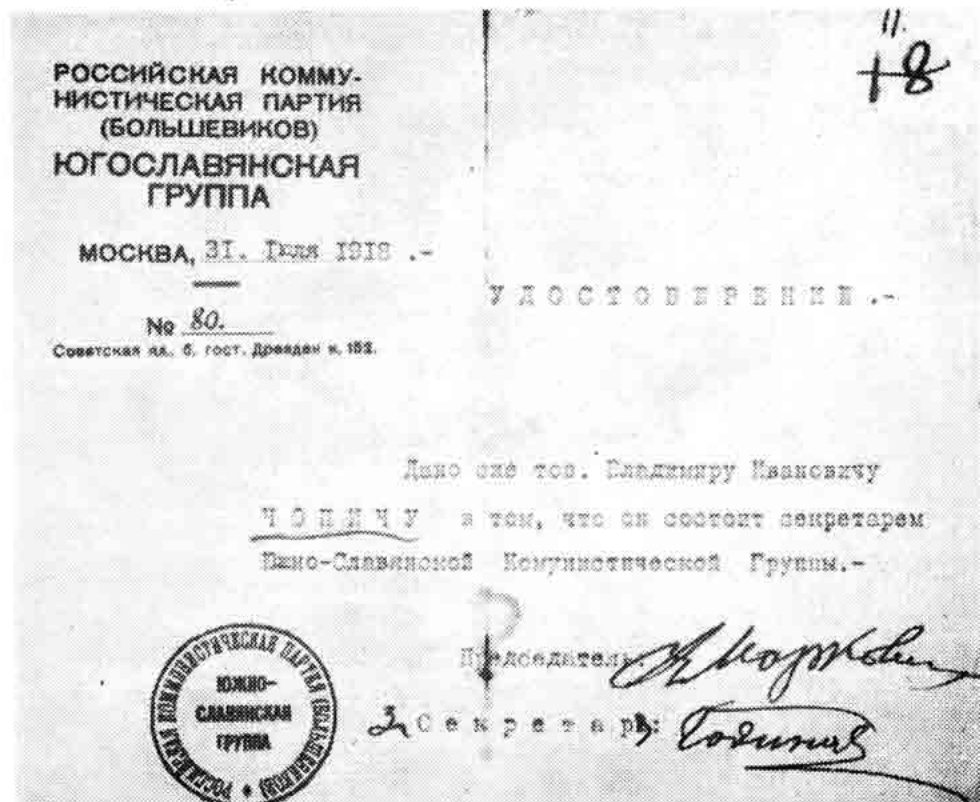
Sl. 147 — Foto original Uvjerenja od 31. jula 1918. izdanog Vl. Čopiću (br. 80)

Na poledini Inozemna sekcija komunista Smolenskog komiteta komunista (boljševika) 22. studenog