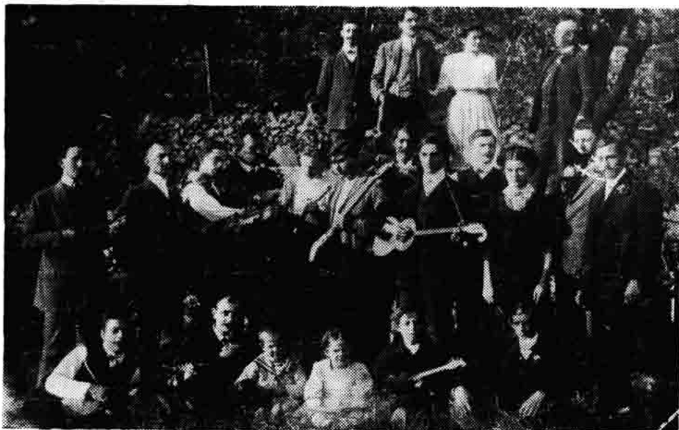
Sl. 140 — Skupina radničko-obrtničkog društva »Uskok« na izletu u Senjskoj Dragi za 1. Maja 1919.

To nije samo obaveza nego i zakletva, obećanje, koje je on dao kao komunista i kao internacionalist. S njim je on u studenome 1918. g. otputovao u domovinu i, kao što je to pokazao njegov život, borio se ustrajno i ostao mu vjeran do kraja.