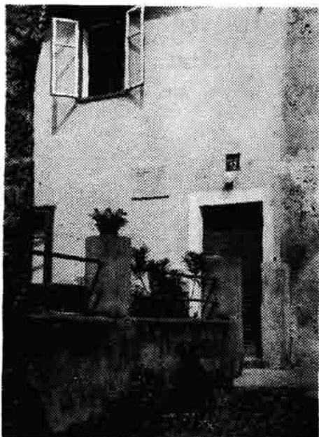
Sl. 158 — Pročelje rodne kuće revolucionara Vl. Čopića u senjskoj četvrti Varoš — sada naselje Vladimira Čopića.

U OVOJ KUĆI ROĐEN JE 8. III. 1891. VLADIMIR ČOPIĆ CLAN CKKPJ, ISTAKNUTI REVOLUCIONAR DOSLJEDAN BORAC ZA PRINCIPE PROLETERSKOG INTERNACIONALIZMA OVU SPOMEN PLOČU PODIŽE POVODOM 70. GOD. ROĐENJA ISTAKNUTOG BORCA ZA PRAVA ČOVJEKA i 20. GOD. USTANKA NAŠIH NARODA NAROD OPĆINE SENJ