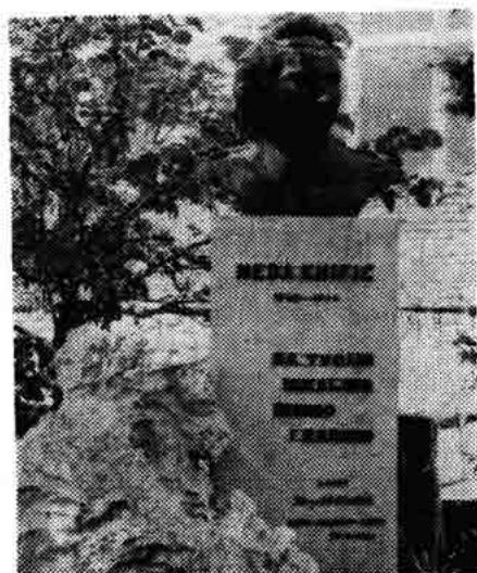
Sl. 152 — Spomenik Nedi Knifić kojega je podigao 22. XI 1961. u parku tvornice radni kolektiv poduzeća »Neda«. Rad akad. kipara Petra Kosa.

U hodniku gimnazije »Pavao Vitezović«, s lijeve strane nalazi se na zidu mramorna spomen-ploča, veličine 115 x 70 x 2,5 cm.