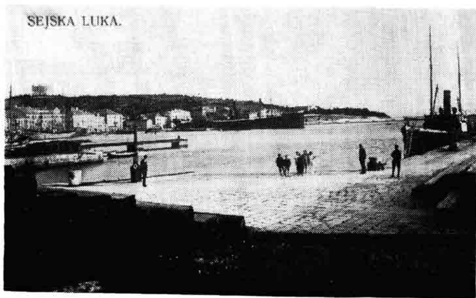
Sl. 172 — Pogled na senjsku luku sa sjeverne strane (oko 1920).

Poslije II svjetskog rata preselio se Vatroslav Cihlar već 1947. g. ponovno na Rijeku i postaje direktor Pomorskog muzeja u Rijeci. U vremenu dužeg upravljanja muzejom prikupio je i obradio opsežnu građu o povijesti hrvatskog pomorstva, s naročitim osvrtom na Hrvatsko primorje. Isto je tako priredio za tisak rukopis o povijesti riječke tvornice papira, kao i veliku zbirku svojih pjesničkih i novinarskih radova pod naslovom »Popuhnul je tihi vetar« ili »Gromače i umejki«. 17 Cihlar je smatrao da kao samostalan književnik i publicist može više koristiti hrvatskoj književnosti i stoga se osamostaljuje, ali i nadalje surađuje i objavljuje u svim poznatijim časopi-