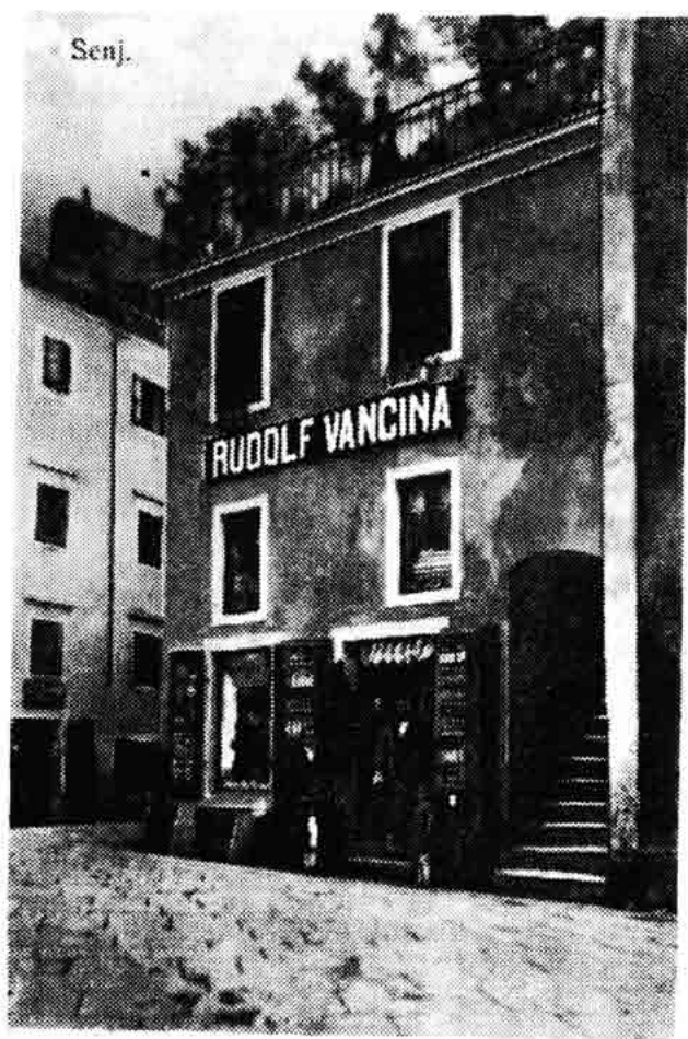
Sl. 171 — Kuća na Potoku, trgovačka radnja Rudolfa Vancine (oko 1915).

brojnim člancima i esejima svoje tumačenje pojedinim ondašnjim zgodama i o ličnostima koje su sudjelovale u njima. Njegov je đачki rad bio usko povezan političkom aktivnosti i širenjem naprednih revolucionarnih misli o njegovim člancima. Od zapaženijih članaka bio je tada njegov članak: »Zena u redovima napredne omladine«. Čini se da je ipak Barčev članak »Štrajk« iz 1912. g. pospješio revolucionarno raspoloženje i protestno gibanje kod srednjoškolaca i ostale omladine jer je neposredno iza toga započeo na Sušaku đачki štrajk poslije političkih demonstracija đaka i građana 3. ožujka 1912. g. uz neprekidno trajanje sve do 10. travnja iste godine. Kao opći štrajk srednjoškolaca protiv Cuvajeva komesarijata proširio se na cijelu Hrvatsku i izazvani sukobi potresali su zbog toga cijelu Monarhiju. U takvu napetom stanju došlo je do atentata na kraljevskog povjerenika i komesara Slavka Cuvaja. Taj je atentat izveo 8. lipnja 1912. g. sveučilištarac Luka Jukić (1887—1929) iz Svilaja u Bosni, onda kad se Cuvaj vraćao s neke svečanosti.