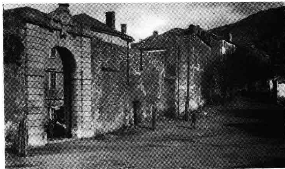
Sl. 175 — Velika vrata s dijelom istočnog bedema (oko 1930.)