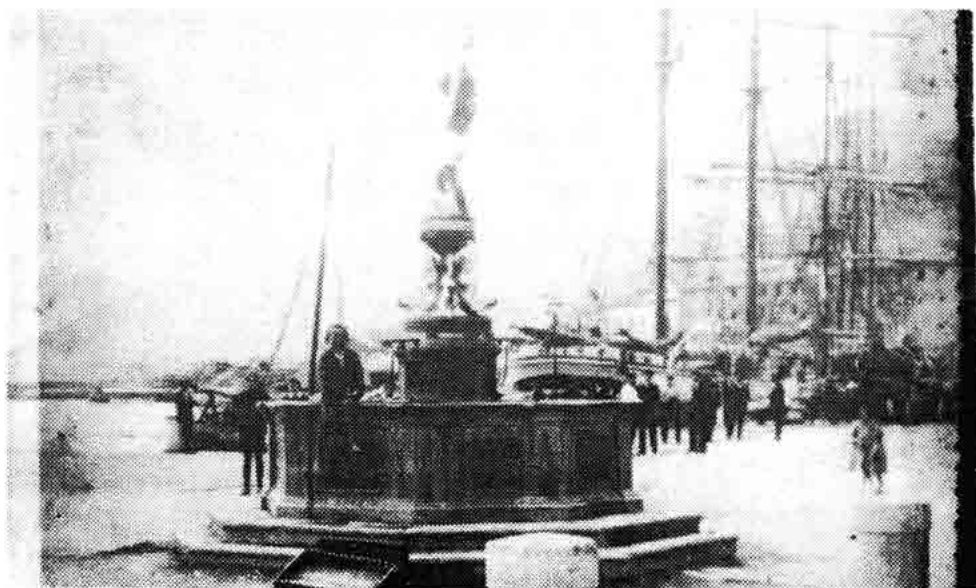
Sl. 176 — Fontana na Obali. Lijepi spomenik klasicizma — na žalost demontiran 1940. Stanje oko 1930.

Dane Gruber je preminuo u Zagrebu 21. ožujka 1927. godine. O njemu kao vrijednom i marljivom naučnom istraživačelju na području hrvatske historiografije, i to najstarijega razdoblja hrvatske povjesnice, nitko nije opširnije pisao, osim krutih i zbijenih bio- i bibliografskih podataka, s kronološkim nizom navođenja njegovih naučnih djela, u čisto enciklopedijskoj formi. Tako o Dani Gruberu imamo nešto opširniji, ali strogo naučni, napis E. Laszowskog u djelu »Znameniti i zaslužni Hrvati«. Zagreb 1925, str. 98—