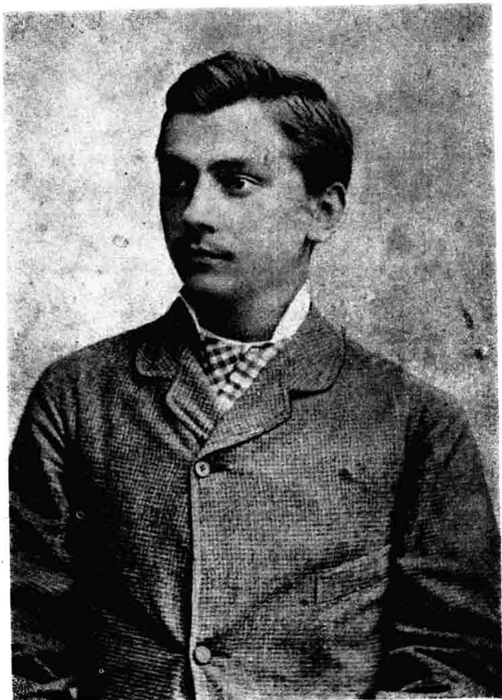
Sl. 178 — Književnik Josip Draženović. Snimak iz mladih dana oko 1890.