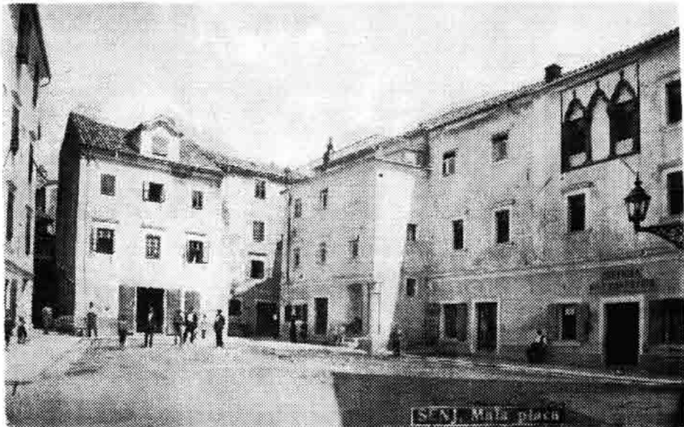
Sl. 181 — Osebujni senjski trg Mala placu. Trgovine i likovi kakve spominje Draženović; stanje oko 1910.

U tim okvirima, tj. s jedne strane u težnji da izrazi indignaciju nad skućenošću i zaostalošću malograđanskog života koji ga je godinama okruživao i s druge strane da pronikne u intimni svijet malih ljudi koje je vrlo dobro poznao, Draženović je jedan dio svoga stvaralaštva vezao uz Senj i Senjane. To su u prvom redu pripovijest »Nova era« (pod nazivom Nova era , crtica iz primorskoga života, izašla prvi put u Vijencu 1893.), zatim zbirka »Crtice iz primorskoga malograđanskoga života« (Po buri, Mačka, S pločnika, Koban zavjet, Tijesno je, Meštromo, U dida, Martinova oporuka, Mužev povratak, Pričica o probodenom srcu, Luka »Sveti«, Nova era, Na Badnjak), izišla u pišćevoj nakladi u Senju 1893. u Tiskarskom zavodu H. Lusteru, i »Povijest jednoga vjenčanja« (Pripovijest iz primorskoga malograđanskoga života), izišla u Zagrebu 1901. u nakladi Matice hrvatske. To su uglavnom Draženovićeva djela sa »senjskom tematikom«, iz kojih kritika kao kvalitetnije izdvaja »Novu eru« (»sigurno najbolje djelo Draženovićevo« — kako kaže prof. Frangeš) i uopće »Crtice iz primorskoga malograđanskoga života« (»jedna od najvrednijih knjiga hrvatskoga realizma« — Frangeš), dok je pripovijest »Povijest jednoga vjenčanja« kod kritike i suvremene i današnje prošla daleko slabije. Opsežan prikaz »Povijesti jednoga vjenčanja« dao je Milan Marjanović u »Obzoru« 1902. i tu je iznio niz značajki Draženovićeva pripovijedanja: »Nikada nije nastojao da mu pripovijesti budu pune zgoda i zanimljivih