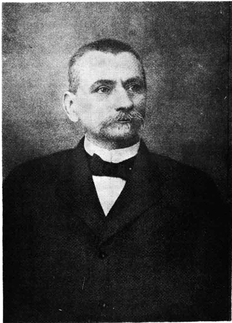
Sl. 179 — Književnik Josip Draženović. Snimljen oko 1930.