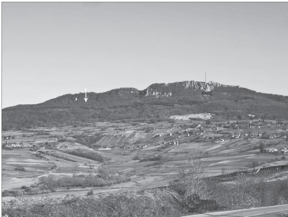
Sl. 1. Pogled na brdo Kalnik s juga