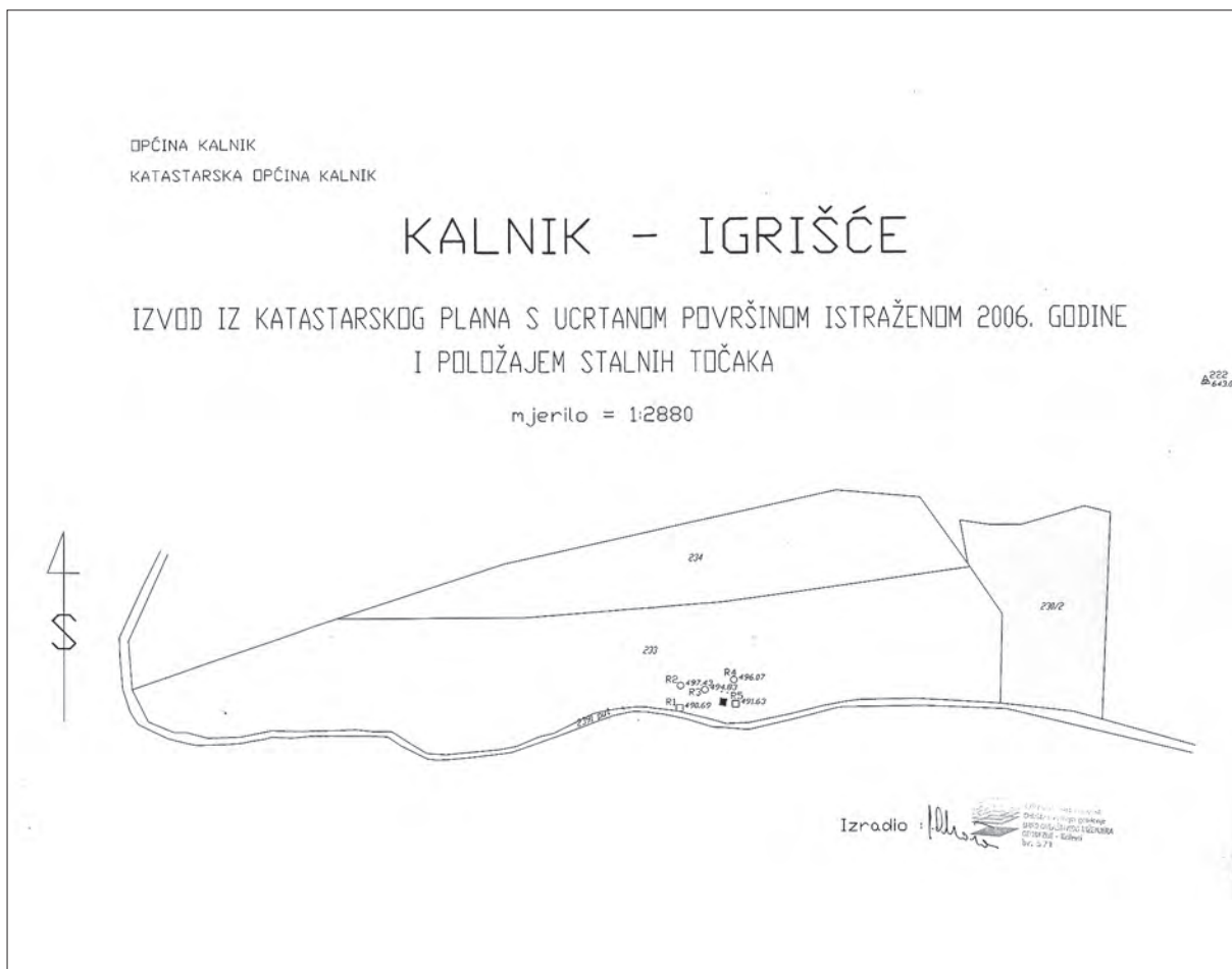
Sl. 2. Katastarska čestica 233 (Hrvatske šume) s ucrtanim položajem sonde