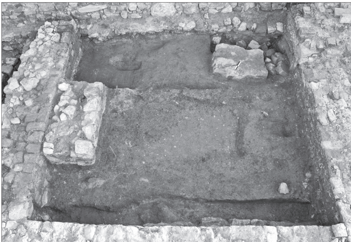
Sl. 3. Sjeverna sakristija tijekom istraživanja