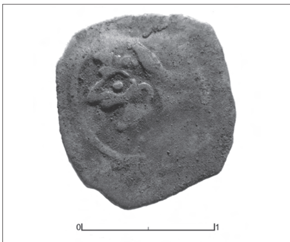
Sl. 2. Pfenig, kovan u Münchenu (vjerojatno 1435-1438)

Fig. 2. A pfennig minted in Munich (probably between 1435-1438)