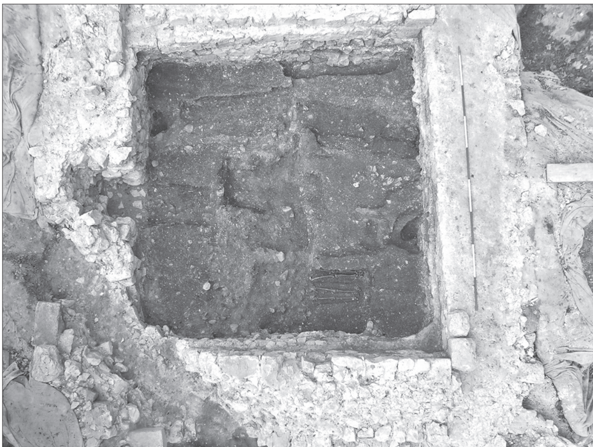
Sl. 1. Pogled na istraživano svetište crkve Sv. Ivana u Ivancu