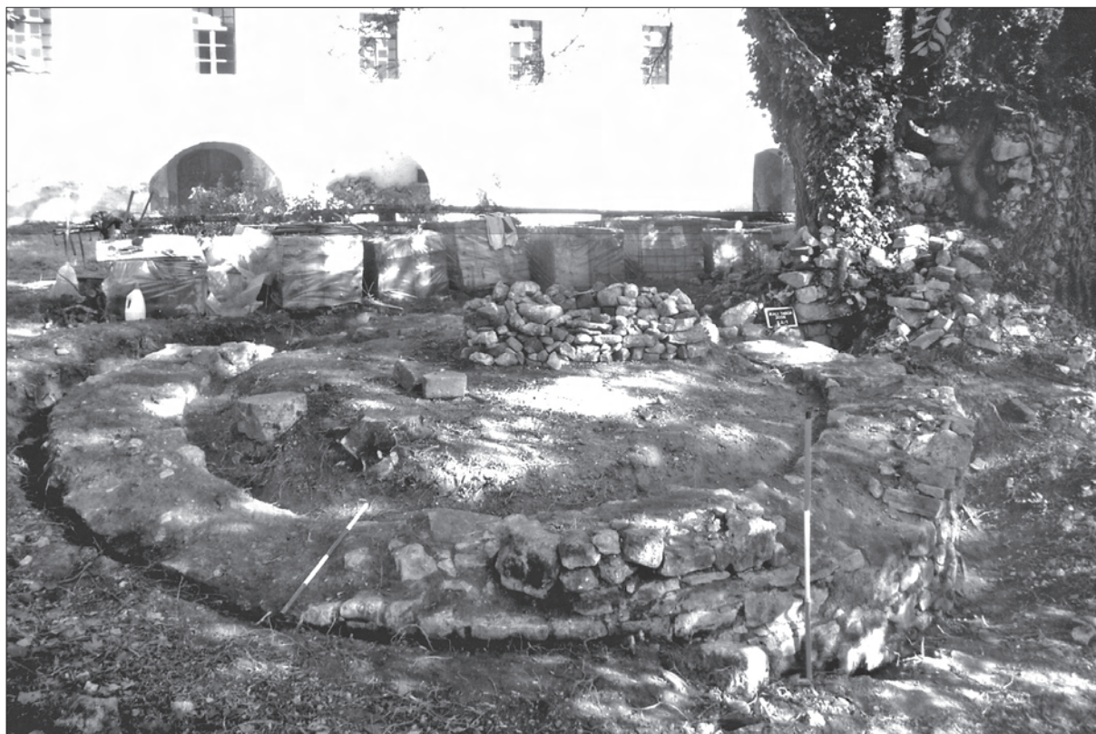
Sl. 3. Mali Tabor, položaj četvrtje sjeverozapadne kule dvorca