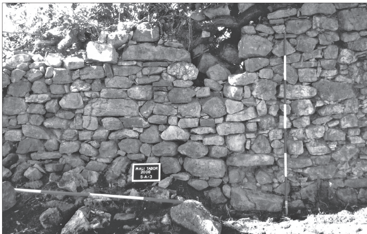
Sl. 2. Mali Tabor, unutrašnje lice zapadnog zida dvorca