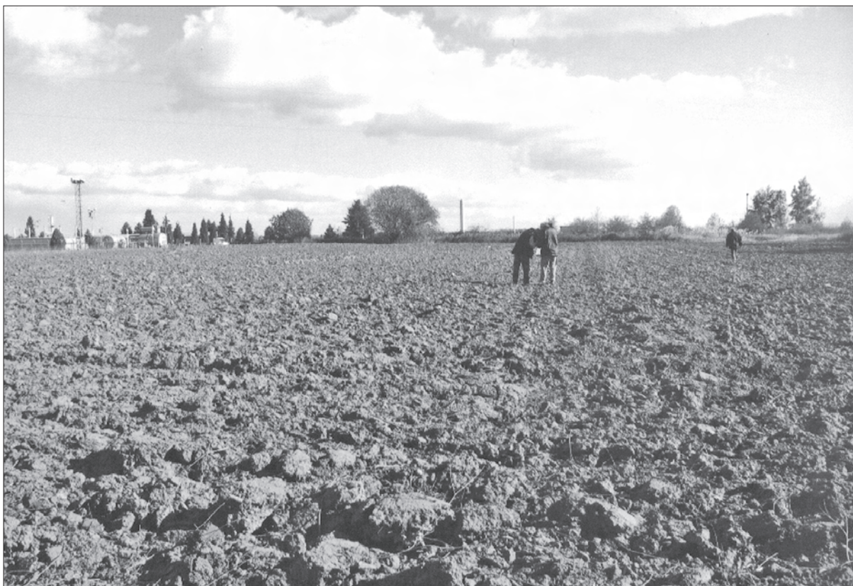
Sl. 2. Lokalitet br.18: Bokšić-Centralna plinska stanica, pogled prema jugu.