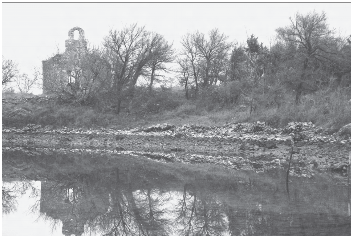
Sl. 1. Zaljev Soline (Krk), 2006. g., položaj lokaliteta u uvali Svetog Petra

Key words: the bay of Soline, lagoon Sv. Petar; Roman period, ceramic fragments