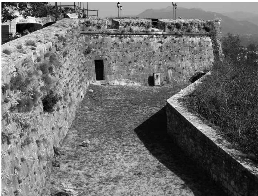
Knin, predbedem i bastion Pisani Knin, outer rampart and Pisani's bastion

ožujka Sagredo bilježi kako se Jančić vratio s tog putovanja; u Modonu se uvjerio kako projekt valja ponešto izmijeniti, pa je umjesto zamišljenog manjeg bastiona predvidio podizanje drukčije građevine, koju je nazvao »galleria in caponiera«. 51 Utvrdama Riona nije trebalo bitno mijenjati projekt, a doznajemo da ga je Jančić držao dijelom većega sklopa što ga je tek valjalo izvesti. Odlazeći iz Modona i Riona, Jančić je inženjerima zaduženim za te utvrde ostavio upute kako bi mogli voditi gradnju. U Modonu je valjalo započeti skrivenim putom , a u drugoj utvrdi uređivanjem predbedema i obuhvaćanjem pješčanog istaka.