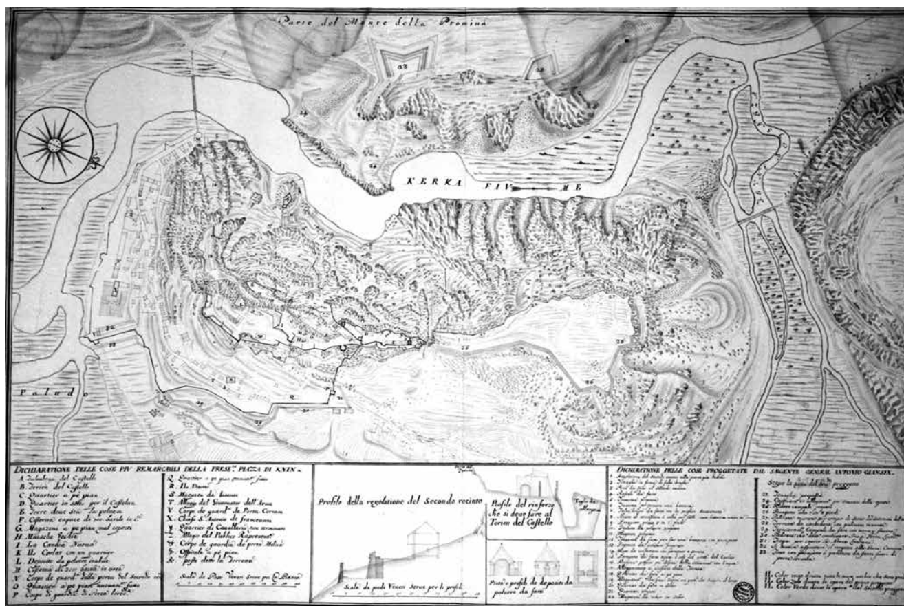
Knin, projektirani Jančićevi zahvati, oko 1710. (Biblioteca del Museo Correr, Venecija) Knin, Jančić's reconstruction plan, ca. 1710 (Biblioteca del Museo Correr, Venice)

ideje utvrđivanja« primijenjenima u dva zasebna projekta: 21 prvi, koji sam autor preporučuje, značio je utvrđivanje jezgre utvrde, tj. gornjih obzida (recinkta), povezivanje s rijekom, podizanje spremišta i vojarni, a predviđen trošak bio mu je 17.552 srebrnih dukata. Drugi pak značio je izgradnju tenalja i reduta na nasuprotnoj uzvisini Promine, dva kaponira u podnožju, poboljšanje stanja kninskog naselja, čemu je trošak imao biti 14.449 dukata. U sklopu prvog prijedloga nalazimo precizan opis onoga što je Jančić zamislio na jugoistočnoj strani: valjalo je dotadašnje kurtine (u njegovu prikazu označeno tamnom crtom) dijelom pretvoriti u predbedeme («riducendo parte del presente (?) ristretto muro in falsabraga»), a nove bedeme načiniti na uvučenijoj liniji («ritirando il Recinto ...»). Posve jasno je to vidljivo na njegovu prikazu Knina, gdje se opaža plitak bastion Vendramin s planiranim dubljim položajem bedema, ali i novooblikovani bastion na susjednom položaju dotadašnjih vrata. Takvo rješenje je i ostvareno, a novi bastion, koji je postao glavnim i ulaznim, ponio je ime Pisani, prema generalnom providuru Carlu Pisaniju.