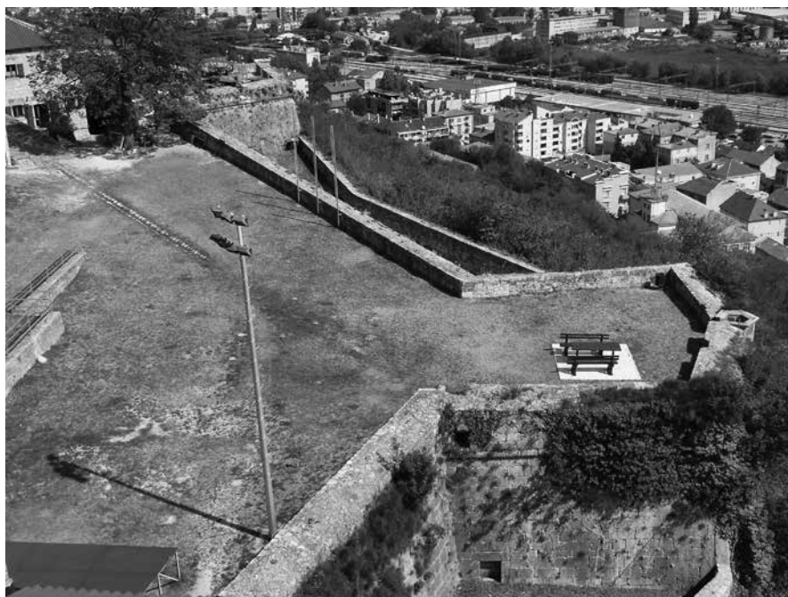
Knin, bastion Vendramin Knin, Vendramin's bastion

prvorazrednim tvrđavama, zajedno s Veronom, Brescijom, Palmanovom, Zadrom, Krfom i Nauplijem. 24