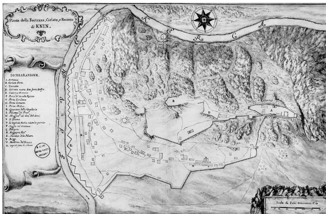
Knin, G. Juster, 1708. (Kriegsarchiv, Beč) Knin, G. Juster, 1708. (Kriegsarchiv, Vienna)