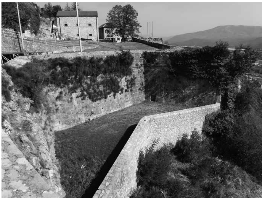
Knin, predbedem i bastion Vendramin Knin, outer rampart and Vendramin's bastion

No novi providur Agostino Sagredo odlučno je prišao utvrđivanju Palamidija, tražeći, kako smo vidjeli, projekt od Jančića. Riječ je bila nesumnjivo o novoj zamisli, kojom je Jančić – riječima samog providura – različite visine zaposjeo zasebnim građevinama. 39 U Sagredovu točnom opisu navodi se da je na gradu najbližoj uzvisini predvidio jedan bastion (bit će to »bastion« S. Girardo), na sljedećoj jednu redutu zaštićenu dubokim jarkom (riječ je o »baluardo staccato«), na trećoj udvojeni skriveni put (uistinu će tu biti polubastion S. Agostino), na kosini pod baluardo staccato također odvojeni ravelin (»una specie di Rivellino staccato«), napokon naprijed prema prilaznom pravcu bastion s dva polubastiona. Sagredu je Jančić predočio i smisao takvoga komponiranja utvrde, a taj je da su elementi povezani u cjelinu i da se međusobno ispomažu i podupiru. 40 Gradnja utvrde dobro je napredovala, do listopada 1713. bilo je utrošeno 33.935 dukata, 41 a do kraja djelovanja providura Sagreda u Naupliju 1714. godine 53.081 dukat. 42 Jančić je cijelo to vrijeme obilazio druge važne utvrde, na Peloponezu i drugdje, ali se na zahtjev providurov vraćao kako bi nadgledao nastavak radova na Palamidiju. 43