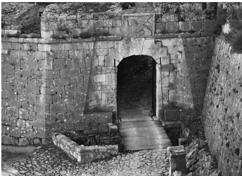
8 Knin, ulaz kroz bastion Pisani Knin, entrance through Pisani's bastion

potreba S. Maure s posadom od 2.000 ljudi, u slučaju opsade što traje 60 dana. 63