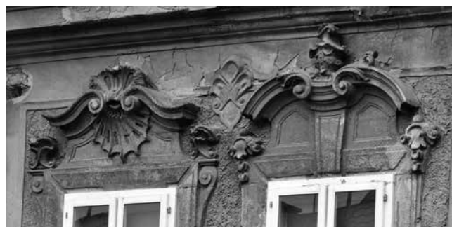
8 Osijek, kuća Kohlhoffer, prozori u prvoj i drugoj osi kata

U malenom mjerilu građanske katnice osječke Tvrđe zapažaju se, dakle, obilježja slična Mayerhofferovoj arhitekturi gradskih palača. Iako strogo ograničen urbanističkim uvjetima i postojećom izgradnjom, volumen kuće Kohlhoffer je izrazito