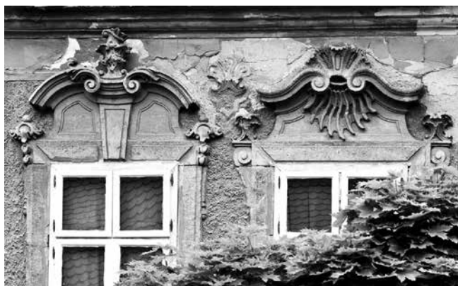
21 Osijek, kuća Kohlhoffer, prozori u četvrtoj i petoj osi kata

Osijek, Kohlhoffer House, window pediments in the fourth and fifth bays on the first floor