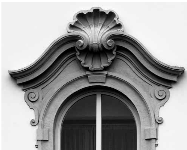
19 Požun, ljetna nadbiskupska palača, nadstrešnica prozora, F. A. Hillebrandt

Bratislava, Archiepiscopal Summer Palace, window pediment by F. A. Hillebrandt