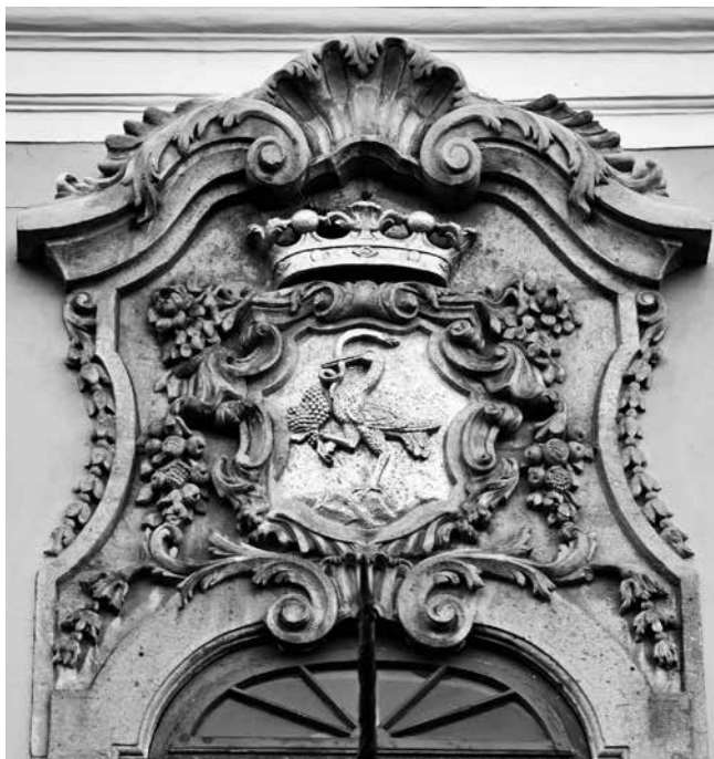
18 Eger, županijska palača, nadstrešnica prozora na glavnom pročelju, M. Gerl

Eger, County Palace, window pediment on the main façade