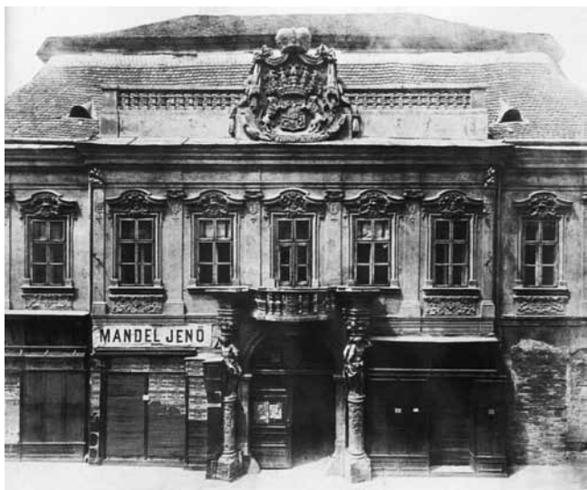
4 Budimpešta, palača Grassalkovich, kasnije porušena

Nagytétényi, Száraz-Rudnyánszky Mansion, a façade detail