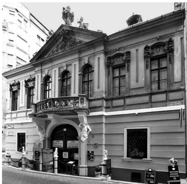
5 Budimpešta, palača Péterffy

Budapest, Grassalkovich Palace, later demolished.