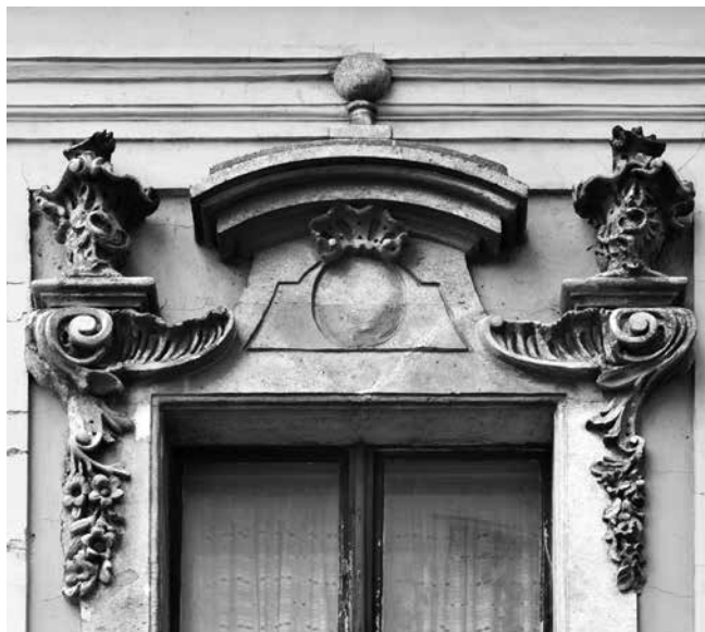
22 Budimpešta, palača Péterffy, nadstrešnica prozora

Budapest, Pauline church (later University Church), lambrequin