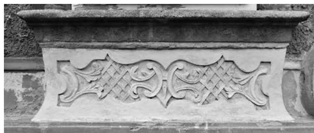
23 Osijek, kuća Kohlhoffer, parapet prozora u drugoj osi kata tijekom restauracije 2012. g.

Osijek, Kohlhoffer House, window pediments in the fourth and fifth bays on the first floor