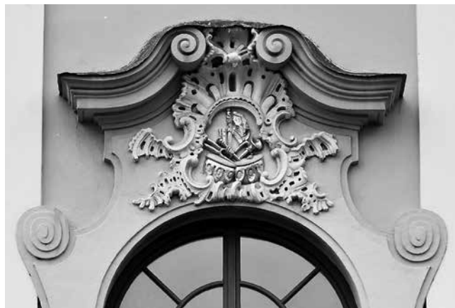
13 Gödöllő, dvorac Grassalkovich, prozor na rizalitu Gödöllő, Grassalkovich Mansion, window pediment on the main façade projection