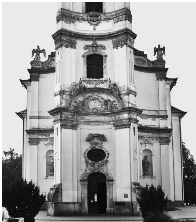
16 Jászberény, župna crkva, detalj pročelja Jászberény, parish church, a façade detail

sin János 1759.–61. godine, 55 javljaju se niše sa skulpturama koje imaju slične nadstrešnice, sa sučelice postavljenim odsječcima kamenih voluta između kojih se uzdiže palmeta (sl. 14.), dok se ispod njih formira uleknuto polje s pločastim motivom zaglavnog kamena, također čestim kod Mayerhoffera. Općenito, u bujnom ukrasu ovog zvonika snažno su prisutni volutni oblici formirani na profilacijama vijenaca, kapitelima pilastara i drugdje (sl. 16.). U segmentnom zabatu