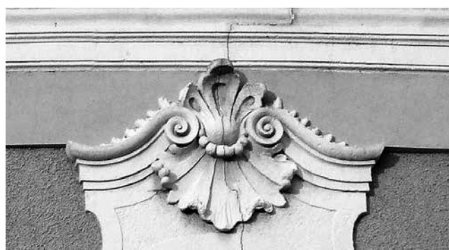
10 Kaloča, katedrala, nadstrešnica ovalnog prozora u središnjoj osi glavnog pročelja

Osijek, Kohlhoffer House, window pediment in the first bay of the first floor