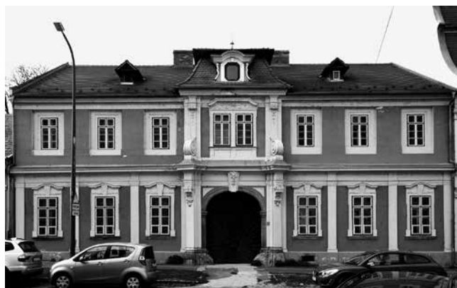
7 Ostrogon, kuća Pethö-Meszéna