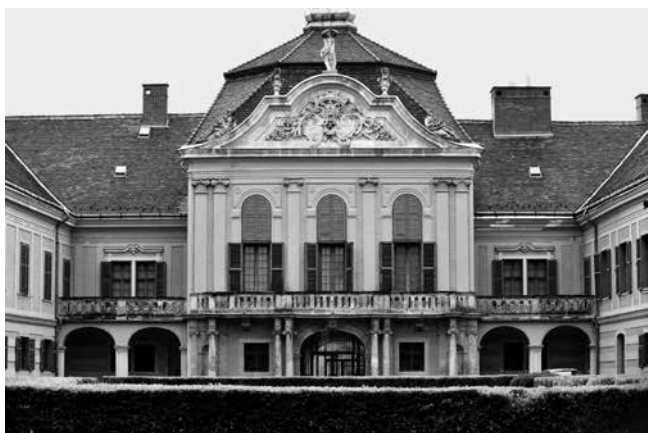
3 Nagytétényi, dvorac Száraz-Rudnyánszky, detalj pročelja

Arhitektonski stil Andreasa Mayerhoffera izrazite je plastičke i dinamičke kvalitete. Karakterizira ga složena arhitektonska kompozicija bogate raščlambe i bujne ornamentike. Profana zdanja, a to su prije svega ladanjski dvorci, odlikuju se gradiranjem prostornih volumena različite visine te snažnim isticanjem kula i rizalita, koji se uzdižu od ostatka volumena, dobivajući vlastito krovište i poprimajući izgled paviljona ukorporiranih u tijelo građevnog sklopa (sl. 3.). 45 Neobično važnu ulogu imaju i mansardni krovovi, koji mogu biti pokriveni crijepom, limom ili šindrom, a koji se oblikuju u kupolaste i lukovičaste oblike, stvarajući iznimne dinamičke efekte u cjelokupnoj artikulaciji građevine. U artikulaciji zid-