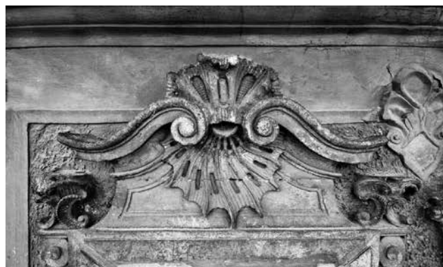
9 Osijek, kuća Kohlhoffer, nadstrešnica prozora u prvoj osi kata

Osijek, Kohlhoffer House, windows in the first and second bays of the first floor