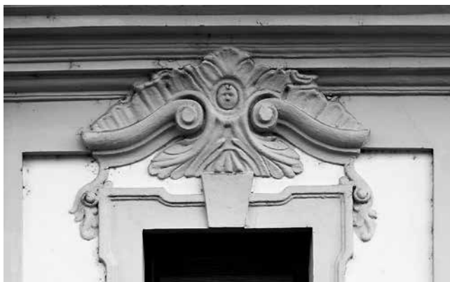
20 Ostrogon, pavlinska rezidencija, nadstrešnica prozora, I. Oracek

Bratislava, Archiepiscopal Summer Palace, window pediment by F. A. Hillebrandt