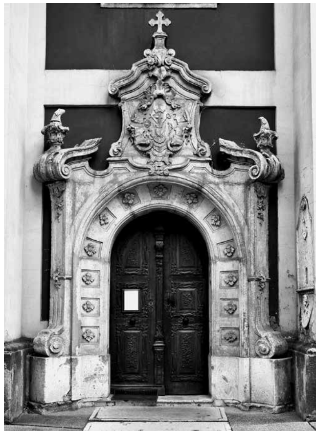
17 Szentendre, Saborna crkva, bočni portal Szentendre, Orthodox Episcopal Church, side portal

sin János 1759.–61. godine, 55 javljaju se niše sa skulpturama koje imaju slične nadstrešnice, sa sučelice postavljenim odsječcima kamenih voluta između kojih se uzdiže palmeta (sl. 14.), dok se ispod njih formira uleknuto polje s pločastim motivom zaglavnog kamena, također čestim kod Mayerhoffera. Općenito, u bujnom ukrasu ovog zvonika snažno su prisutni volutni oblici formirani na profilacijama vijenaca, kapitelima pilastara i drugdje (sl. 16.). U segmentnom zabatu