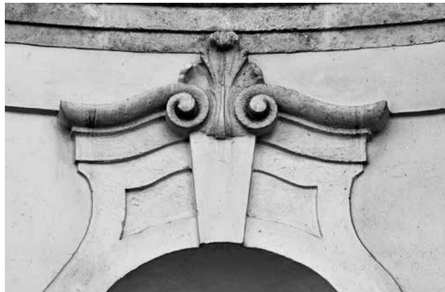
14 Jászberény, župna crkva, nadstrešnica niše sa skulpturom Jászberény, parish church, niche pediment with sculpture

litno istaknuta i naglašena stiješnjem segmentnim zabatom iznad kojeg se uzdiže velika krovna kućica. Ta, možemo reći, predimenzionirana krovna kućica ima istaknuti značaj na vrlo strmom, gotovo mansardnom krovu kuće.