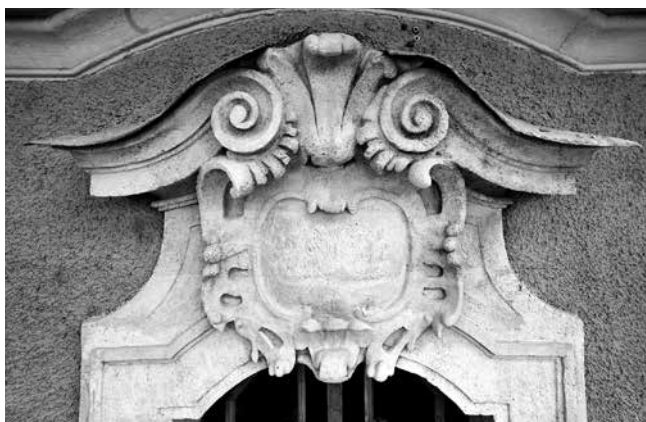
12 Kaloča, katedrala, nadstrešnica bočnog portala u prizemlju glavnog pročelja Cathedral of Kalocsa, side portal pediment on the ground floor of the main façade