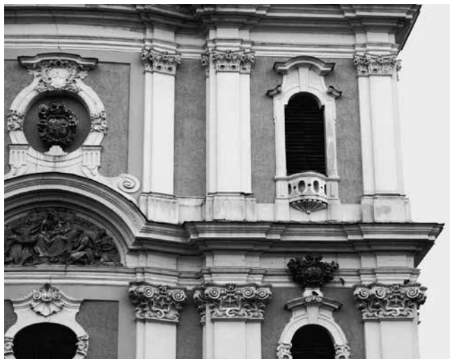
15 Kaloča, katedrala, detalj pročelja Cathedral of Kalocsa, a façade detail