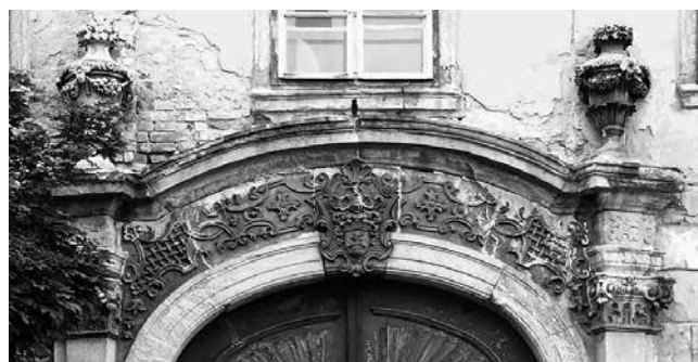
25 Ostrogon, palača Sándor, detalj glavnog portala

Budapest, Péterffy Palace, window pediment