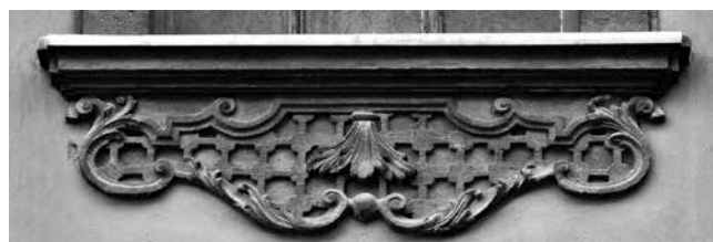
24 Budimpešta, pavlinska (kasnije sveučilišna) crkva, lambrekren prozora

Osijek, Kohlhoffer House, window parapet in the second bay of the first floor, during restoration works in 2012