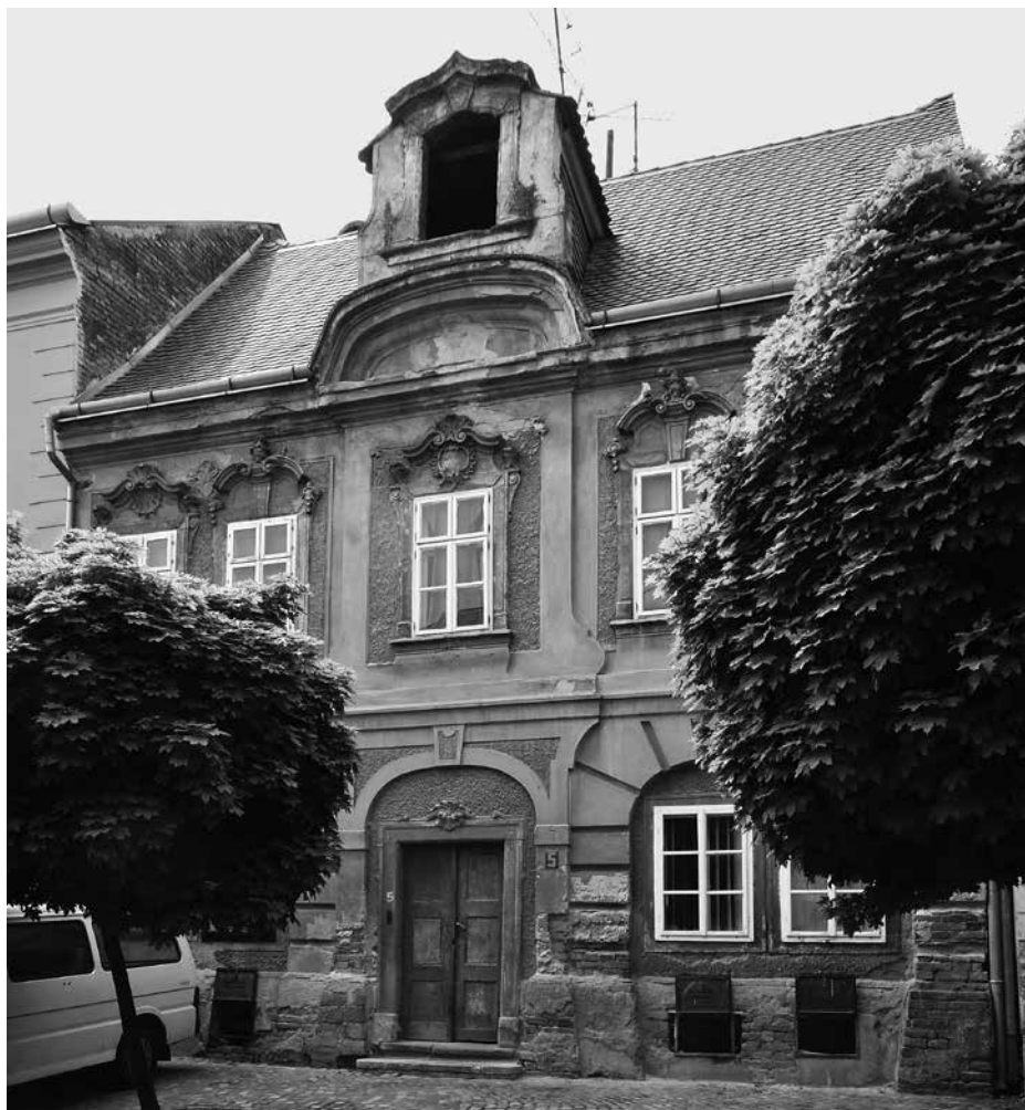
1 Osijek, kuća Kohlhoffer, pročelje Osijek, Kohlhoffer House, façade