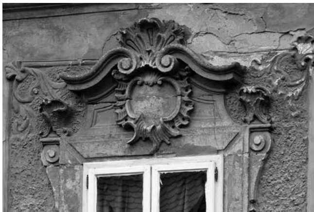
11 Osijek, kuća Kohlhoffer, nadstrešnica prozora u središnjoj osi kata Osijek, Kohlhoffer House, window pediment in the central bay of the first floor