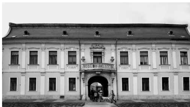
6 Ostrogon, palača Terstyánszky