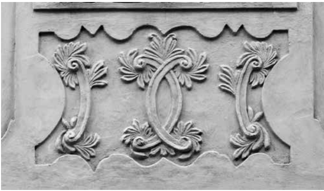
26 Osijek, kuća Küner u Ul. Franje Markovića 5, parapet prozora

Osijek, Küner House at Franje Markovića Street No. 5, window parapet