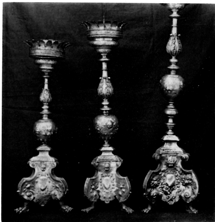
1 Svijećnjaci XVIII. st. iz crkve sv. Roka, Korčula

II. par, visina 63 cm, raspon stope 24 cm, promjer čaške 13 cm. Srebro lijevano, kovano, cizelirano, gravirano. Žigovi: mletački, Z kula C, a na podnožju i dosta nečitko FS.