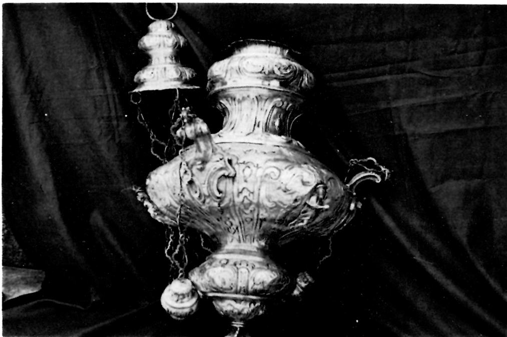
5 Viseća svjetiljka XVIII. st. iz Bratovštine sv. Roka, katedrala, Korčula

lance trostrukih veriga, s ovećom ukrasnom kruškom u sredini svakog lanca. Poklopac je dvostruko ispupčen. Na središnjem dijelu posude pričvršćeni su likovi u visokom reljefu: 1. Sv. Rok sa psom, 2. Sv. Sebastijan 3. Bogorodica s Djetetom. U gornjem dijelu posude između držaka teče uokolo urezani natpis: PROCURATOR DELLA SCOLA DI SAN ROCHO ZUANE DE ANGELIS PROCURATORE DELLA SCOLA DI SAN ROCHO SALVATOR DOBROSICH 1774. (sl. 5).