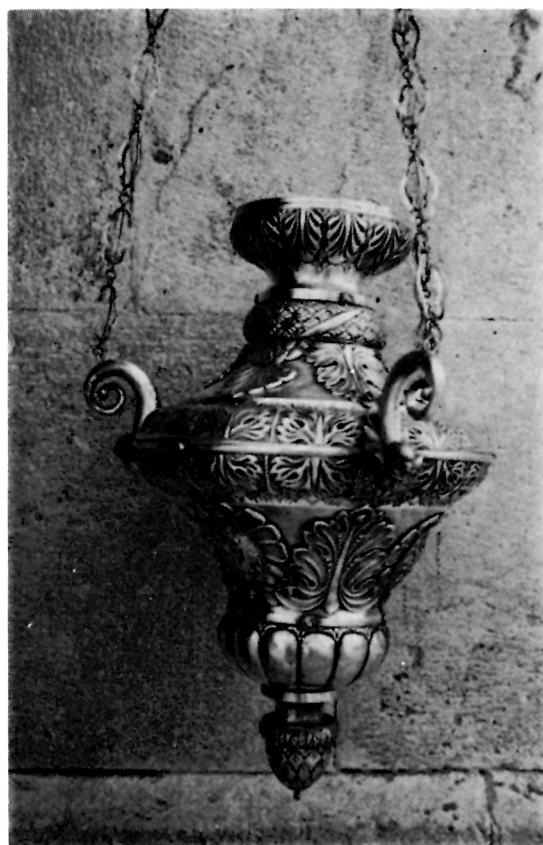
7 Vicko Caenazzo: Viseća svjetiljka XIX. st. iz Bratovštine Svih Svetih, Korčula

Na dnu svjetiljke je veliki kruškoliki akroterij, obuhvaćen izvijenim listovima. Okrugla posuda ukrašena je raskošno isprepletenim viticama i lišćem što pokriva cijelu površinu i okružuje tri ovalna medaljona. U prvom je natpis: MDCCCXIV, u drugom CURZOLA, a u trećem: Confraternita d ogni Santi e della buona morte. Posuda prelazi u uski vrat, gore proširen u obliku zvonolikog cvijeta. Rub otvora rađen je na proboj u sitnom lisnatom ukrasu. Zaobljeni poklopac drži tri lanca ovalnih veriga, s kuglama u sredini. Lanci su na posudu pričvršćeni s tri vitice, s lišćem i cvijetom. (sl. 8). Svjetiljka je izvedena u neobaroknom stilu, visokim tehničkim umijećem. Kao cjelina skladna je svojim raskošnim ukrasom i oblikom. Prema žigu nastala je na području Austro-Ugarske 1866. god. no očito nije djelo mjesnog zlatara, već je dobavljena izvana najvjerojatnije iz Beča, gdje se u to vrijeme često kupuju dragocjenosti i ostalo. U dokumentima Bratovštine nema podataka gdje je ta svjetiljka kupljena ni koliko je plaćena. Opat Trojanis pisao je, doduše, 1894. godine milanskom zlataru Luigiju del Bo, tražeći nacrt i cijenu manje svjetiljke. 43 Kod istog obrtnika nabavljena je pokaznica i još neki predmeti, no na njima je drugi žig, 44 pa iz toga zaključujemo da svjetiljku nisu kupili kod njega.