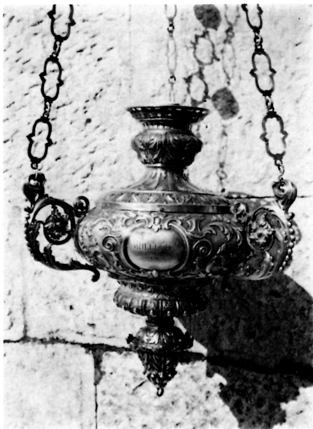
8 Viseća svjetiljka XIX. st. iz Bratovštine Svih Svetih, Korčula

Dokument o sastanku uprave Bratovštine 12. kolovoza 1894. govori da je predloženo da se kupi srebrna svjetiljka, koja bi se stavila kod oltara sv. Ane u crkvi Svih Svetih. 45 U kasnijim inventarima svjetiljka se već spominje, kao i to da je dobavljena 1895. godine. 46