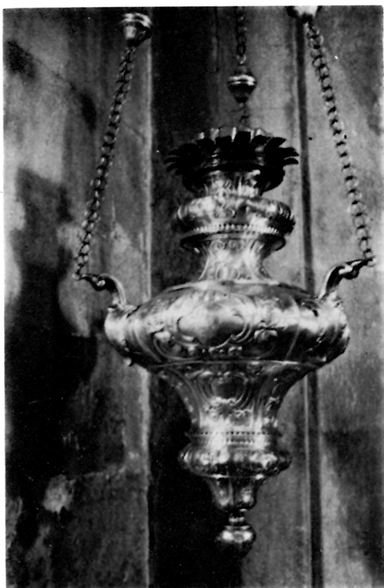
4 Viseća svjetiljka XIX. st. iz katedrale, Korčula