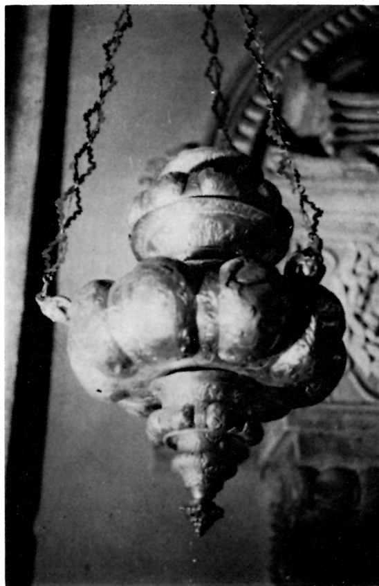
3 Viseća svjetiljka XVIII. st. iz crkve sv. Trojstva (katedrala), Korčula

Svjetiljke glavnog oltara . Dvije svjetiljke međusobno sasvim jednake. Težina svake je oko 3 kg (232 unce), dužina s lancima 145 cm, visina posude 70 cm, promjer 40 cm, srebro lijevano, kovano, cizelirano, gravirano. Žigovi: šesterokut s planetama i sipa.