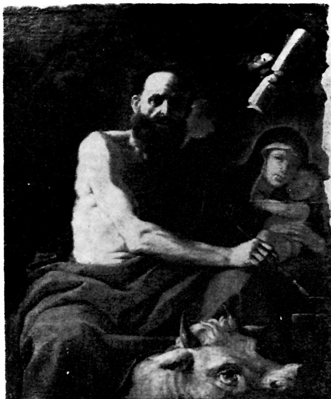
Mattia Preti, S. Luca. — Catania, Museo di Castello Ursino

Die Autoren publizieren die erhaltenen silbernen Leuchter und Ampeln in den Kirchen von Korčula und das archivalische Quellenmaterial, das sich auf sie bezieht. Die Kathedrale von Korčula und die Laienbruderschaften in der Stadt besitzen 28 Silberleuchter aus Venezianischen Goldschmiedwerkstätten des 17. und 18. Jahrhunderts. Daneben hängen in der Kathedrale 8 silberne Ampeln, in der Kirche des hl. Michael eine Ampel, und am Altar des hl. Rochus ebenda auch eine Ampel. Alle Ampeln sind Vene-