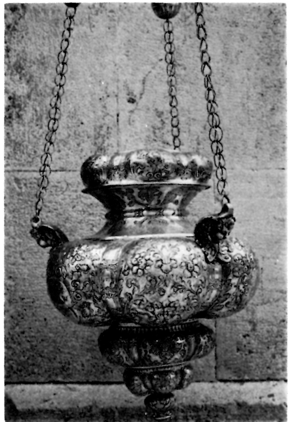
6 Viseća svjetiljka XVIII. st. iz Bratovštine Svih Svetih, Korčula

Svjetiljka II. — sv. Josipa. Dužina s lancima 1,40 m, visina posude 55 cm, a promjer 40 cm. Srebro lijevano, kucano, cizelirano, gravirano. Žig: VC.