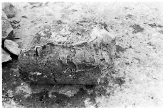
Ulomak stupa s grbom dužda Leonarda Priulija

već 1542. godine radio na javnim građevinama u Korčuli, a njegovo ime se posljednji put spominje 1602. godine. Djelovao je dakle u rasponu šezdeset godina što je sigurno cijeli njegov radni vijek.