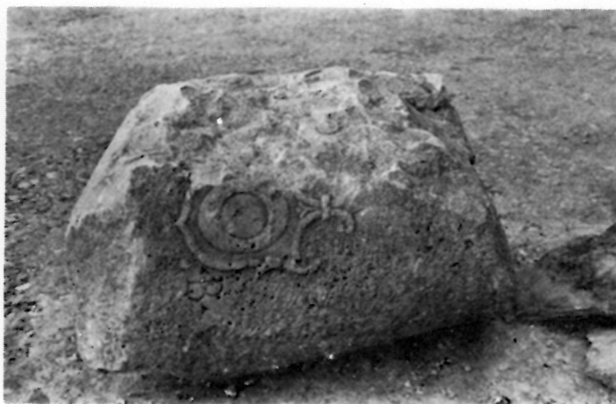
Ulomak stupa s grbom kneza Marina Barbara