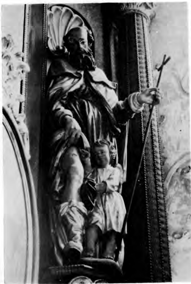
10 Sv. Rok s oltara sv. mučenika