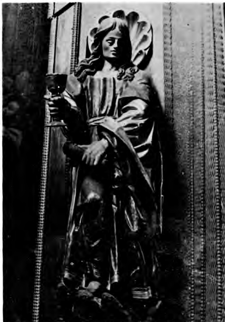
25 Zagreb, sv. Katarina, Ivan evangelist s oltara sv. apostola