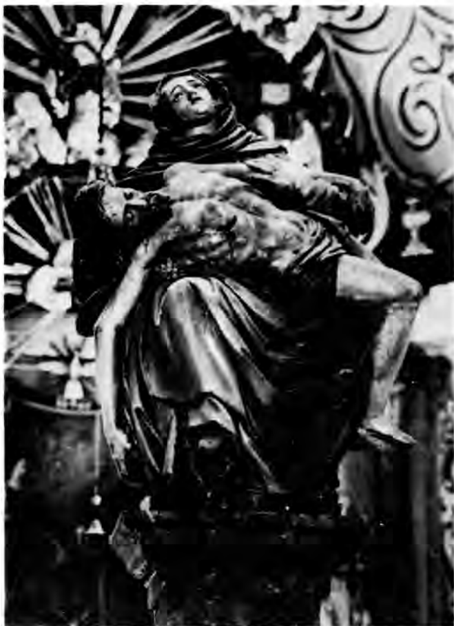
23 Križevci, pil Marije Koruške u istoimenoj crkvi

Koruške stajao na otvorenom, dok nije konačno na tom mjestu bila sagrađena oko godine 1720. barokna crkva Marije Koruške, 53 u kojoj je kip Žalosne Marije kojem je puk pripisivao čudotvornu moć, i koji je privlačio sve više vjernika dobio istaknuto mjesto u sklopu glavnog oltara. 54 Danas stup s kipom stoji na sredini crkve pod kupolom.