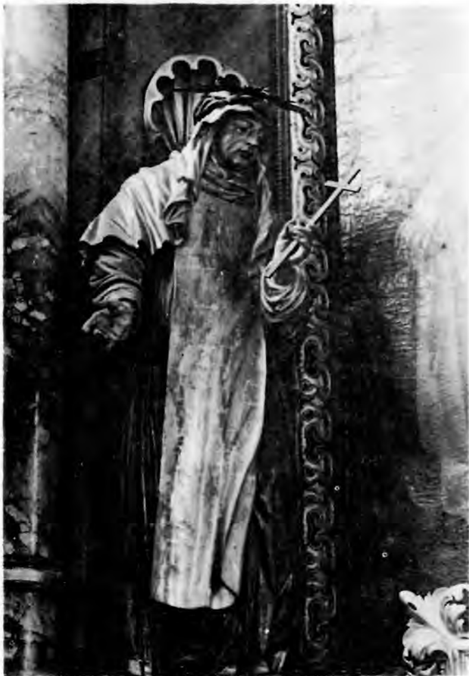
5 Sv. Katarina Sienska s oltara sv. Apolonije