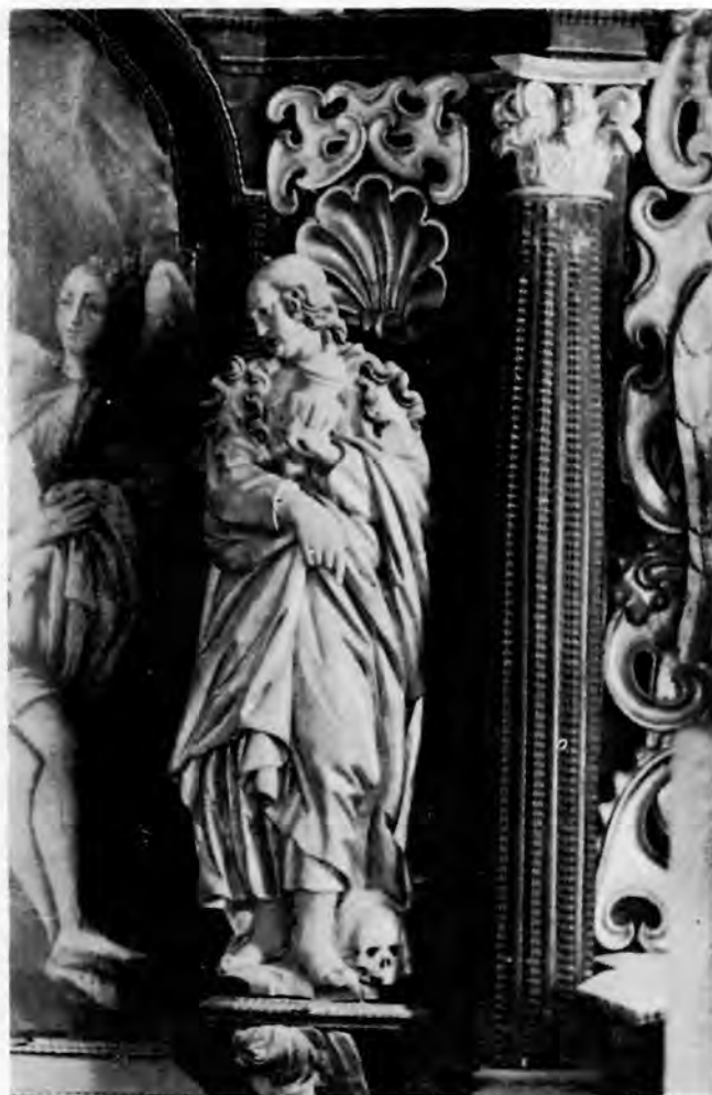
14 Sv. Marija Magdalena s oltara Žalosne Marije