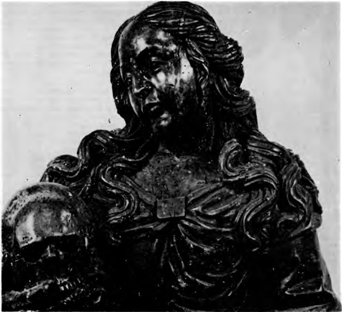
15 Sv. Marija Magdalena iz Diecezanskog muzeja u Zagrebu

nas nalazi u Diecezanskom muzeju u Zagrebu, 38 a kip Imakulate u privatnom posjedu. 39 Jedna i druga svetica imaju tipičnu usku siluetu koja se sužuje prema stopalima, a postrance proširuje u visini koljena, gdje se teški okrajak rukom podignuta plašta grupira u cjevastim naborima. Haljina modelira grudni koš ukrštenim naborićima, ali se tijelo, premda dosta masivno, samo s teškoćom suprotstavlja težini i masi draperije. Blok figure je sapet čvrstim i zatvorenim obrisom i vanjski je pokret jedva primjetan. Osnovno raspoloženje posve je pasivno i prigušeno, kao gotovo uvijek kod Altenbachovih kipova. Mesnati ovali lica niskih, mesnatih obraza i vrlo visoka čela, s kosom koja se razdjeljkom priljubljuje uz tjeme, da bi se dugačkim, raspletenim pramenovima raširila preko ramena i spuстила na grudni, osobito su karakteristična za djelo varaždinskog kipara. Osobito se Marija Magdalena iz Diecezanskog muzeja (sl. 15) odlikuje brižljivom i kvalitetnom izvedbom detalja i jedan je od najboljih njegovih kipova uopće.