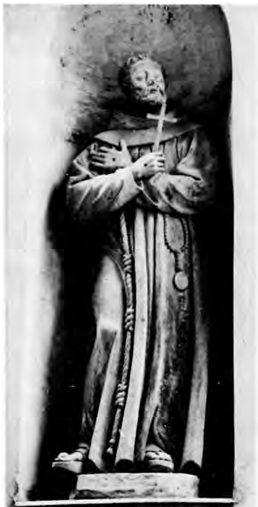
17 Varaždin, pročelje franjevačke crkve, sv. Franjo Asiški