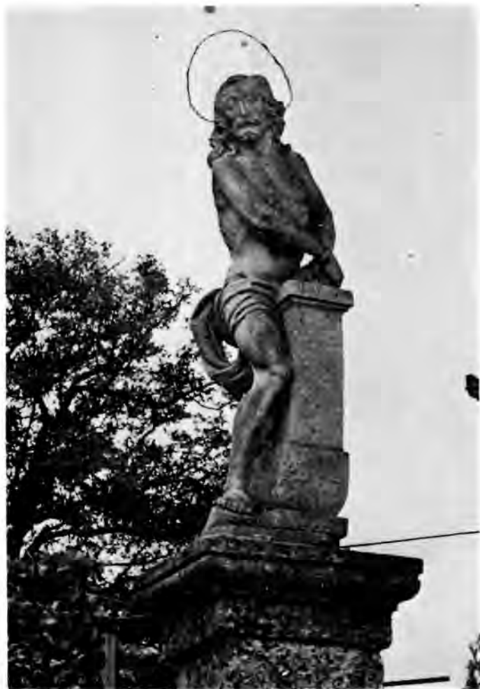
20 Lepoglava, Krist uz stup za bičevanje

i uskim okrajkom zataknutim u pojas. Usko lice s naglašenim ličnim kostima, ispučenom usnom i kratkom, spiralno uvijenom bradom ima već poznate Altenbachove poteze, a spuštene vjeđe odaju pasivnu patnju. Gusti spletovi kose koji padaju na ramena i leđa jače su stilizirani nego što to poznajemo kod drvenih kipova, među kojima ovom atletsom kipu ne nalazimo paralele. Njegovo postavljanje u neposrednoj blizini lepoglavskog samostana može se možda dovesti u vezu sa samim pavlinima, ali i s nekim svjetovnim donatorom reda. O vremenu njegova nastanka nema podataka, a po čvrstim zbijenim oblicima tijela snažnih udova i jaka vrata, kao i po naglašenoj stilizaciji kose i pojasnice mogli bismo zaključiti da su tu odjeci kasnog manirizma prisutni u mjeri koja opravdava pretpostavku da je ovaj lepoglavski kip jedno od ranijih djela varaždinskog kipara.