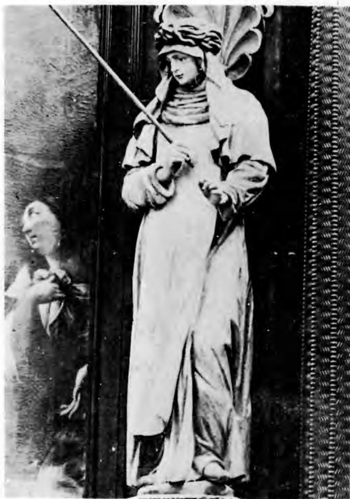
13 Sv. Katarina Sienska s oltara Žalosne Marije