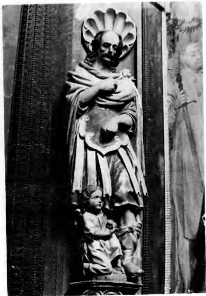
11 Sv. Sebastijan s oltara sv. mučenika

Broj kipova na oltarima crkve sv. Katarine i njihova ikonografska raznolikost pružaju obilje podataka o Altenbachovu stilu rezbarenja svetačkih likova, o njegovu izboru kostima i tretmanu nabora, o tipologiji muških i ženskih fizionomija, obradi kose i brada, oblikovanju šaka i stopala, o gestici i drugim detaljima, dakle o svemu što je specifično i karakteristično za tog kipara i što nam omogućuje da mu atribuiramo i druga djela. Međutim, unatoč tome da je Ivan Jakob Altenbach očito bio jedan od najboljih kipara svojega vremena u sjeverozapadnoj Hrvatskoj i da je kudikamo nadmašio svoje suvremenike iz kruga domaćih kipara, malo je njegovih djela sačuvano do danas, a začudo, upravo u Varaždinu, gdje je živio i imao radionicu, nalazimo u crkvama i kapelama malo tragova njegove djelatnosti kao drvorezbara. Njegov je sačuvani opus u drvu općenito uzevši jako malen i uz kipove za oltare crkve sv. Katarine ograničen na djela za Lepoglavu i Drogovec i nekoliko usamljenih kipova, dijelova izgubljenih većih cjelina o kojima više ništa ne možemo saznati. Sve su to djela koja se mogu Altenbachu pripisati na temelju tipoloških karakteristika, jer ne postoje pisani izvori.