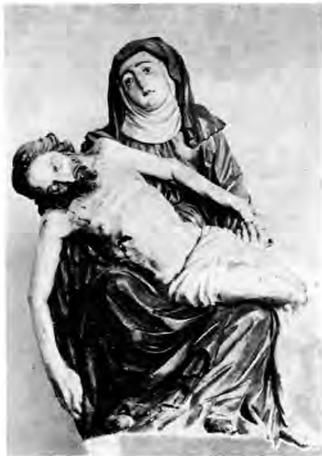
24 Gradec, župna crkva, pil Zalosne Marije