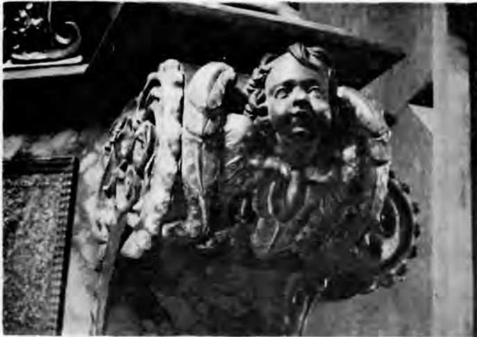
8 Anđeoska glavica s oltara sv. apostola

hvaćaju atribute. Mađarska kraljevna Elizabeta istaknuta je širokim rukavima i jabučastom krunom. Kod Agneze i Cecilije slični su efekti postignuti mekanim i bogatim boranjem tkanine odjeće i pomodnim frizurama. Slične su im svetice s porušenog oltara sv. Barbare , čiji ikonografski program možemo rekonstruirati u glavnim crtama. Sačuvali su se kipovi Marije Magdalene i jedne svetice u odjeći velikašice, možda Katarine ? (sl. 7), te nešto manji kip sv. Margarete i dva velika anđela sa segmenata atike. Četiri su kipa izgubljena, a jedna vijest o požaru g. 1706. napominje da je tada plamen već bio zahvatio prozor do oltara sv. Barbare i prijetio zapaliti kip sv. Ane , koji se prema tome nalazio na drugom kate retabla do prozora. 33