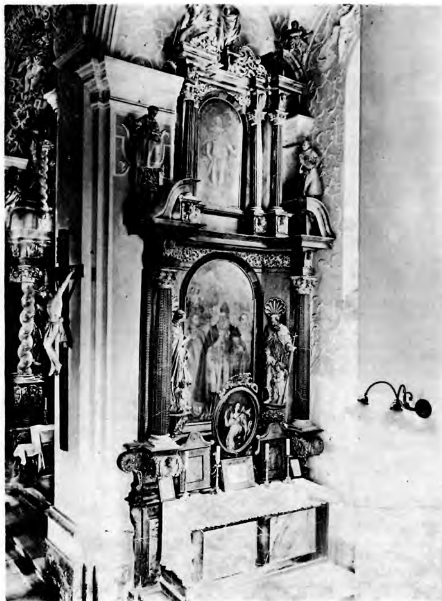
3 Zagreb, crkva sv. Katarine, oltar sv. mučenika (ili sv. Dionizija)

kako je to formulirao J. Matasović, »među tadašnjim slobodnim ljudima važilo kao jedan niži stepen gospodstva«, a nalazimo ga npr. kod uglednijih trgovaca i umjetnika. 14 U Altenbachovu slučaju taj naslov vjerojatno ističe da je bio ugledni i vrlo uvaženi majstor svoje struke. Srednjoevropsko područje s kojeg je sigurno potjecao, čak ako uzmemo u obzir samo njegove subalpske regije, vrlo je prostrano i obiluje umjetničkim snagama, koje su k tome u stalnoj fluktuaciji,