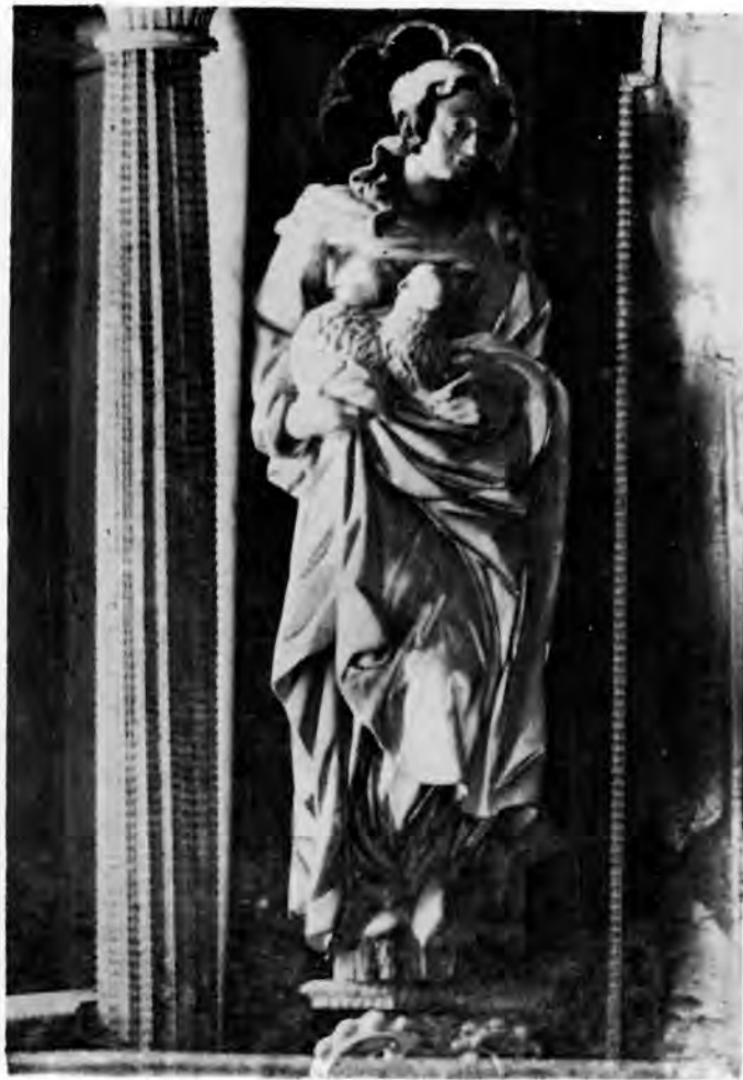
6 Sv. Agneza s oltara sv. Apolonije

U crkvi sv. Katarine stajala su dakle četiri oltara varaždinskih majstora Altenbacha i Derwanta, od kojih su tri potpuno sačuvana, dok od četvrtog, oltara sv. Barbare, postoji još nekoliko kipova. 30 Nema sumnje da su i ta dva oltara bila pandani, a od prethodno opisanog para razlikovala su se samo po obliku okvira središnje slike i po broju stupova i kipova na drugom katu. 31 Sva tri sačuvana retabla prilagođuju se visini i širini čeonih strana pokrajnjih kapela. Komponirani su na dva kata koja su odijeljena uglato lomljenim, profiliranim gređem sa segmentima raskinutih troku-