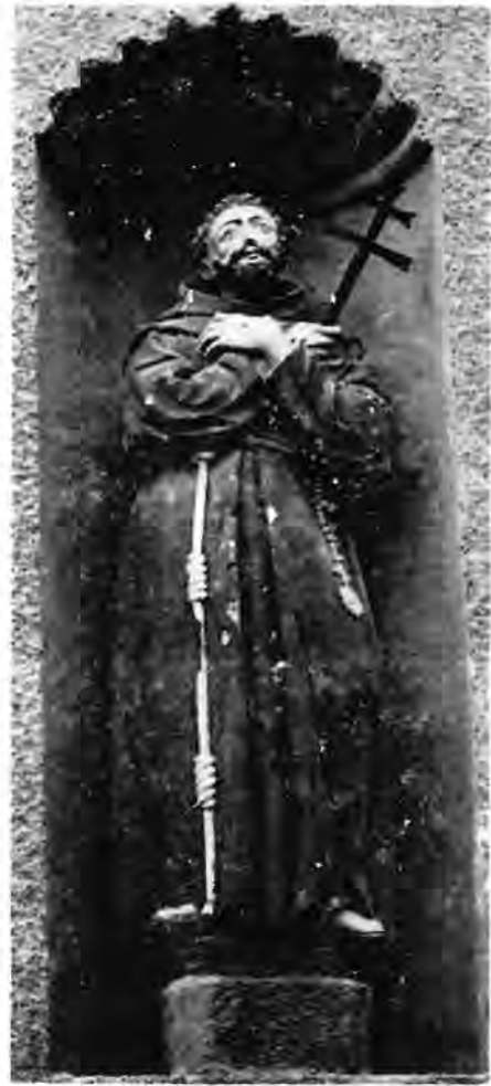
19 Koprivnica, franjevačka crkva, sv. Franjo Asiški

Klesani kipovi varaždinskih franjevac dovode nas do crkve franjevačkog samostana u Koprivnici, gdje u jednoj niši s vanjske strane kapele Otkupitelja također stoji kip sv. Franje (sl. 19) klesan od kamena, koji se u svemu naslanja na varaždinske kipove, opetujući njihov stav i tip lica s karakterističnim rezom očiju i ispupčenom gornjom usnom. Kip vjerojatno potječe iz vremena gradnje crkve i samostana u Koprivnici, 1657—1685. 43 Zanimljivo je da u Loboru postoje dva kipa franjevac, sv. Antun i sv. Franjo , koji se svojim na prsima prekrštenim rukama, snopom nabora po sredini habita i nekim pojedinostima glave usko naslanjaju na Altenbachove kipove, 44 ali ih kvalitetom ne