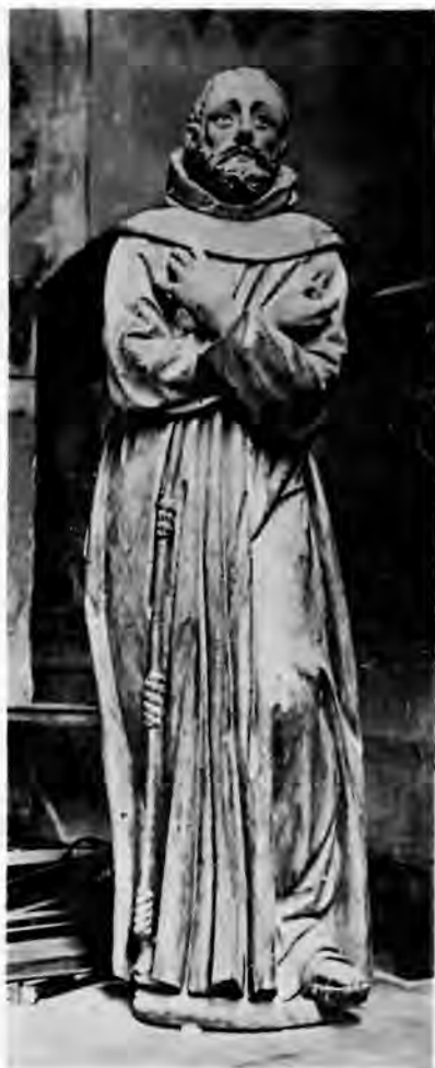
16 Sv. Franjo Asiški s oltara Zalosne Marije u Lepoglavi