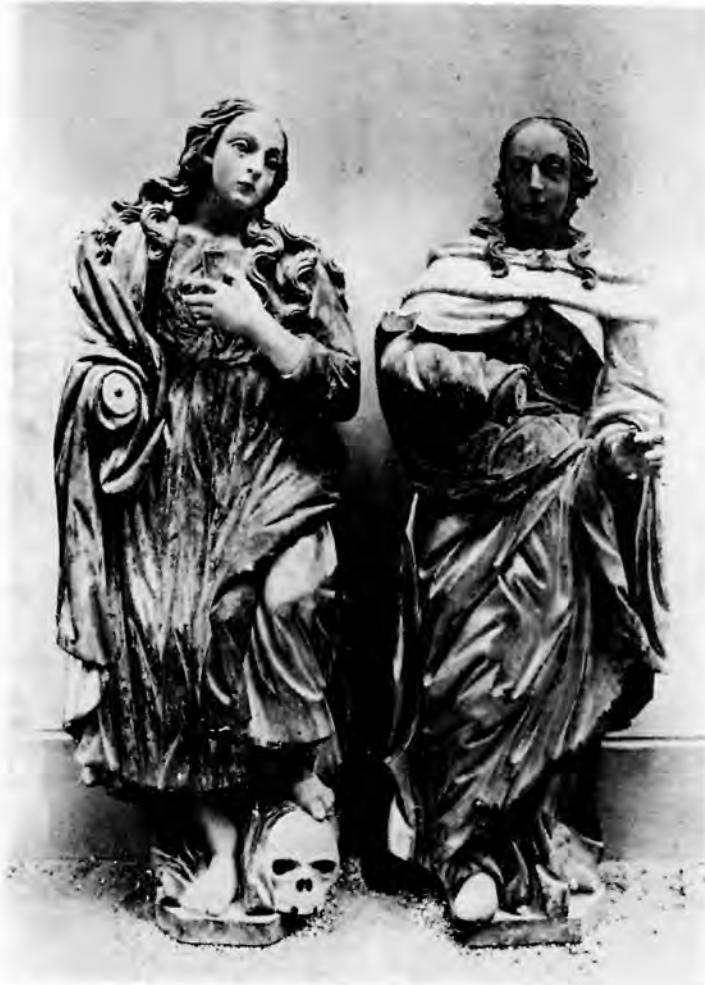
7 Zagreb, crkva sv. Katarine, dvije svete s oltara sv. Barbare

udvostručen, a kipovi su pomaknuti na vanjske rubove retabla, na segmente raskinutih zabata, što u kompoziciju unosi slikoviti elemenat asimetrije. Kod oltara sv. Apolonije (sl. 4) isti je efekt postignut samo jednim parom stupova, ali udvostručenim brojem kipova na drugom katu. Na vrhu retabla smješten je na maloj konzoli jedan okrunjeni kip prema kojem se okreću dva pokleknuta anđela na zabatu. Oltari su ukrašeni obilnim rovašenjem, kojim su kanelirani stupovi i istaknute horizontalne i vertikalne profilacije, a uz to je ornamentika manirističke »hrskavice« kasnog, kožnatog tipa zadebljanih rubova diskretno aplicirana na istaknuta mjesta, kao što su okviri slika, ugaone konzole, vijenci gređa i ukošene kartuše koje su podmetnute pod baze kipova. Najbudnije su se apstraktni prepleti te bizarne ornamentike razgranali na vrhu atike i na krilima, koja su izvorno pratila vanjske rubove svih retabla. 32