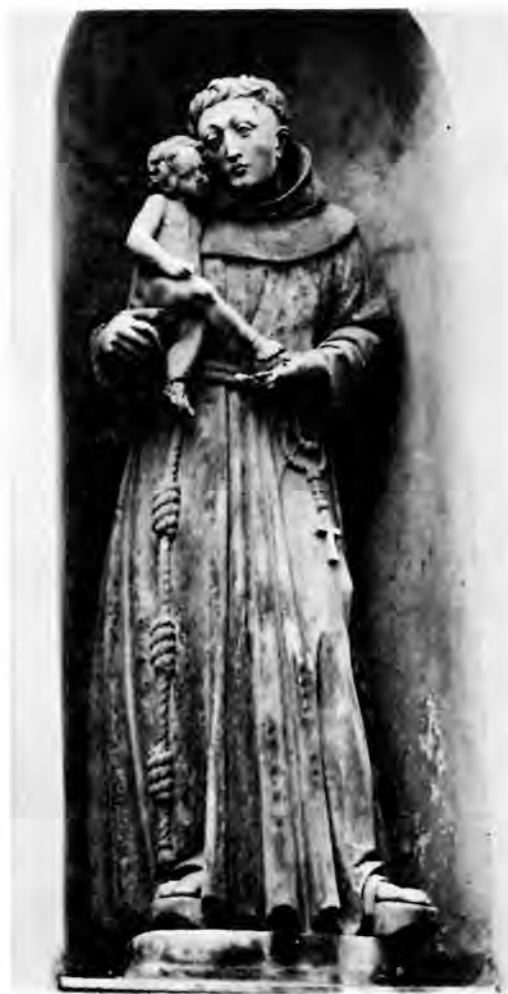
18 Varaždin, pročelje franjevačke crkve, sv. Antun Padovanski

portretnim crtama, možda samog kipara, koje samo neznatno varira. U duhu vremena kosa je bujna i pokriva glave gustim velikim kovrčama, ali je u duhu manirizma još rastavljena na pramenove, osobito dekorativno u likova Marije ili Marije Magdalene , koje svojom dugačkom, raspletenom kosom spadaju među najljepša Altenbachova ostvarenja.