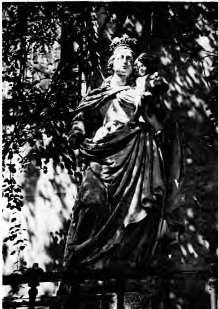
21 Čakovec, franjevački samostan, Nebeska kraljica

Na čakovečki kip nadovezuje se mala skupina kamenih Pietà , kipova posjednute Zalosne Marije s mrtvim Kristom u krilu na visoku stupu. Općenito uzevši, ti su kipovi, unatoč nekim anatomskim nedostacima, nespretnosti kompozicije i zanemarivanju statike u položaju Kristova tijela, u biti dobro modelirana djela ranog baroka, s masivnim volumenom i prigušenim patosom. Kod sva tri kipa volumen se razvija u širinu, zahvaljujući rasponu majčinih koljena i laktova između kojih opušteno leži mrtvo Kristovo tijelo s naglašenim paralelizmom spuštene desne ruke i obiju noga koje su s pretjerano uglatim nagibom koljena povezane uz čvrsti blok skupine.