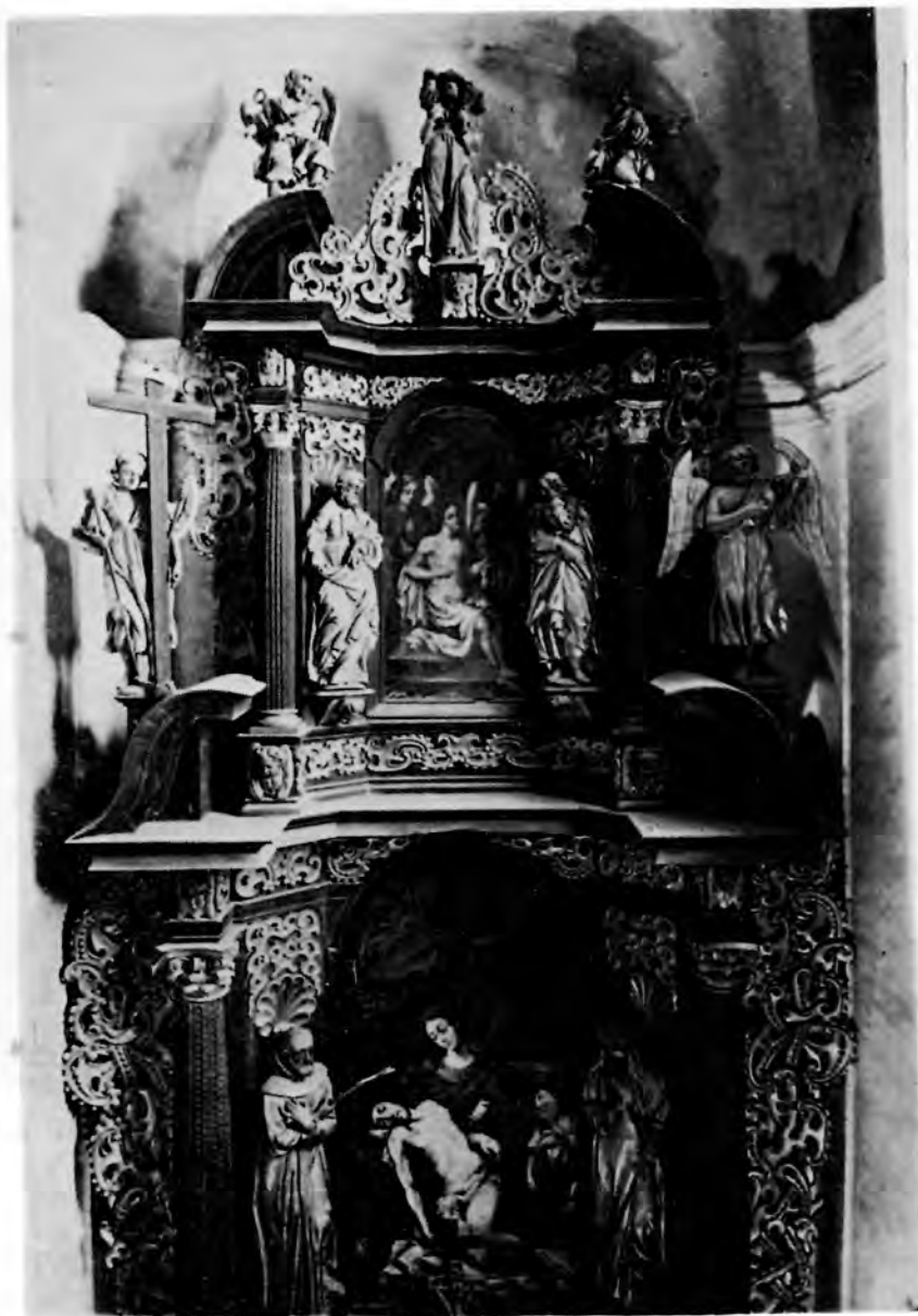
12 Lepoglava, sv. Marija, oltar Žalosne Marije

dubljenim središnjim prostorima za slike i kipove zbog nagiba bočnih stranica i uglato lomljenog teškog gređa. Nosivi elementi su identični, gustim rovašima kanelirani stupovi koji nose profilirano gređe sa svedenim segmentima raskinutog zabata nad jako izvučenim ugaonim obratima. U cjelini gledano, lepoglavski se oltar doima kao bogatije i raskošnije djelo od oltara u crkvi sv. Katarine. Vjerojatno tom dojmu najviše pridonosi bogatija primjena ornamentalnih motiva, onih bizarnih i maštovitih prepleta hrskavičnih voluta, koji na tom oltaru prekrivaju veći dio ploha i formiraju široka dekorativna krila. Centralno mjesto na oba kata pripalo je i na ovom oltaru slikanim prizorima, a kipovi su porazmješteni na oba kata i na atički zaključak na isti način i u istom broju kao na zagrebačkim olta-