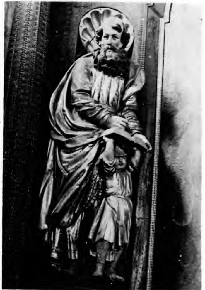
9 Sv. Matej evanđelist s oltara sv. apostola

ka od kuge koja je uvijek bila prisutna u svijesti onodobna čovjeka. Sveti Rok je rukom odgurnuo tkaninu svoje odjeće, pokazujući na trag opake bolesti nad koljenom (sl. 10). Ne prati ga njegov tradicionalni pratilac pas, nego mali anđeo stupastih nožica i glavice pokrivena gustim uvojcima, koji žalosnim licem upire prste prema rani na svečevoj nozi. Njemu nasuprot je sv. Sebastijan , koji nije na uobičajeni način prikazan kao mladenački akt proboden strelicama i vezan uz drvo, nego na način jedinstven u našoj ikonografiji, kao rimski oficir u oklopu s dugačkim trakama, plaštu i visokim čizmama (sl. 11). U ruci drži strelicu (sada izgubljenju), a mali anđeo koji mu kleči do nogu upravo mu je izvadio jednu drugu strelicu iz lijeve potkoljenice. U krugu alpskog baroknog kiparstva takav je način prikazivanja sv. Sebastijana doduše poznat, ali se javlja vrlo rijetko. 34 Mladenački đakoni Stjepan i Lovro na drugom katu svojim se punim, golobradim licima jače približavaju tipologiji svetica, a njihove dalmatike uvjetovale su jednostavnije linije i čvršće obrise. U kipu na vrhu retabla, između dva pokleknuta anđela, prepoznajemo vjerojatno sv. Petra (ruka s ključem manjka) kao zaštitnika jednog od donatora, Petra Prašinskog .