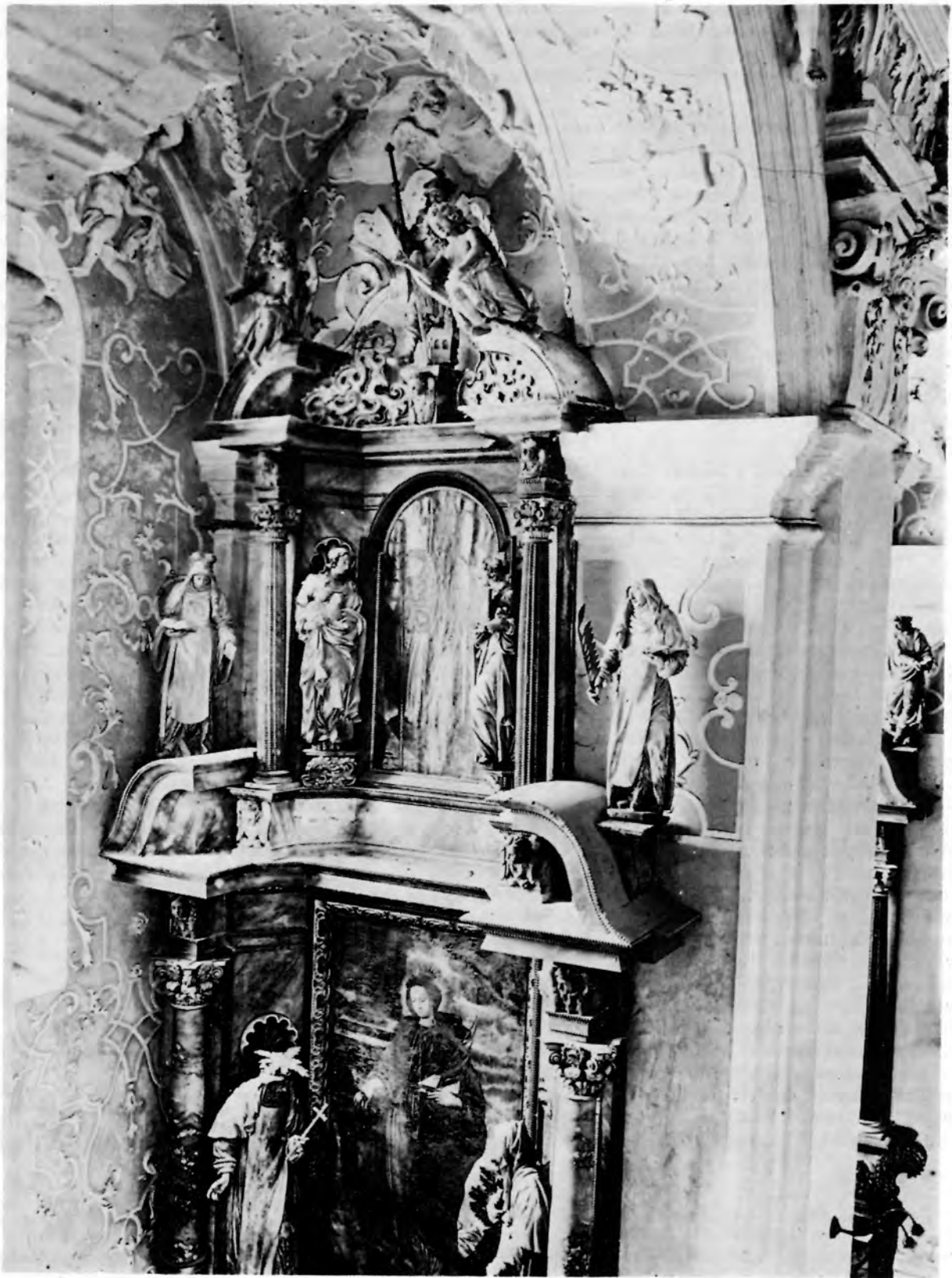
4 Zagreb, crkva sv. Katarine, oltar sv. Apolonije