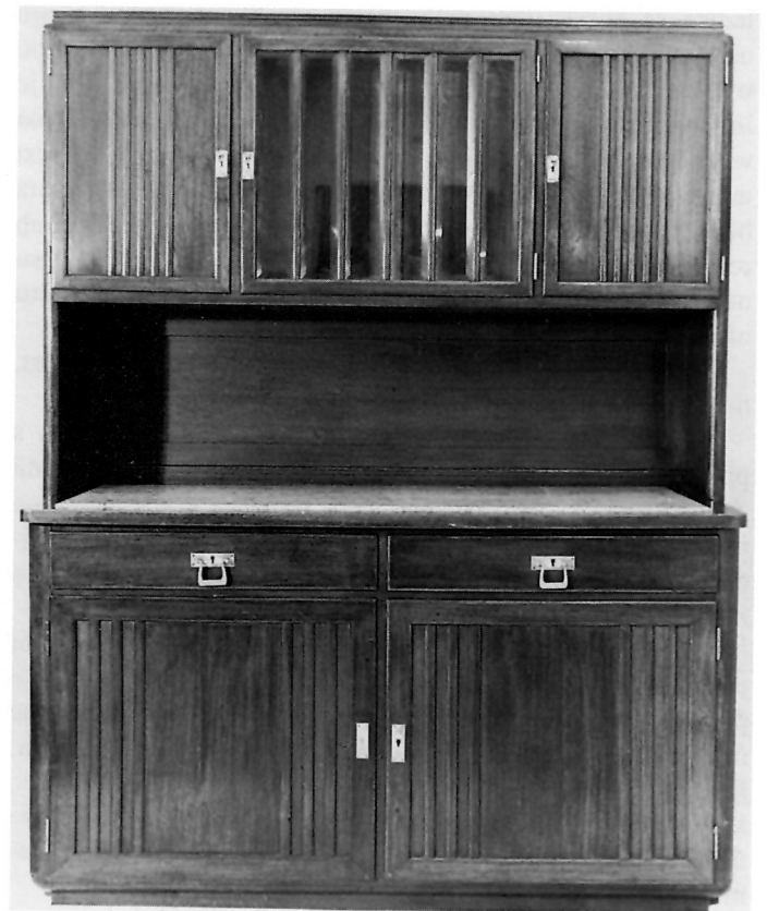
5. Kredenc iz stana M. Pilara.

zagrebačkoj arhitekturi ranih godina dvadesetog stoljeća 34 , ponekad i na istim građevinama, a paradigmatična je za tvrtku "Pilar, Mally i Bauda" za vrijeme projektantskog sudjelovanja Aladara Baranyajia.