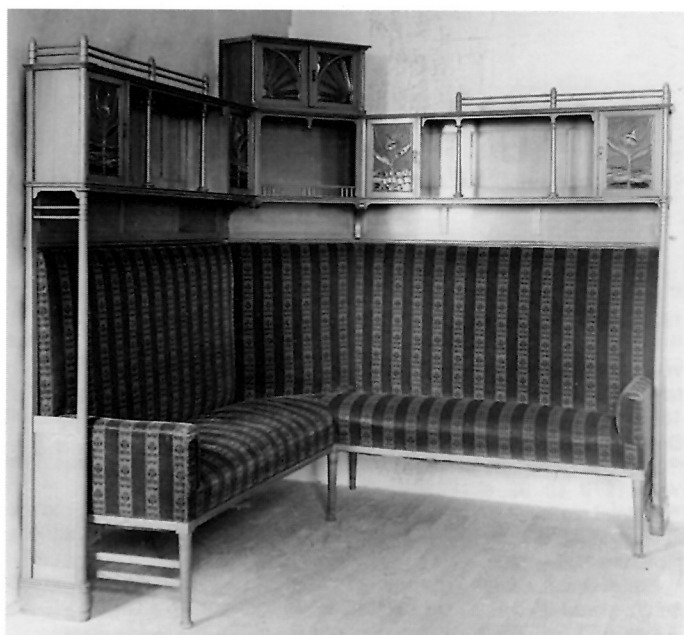
2. M. Pilar, sofa s policom i vitrinama