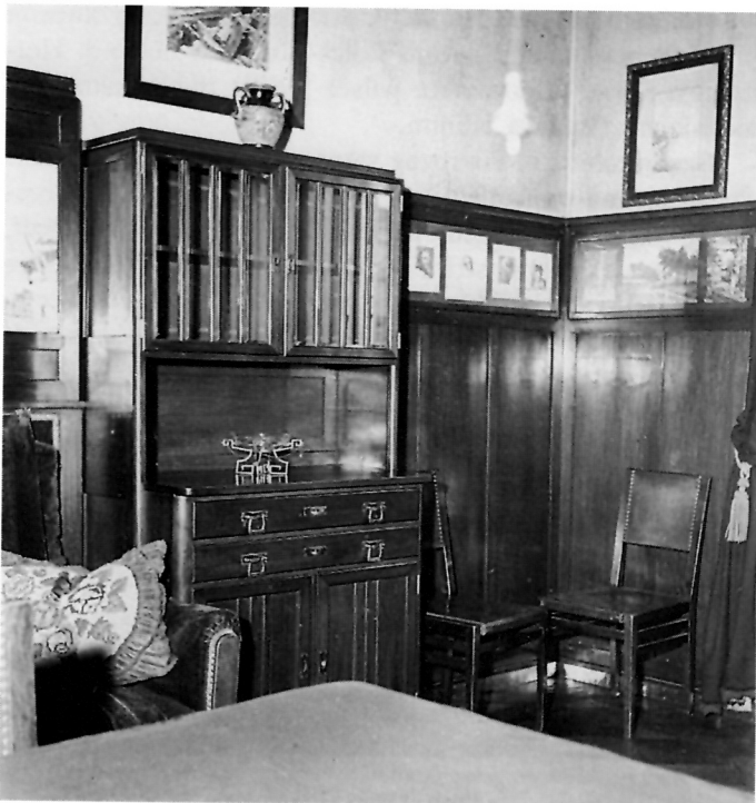
4. Pogled na ugao blagovaonice iz stana M. Pilara, Gundulićeva 52, danas Muzej za umjetnost i obrt, Zagreb