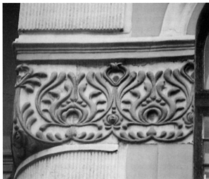
9. Detalj vijenca u zoni natprozornika I. kata