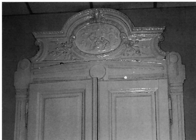
6. Historicističke drvene kartuše nad vratima soba u I. katu i alegorijskim reljefima, girlandama i volutama