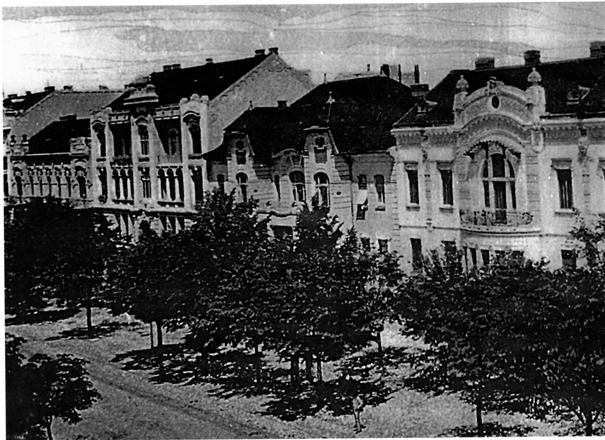
1. Secesijski niz u Chavrakovoj ulici (danas Europska avenija), pogled sa Sudbene palače oko g. 1910.