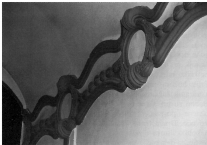
4. Girlande u obliku graškovih mahuna u veži