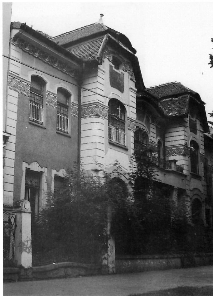
8. Pogled na kuću Kästenbaum - Korsky sa zapadne strane

Potkrovni vijenac, koji se proteže cijelom širinom pročelja, ukrašen je štukaturom u obliku dvaju nizova stiliziranih stabljika s viticama i mahunama graška. Taj vijenac prati liniju krova, pa u središtu pročelja, među rizalitima, konveksno organski, zavija stvarajući kontrapunkt s konkavnim