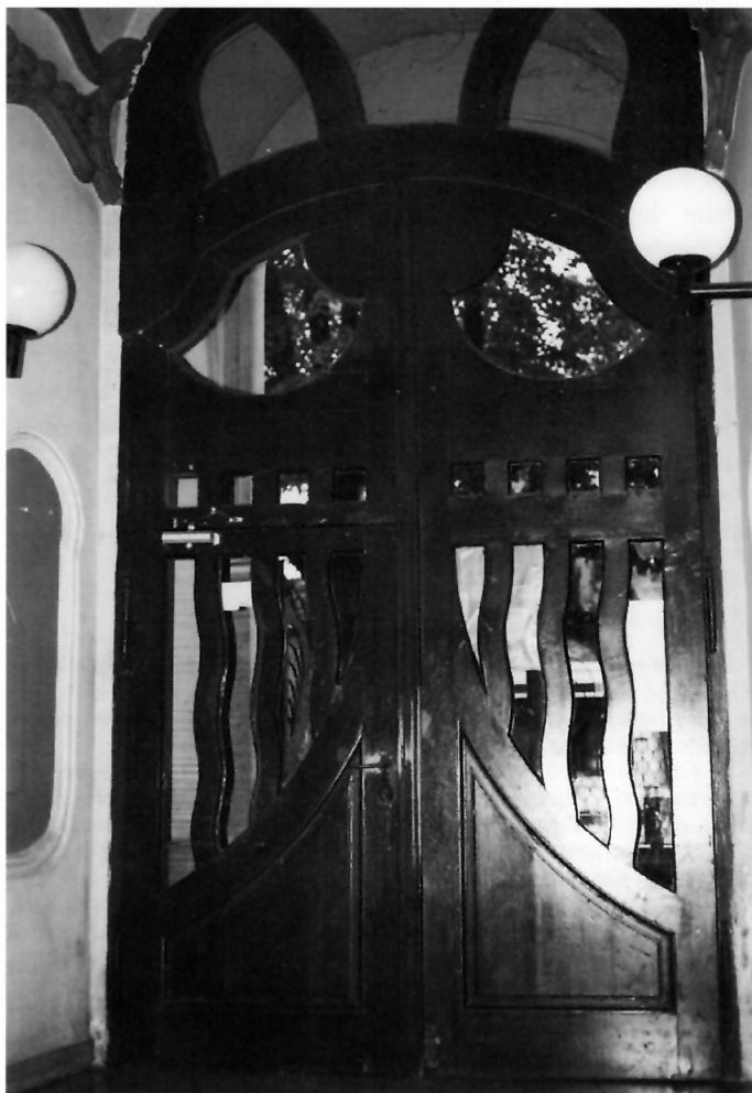
3. Ulazna vrata i štukatura na zidovima veže

Krajnja zapadna (spavaća) i krajnja istočna soba (ured) osvijetljene su dvama dvokrilnim prozorima ispunjenim u gornjem dijelu dvama redovima kvadratnih šprljaka, nad kojima je segmentno zaključeno nadsvjetlo. 19 Između ovih prostorija od zapada k istku nižu se blagovaonica, salon i Herrenzimmer. Blagovaonica je, kao i Herrenzimmer, djelomično smještena u znatno istaknutom rizalitu, a dijelom u ravnini pročelja zbog čega ove dvije sobe imaju osebujan oblik. Obje sobe u rizalitu imaju veliki četverokrilni prozor nad kojim je veliko trostrano, segmentno zaključeno nadsvjetlo, a ravnini su pročelja po jedna uska vrata sa segmentno zaključenim nadsvjetlom. Vrata vode na dugi balkon širok 1,30 metara, koliko su istaknuti i rizaliti. Pod balkona oblijepljen je keramičkim pločicama a ujedno je i strop u isto toliko velikoj loži u prizemlju. Između uskih balkonskih vrata blagovaonice i Herrenzimmer smještena su, u sredini pročelja kata, široka dvokrilna vrata salona, s po jednim prozorom lijevo i desno uz vrata, te širokim trostranim, segmentno zaključenim nadsvjetlom.