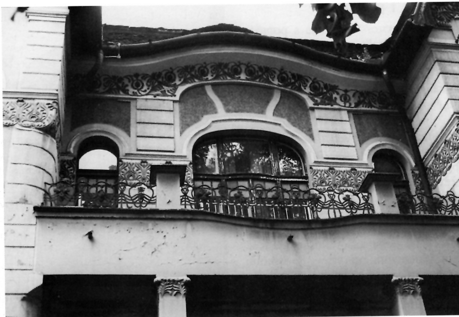
10. Središnji dio pročelja I. kata s balkonom

zidanim dijelom balkonske ograde. Spoj ravnoga zidnog plašta i reljefno oblikovanoga potkrovnog vijenca naznačen je ritmički ujednačenom valovitom crtom, koja se javlja i u gornjem dijelu balkonske kovane ograde. Rizaliti znatno nadvisuju liniju krovne strehe, a prema vrhu su blago zakošeni prema unutra.