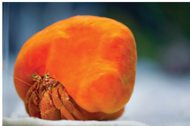
Slika 2 – Spužva Suberites domuncula (Olivi 1792.), obično obrasta puževu kućicu u kojoj je nastanjen rak samac, s kojim živi u simbiozi

Pomoću rezultata projekta SPONGES razvijena je linija kozmetičkih proizvoda (slika 3) na bazi bioaktivnih spojeva iz morskih spužava, a do predtržišne faze doveden je i novi kozmetički proizvod, Eleana – krema na bazi avarola , pogodna za iziritiranu kožu, s umirujućim i protuupalnim svojstvima. Projekt je rezultirao i značajnim napretkom u istraživanjima Crambescidin 800 i njegove potencijalne primjene u antitumorskim lijekovima.