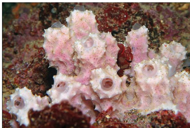
Slika 1 – Spužva Dysidea avara (Schmidt 1862.), živi u Sredozemnom moru

održive proizvodnje dvije bioaktivne komponente: avarola (izoliranog iz spužve Dysidea Avara , slika 1) i silikateina (izoliranog iz spužve Suberites domuncula , slika 2), u dovoljnoj mjeri za predtržišna istraživanja.