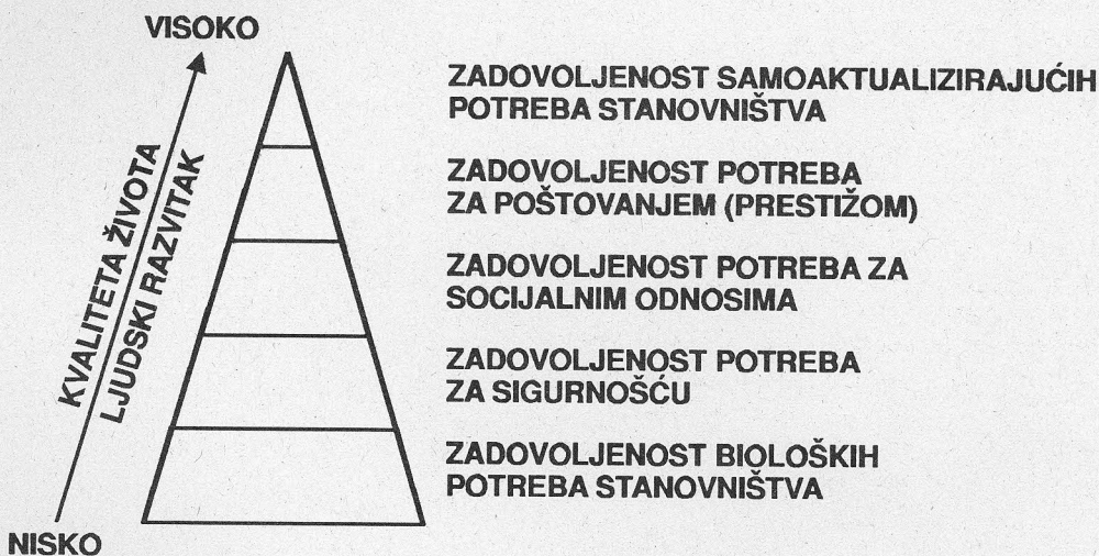
Slika 2 – Ljudska razvojna perspektiva kvalitete života

Sirgy je (1986) razradio sveobuhvatnu teoriju kvalitete života respektirajući zakonitosti hijerarhije motiva, odnosno Maslowljeve perspektive ljudskog razvitka. On zaključuje da su razvijene one zemlje stanovništvo kojih zadovoljava potrebe višega reda (socijalno potvrđujuće i samoaktualizirajuće potrebe), dok su manje razvijene one zemlje stanovništvo kojih je zauzeto zadovoljavanjem potreba nižega reda (biološke potrebe i motiv sigurnosti). Što je viša razina zadovoljavanja potreba većine u nekom društvu to je viša razina kvalitete života u njemu. Stoga društvene institucije moraju biti tako postavljene i razvijene da omogućuju zadovoljavanje raznolikih ljudskih potreba. Shematski je to prikazano na donjoj Slici 2 (prema Sirgy, 1986:332).