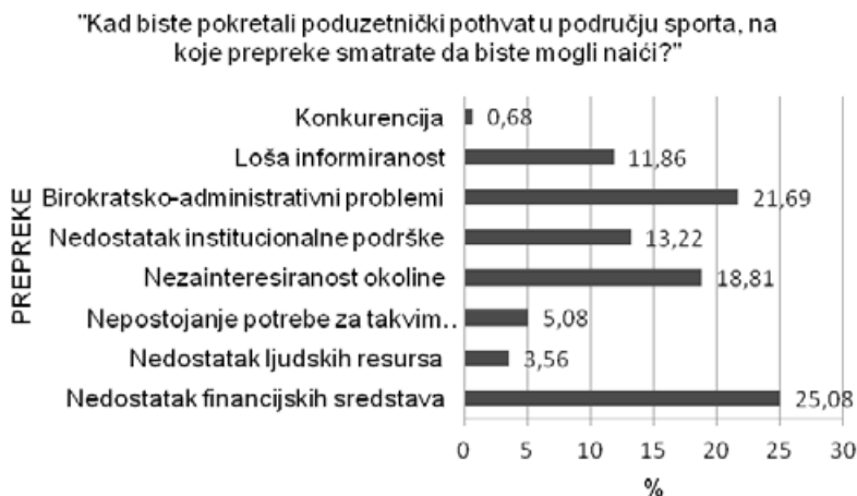
Grafikon 2. Očekivane prepreke pri pokretanju poduzetničkog pothvata u sportu

U upitniku su bile ponuđene moguće prepreke na koje bi se moglo naići u slučaju pokretanja poduzetničkog pothvata u području sporta (grafikon 2). Ispitanici su mogli odabrati jednu ili više prepreka za koje smatraju da bi se mogle pojaviti. Najveći broj odgovora odnosio se na nedostatak financijskih sredstava (148), birokratsko-administrativne probleme (128) te nezainteresiranost okoline (111). Nedostatak institucijske potpore odabralo je 78 ispitanika, dok njih 70 smatra da ne postoji dovoljno informacija kako bi se upustili u takav projekt. Odgovor da ne postoji potreba za takvim projektima dalo je 30 ispitanika, a 21 ispitanik smatra kako ne postoji dovoljno ljudskih resursa. Konkurenciju u području poduzetništva u sportu kao prepreku vidi samo 4 ispitanika, dok 4 ispitanika samostalno navodi moguće prepreke, među kojima se spominje slaba kupovna moć građana RH, korupcija i mogući nepotizam.