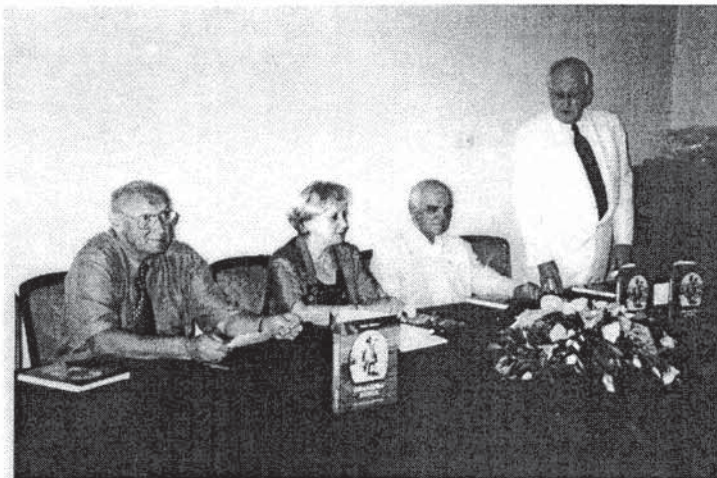
S predstavljanja monografije "Hranidba konja"

Knjiga je pisana svojstveno autoričinom načinu izlaganja i temeljitosti pristupa problematici, dobrim stilom, jasnim izrazom, kratkoćom uputa i sveobu-