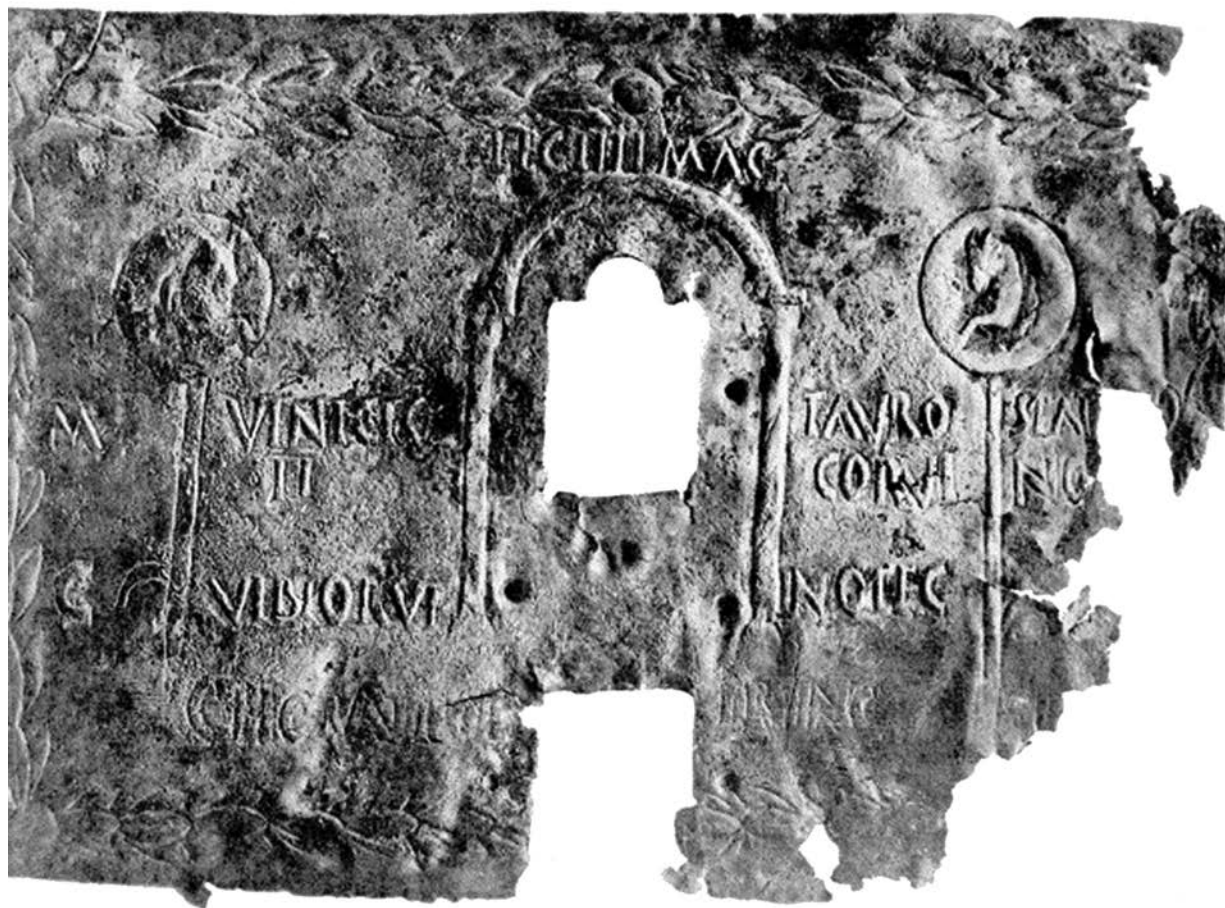
Slika 3. Oplata katapultula iz Kremone