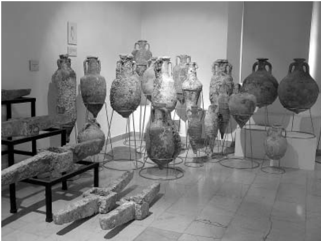
sl. 8. Olovne prečke rimskih sidara, 1./2. stoljeće Grčke i rimske amfore, 5. stoljeće prije Krista - 6. stoljeće HPMS, Zbirka podmorskih nalaza

dodžbe i matrikule hrvatskih pomoraca na talijanskom jeziku, sve do prve svjedodžbe splitskog pomorca, strojara Petra Šakića, pisane na hrvatskom jeziku, iz 1908. godine. Naposljetku tu je i Odjel parobrodarstva, uz dominantan model putničkog parobroda "Kraljica Marija" (sagrađenog 1906. g.), koji je kao predmet i trag nekih prošlih, zaboravljenih splitskih pomorskih muzeja sačuvan i izložen u Hrvatskome pomorskom muzeju Split.