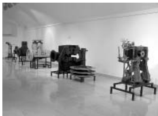
sl. 10.-11. S izložbe Počeci splitskog brodogrojarstva, Rossi - prvi hrvatski motori

hidroarheološkog istraživanja s nalazišta u Kaštel Sućurcu, koje je obavljeno suradnjom Ministarstva kulture - Odjela za zaštitu arheološke baštine, Podvodnoistraživačkog kluba Mornar i Hrvatskoga pomorskog muzeja kao nositelja istraživanja. Početak zaštitnih radova zabilježen je u listopadu 2002. godine, a impresivan i cjeloviti pitos prezentiran je javnosti izložbom 23. prosinca 2002.