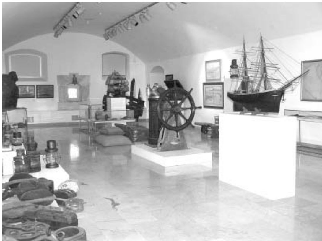
sl. 9. Iz postava Hrvatskoga pomorskog muzeja Split