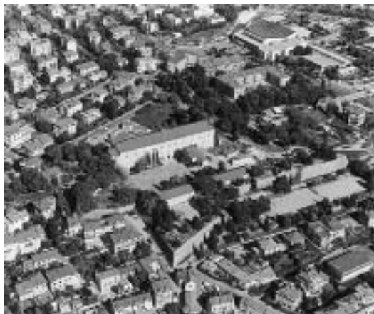
sl. 3. Tvrđava Gripe, lokacija Hrvatskoga pomorskog muzeja Split

Vojno-pomorski muzej osnovan je, dakle, 1960. godine. Prva izložba NOB na moru za javnost je otvorena 10. rujna 1962. godine, u povodu jubilarne proslave 20. godišnjice osnutka Jugoslavenske ratne mornarice. Muzej je bio smješten u središtu grada, u baroknom bedemu Priulli. Sadržaj izložbe obuhvaćao je slijed događaja od travanjskog rata 1941. godine i ustanaka u mjestu Gradac siječnja 1942. godine, pa do oslobođenja Istre i Trsta. Izložba je bila skromnih dimenzija uglavnom zbog malog i neprikladnog prostora. 7