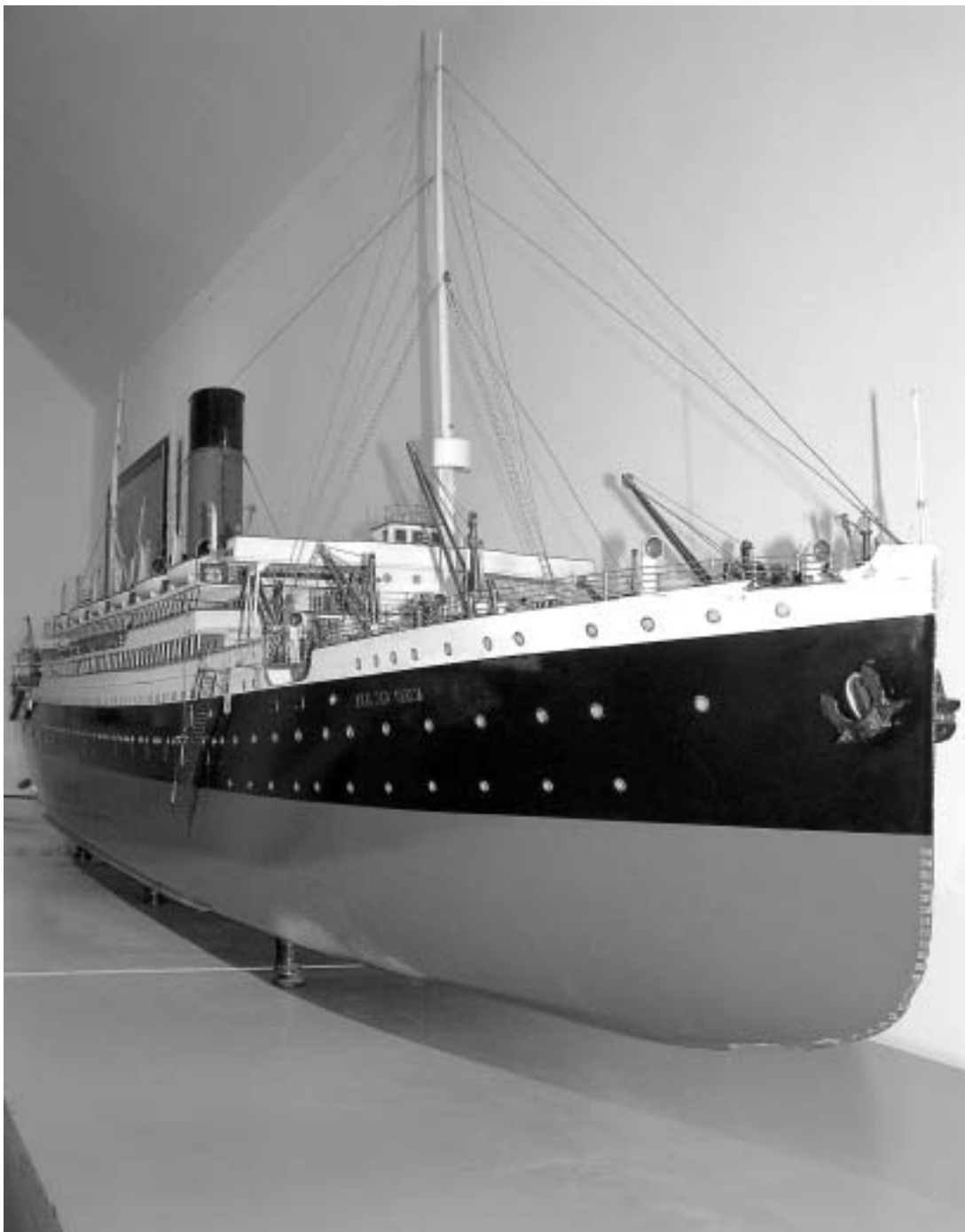
sl.15. Putnički parobrod duge plovidbe "Kraljica Marija", sagrađen 1906. godine u Belfastu; vlasništvo Jugoslavenskog Lloyd a.d. iz Splita 335 x 37 cm, maketa HPMS, Zbirka maketa

Vojno-pomorski muzej, HPMS posjeduje brojne modele brodova iz sastava ratne flote austrougarske mornarice, preko modela koji prate razvoj partizanskog ratovanja na moru, sve do modela ratnog brodovlja JRM-a. Navedimo tek neke: model oklopnog broda "St. Georg" (na kojemu je izbio ustanak mornara u Boki kotorskoj od 1. do 3. veljače 1918.), impresivan model bojnog broda "Viribus Unitis" (na kojemu je 31. listopada 1918. obavljena primopredaja austrougarske flote predstavnicima Narodnog vijeća). "Pionir I" i "Pionir II" modeli su koji prikazuju početna plovila za partizansko ratovanje na moru, a posjetitelji imaju priliku vidjeti i