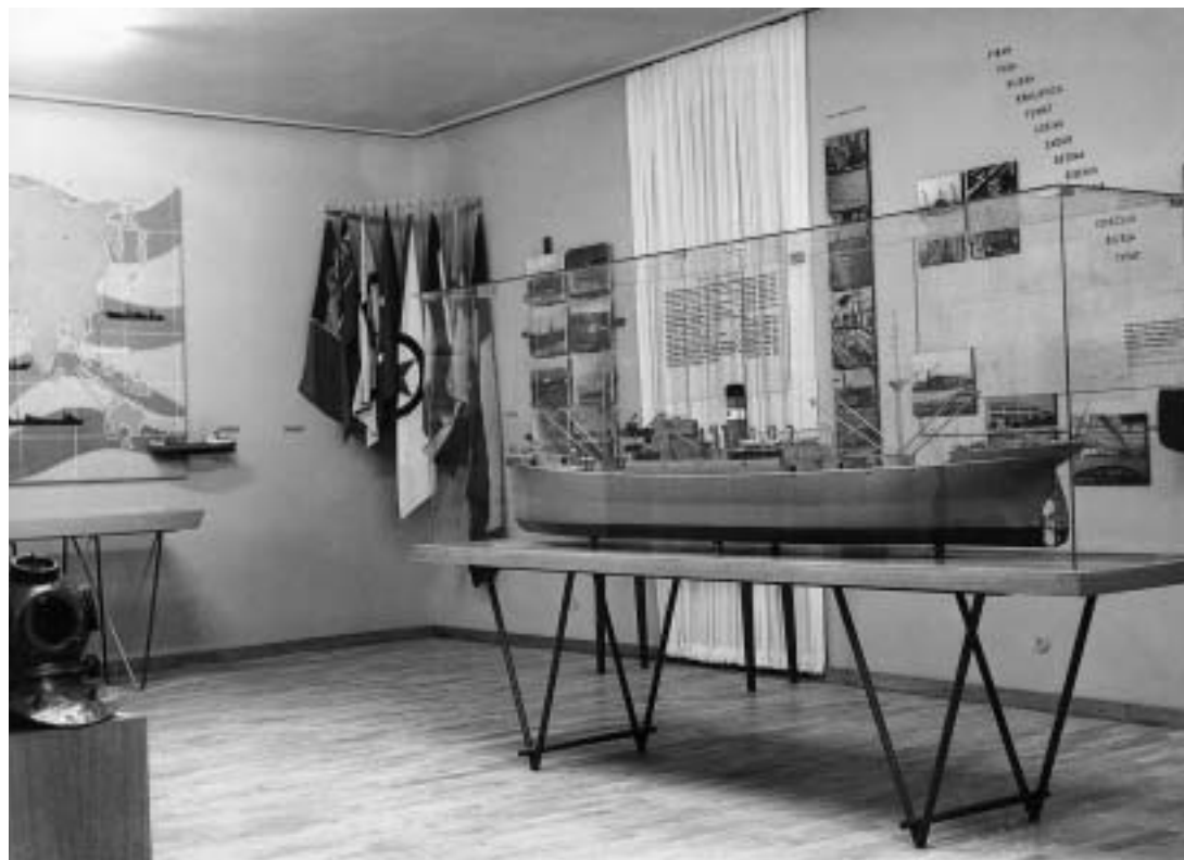
sl. 1-2. Pomorski muzej JAZU. Stalni postav 1950.-1960.