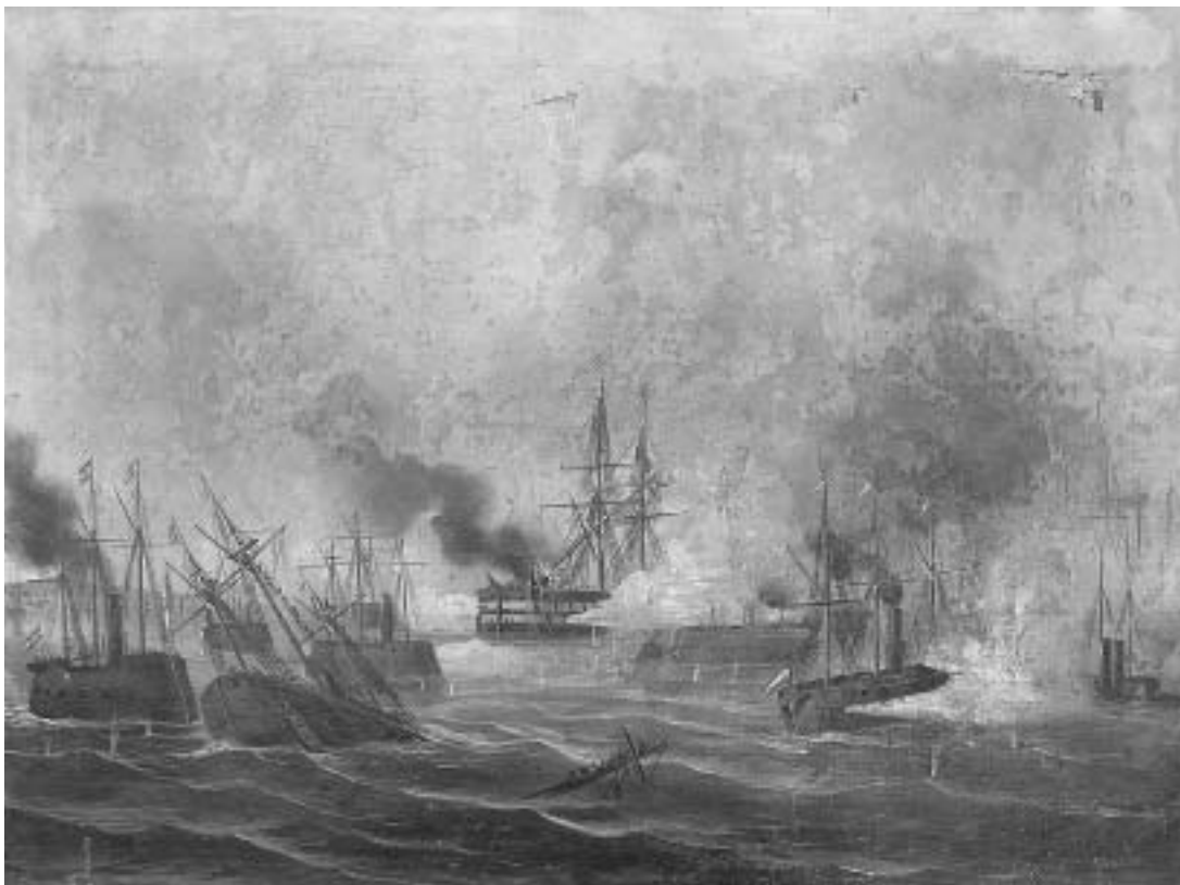
sl. 5. Viški boj , 71 x 53 cm, ulje na platnu, sign. A. Zieger, druga polovica 19. stoljeća HPMS, Zbirka likovnih radova