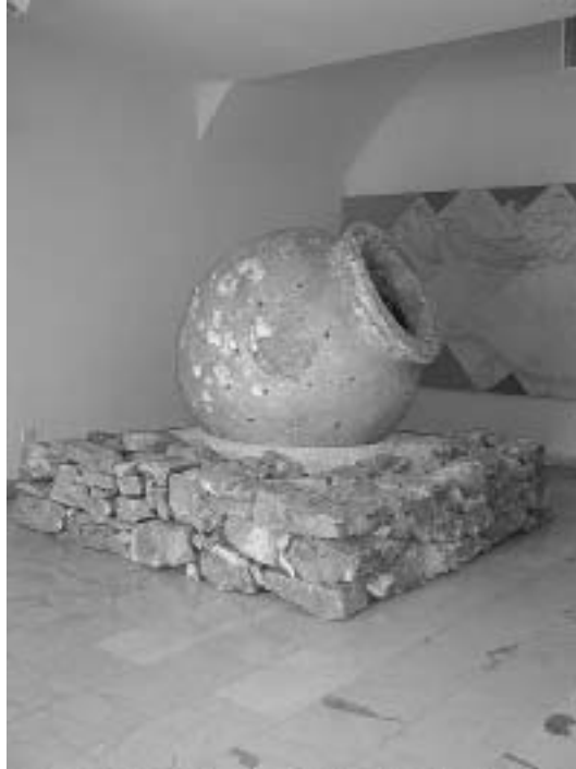
sl. 7. Pitos, 1./2. stoljeće Visina 160 cm, širina po sredini približno 150 cm, vanjski promjer otvora (obod) 88 cm, unutarnji promjer otvora 66 cm HPMS, Zbirka podmorskih nalaza

i uz odobrenje HAZU, otpočeo (takoder tijekom 1998. g.) preseljavanje spomenute muzejske građe u tvrđavu Gripe. Time je, nesumnjivo, povećana ukupna vrijednost i cjelovitost naslijeđenog fundusa Muzeja.