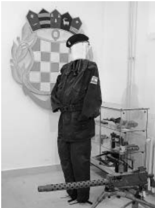
Pomorskog muzeja i Umjetničke galerije te djelima u obiteljskom naslijeđu.