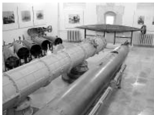
sl. 16. i 17. Torpeda - najstariji primjerak iz 1866. godine HPMS, Zbirka oružja i oružanih sustava

U Zbirci maketa primarno su obrađena i inventarizirana 134 predmeta.