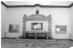
sl.5. 11. Salon mladih / Zadarska situacija, Galerija umjetnina, 2005.