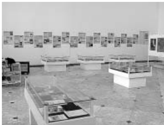
sl.13 Dio postava retrospektivne izložbe Izložbe i izdavaštvo 1983. - 2004. , Gradska loža, 2005.

Izdavačka se djelatnost do 2000. godine na isti način