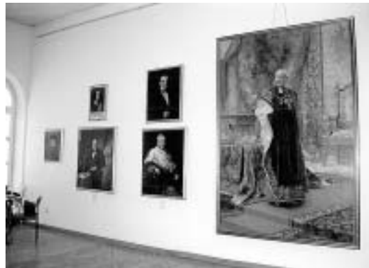
sl.12. Dio postava stalne izložbe Muzeja grada Zadra Uspomene iz jednog Zadra