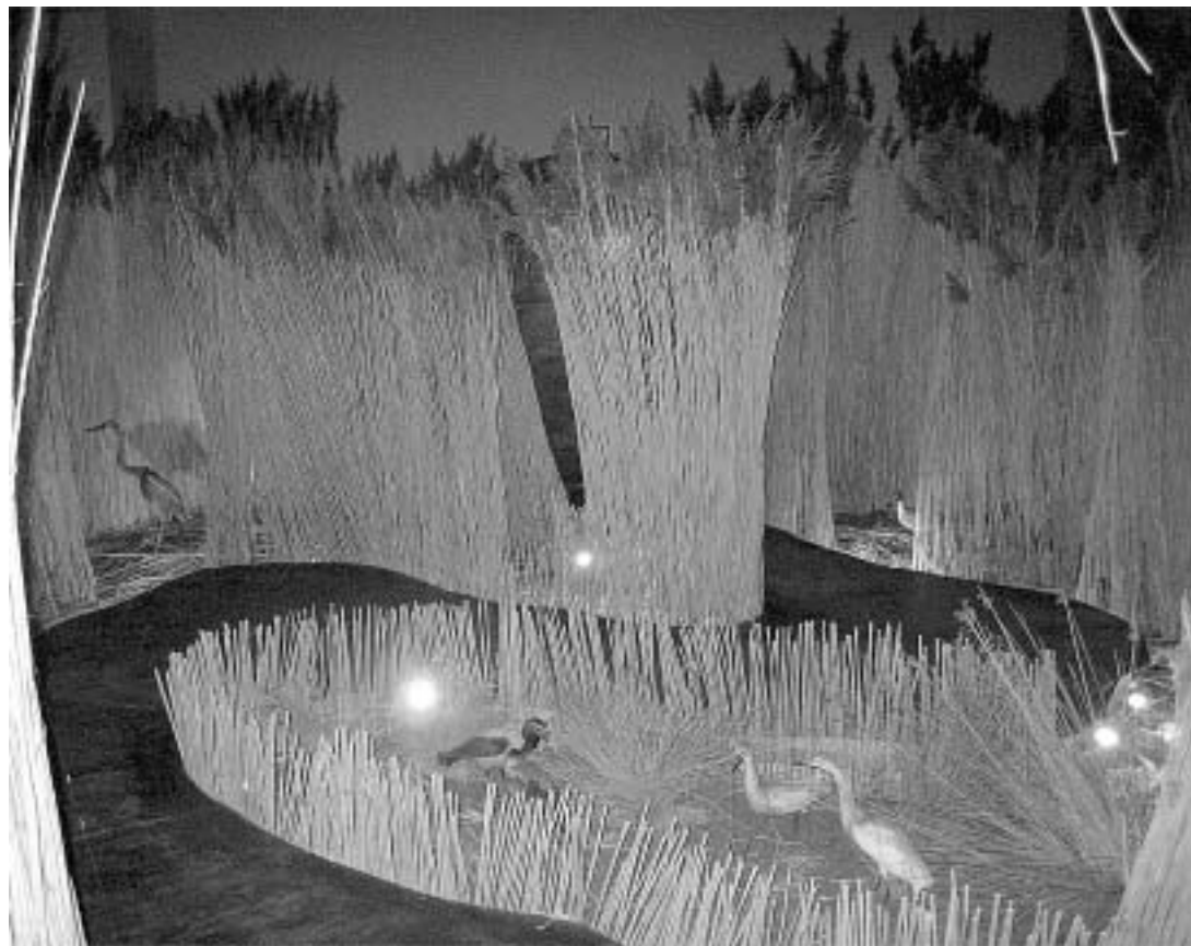
sl.8. Iz postava stalne izložbe Park prirode Vransko jezero

kojima se zadarska publika upoznaje s različitim prirodoslovnim temama iz ostalih dijelova Hrvatske. Samo od 2003. do kraja 2005. zabilježeno je 9 izložbi u organizaciji i suorganizaciji Prirodoslovnog odjela.