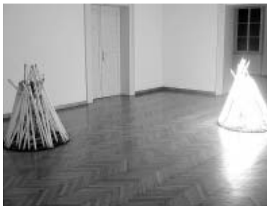
sl.1. Instalacija Ivane Franke, Gradska loža, 2005.

Prva u nizu galerijskih izložbi u 2005. godini bio je 11. Salon mladih , održan u Galeriji umjetnina i Gradskoj loži od 10. veljače do 5. ožujka. Nakon jedanaestogodišnje pauze Salon je obnovljen 2000. godine kao bijenalna izložba mladih fotografa, a od 2005. godine obuhvaća i ostale likovne izričaje, vraćajući se koncepciji nekadašnjih Salona . Dominacija fotografskog medija nad ostalim likovnim stvaralaštvom specifična je pojava u Zadru. To posebno dolazi do izražaja u ratnom i poratnom razdoblju, kada stagnira likovna aktivnost, a pojavljuje se veći broj mladih fotografa koji su "zanat ispekli" radeći kao fotoreporteri u brojnim zadarskim tiskovnim medijima. Višegodišnje nepostojanje likovne scene navelo je organizatore smotre da ispitaju razinu