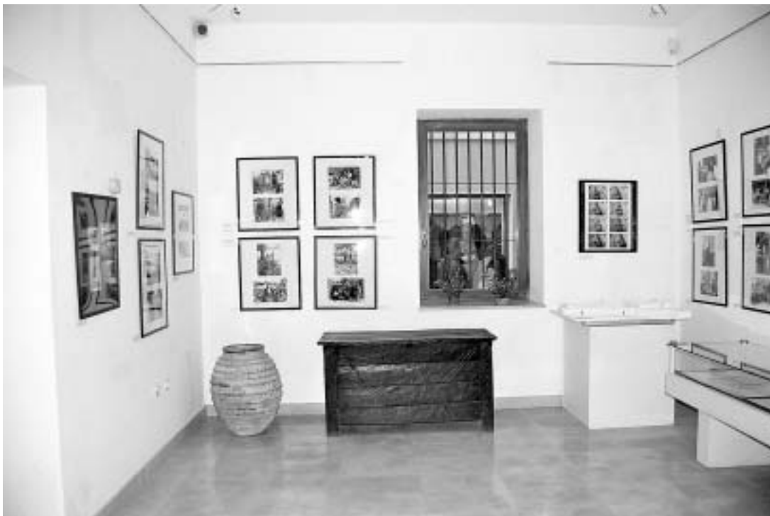
sl.9. Dio postava izložbe Olga Oštrić - prva etnologinja u sjevernoj Dalmaciji, prizemlje Gradske straže, 2005./2006.