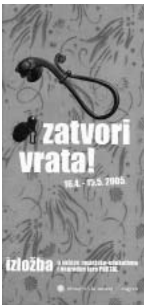
Pozivnica za izložbu Fedor Kritovac: Zatvaraj vrata!