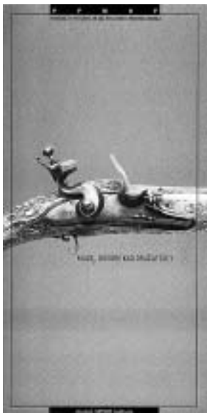
Pozivnica za izložbu Zbirka starog oružja - iz fundusa Muzeja, Pomorski i povijesni muzej Hrvatskog primorja Rijeka