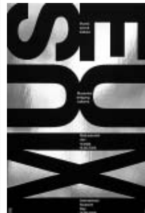
Dizajn: Boris Ljubičić

IM 36 (1-2) 2005. POGLEDI, DOGAĐAJI, ISKUSTVA VIEWS, EXPERIENCES, EVENTS