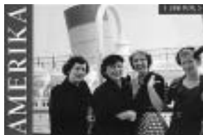
Pozivnica za izložbu Amerika