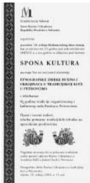
Pozivnica za izložbu Tkani i vezeni radovi

□ Izložba: Voda - plavo zlato / Wasser - das blaue Gold / Watter - Blue Gold (VIDJETI POSEBAN PRILOG)