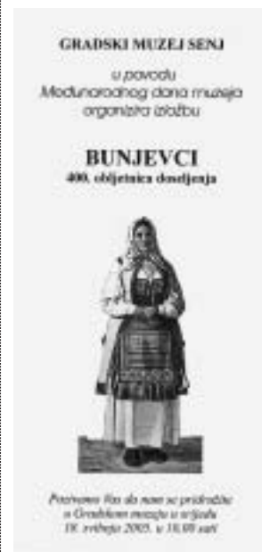
Pozivnica za izložbu 400 godina dolaska Bunjevaca na područje grada Senja