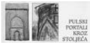
Pozivnica za izložbu Pulski portali kroz stoljeća