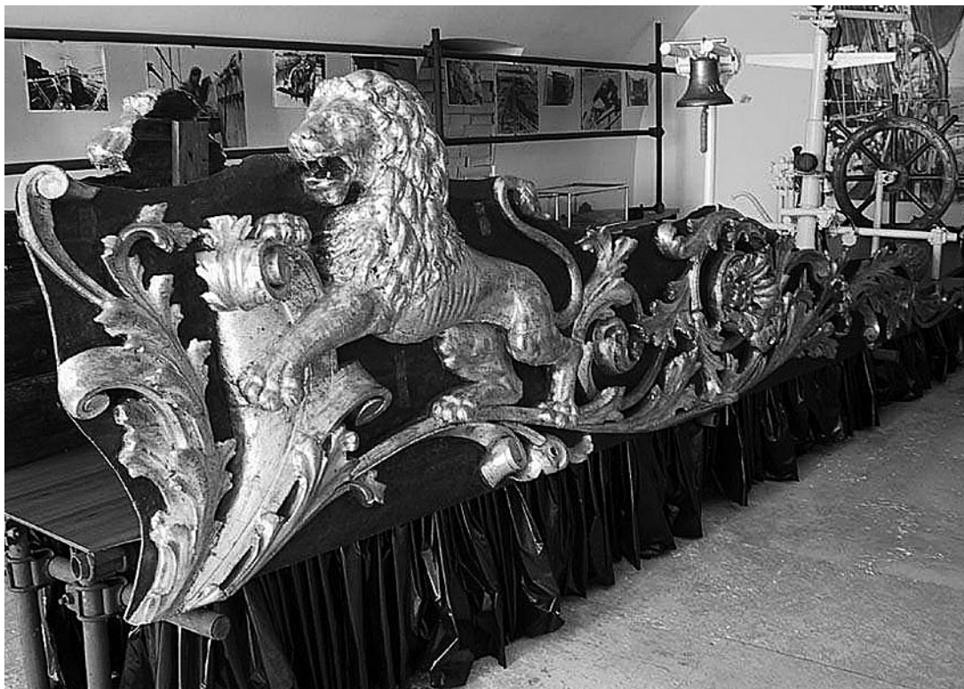
sl.2. Rezbarena polikromna brodska oplata s mletačkog jedrenjaka iz 18.st, Povijesni muzej Istre.

ta, makete brodova, fotografije, nacрте i publikacije od razdoblja austrougarske uprave u tadašnjem Arsenalu pa do danas. Dio tih predmeta iskorišten je za stalni postav o razvoju pomorstva i brodogradnje.