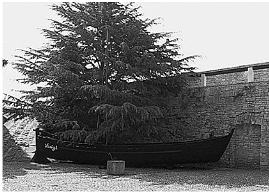
sl.4. Ribarski brodić Luigi u atriju Pomorskog muzeja Istre, Pula.

ni su 1990.-1991. u brodogradilištu Tehnomont u Puli, nakon čega je postavljen u atrij Povijesnog muzeja Istre. Tako je uspješno spašen od zaborava izuzetan primjerak istarske broderske tradicije.