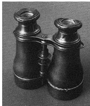
sl.5-6. Predmeti iz fundusa Pomorskog muzeja Istre, Pula.

Ta se građa danas nalazi u stranim muzejima ili privatnim zbirkama, a često se pojavljuje i na specijaliziranim sajmovima, pogotovo u talijanskim gradovima. Otkupnom politikom Povijesni muzej Istre nastoji vratiti barem dio građe koje je tijekom 20. stoljeća iznesen iz Pule i Istre. Stoga se Muzej pojavljuje na susretima kolekcionara i sajmovima umjetnina i starina u Puli, Rijeci, Trstu, Ljubljani, Zagrebu, Veroni i Beču, gdje, ovisno o financijskim mogućnostima, otkupljuje zanimljive predmete. Međutim, pri otkupu predmeta pojavljuje se problem novca. Naime, Muzej od osnivača (Istarske županije) ne dobiva namjenska sredstva za otkup vrijedne muzejske građe, pa smo se prisiljeni za tu namjenu koristiti vlastitim sredstvima koja su prilično skromna, pa zbog toga