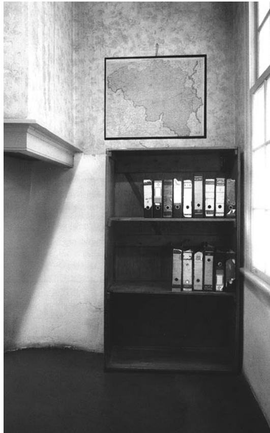
sl.3-4. Kuća Anne Frank, Iza pomične police skrivao se ulaz u tajni aneks, dio stalnog postava.

Bergen-Belsenu, nekoliko dana nakon Margot. August van Pels umrla je između 9. travnja i 8. svibnja 1945. u blizini Theresienstadta. Peter van Pels umro je 5. svibnja 1945. u bolnici u Mathausenu. Otto Frank preživio je Auschwitz.