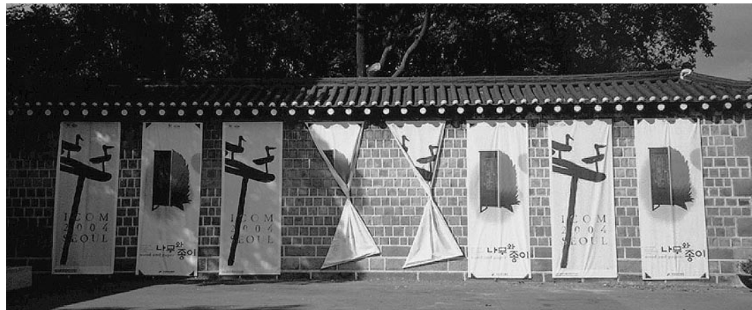
sl.1. Svi muzeji u Seoulu bili su uključeni u program Generalne konferencije ICOM-a

ŽELJKA KOLVESHI □ Muzej grada Zagreba, Zagreb