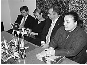
sl.1. Žiri izložbe Drava Art Annale Koprivnica, 2004.