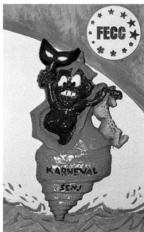
Detalj pozivnice za izložbu Karnevalski običaji u Senju