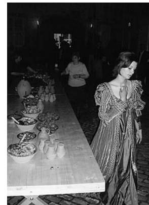
sl.1. Izložba Srednjovjekovni grad Ružica u Muzeju Slavonije