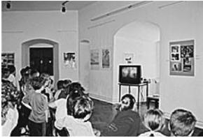
Legenda o Picokima - videoprojekcija u Galerija Stari grad Đurđevac