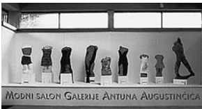
Fotografija iz deplijana izložbe Odljelo čini...