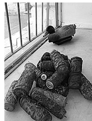
Izložba Wunderkammer - Studio slobodne misli (Mali salon, Korzo, 18. - 31. svibnja 2004.)