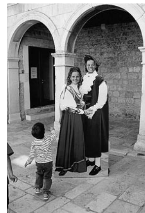
Spojimo Miljenka i Dobrilu, radionica namijenjena djeci predškolske dobi