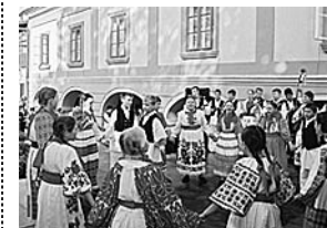
Glazbeno-zabavni program Muzeja Turopolja

□ Događanje /radionice: Gradske nošnje iz Bosne i Hercegovine