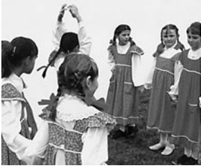
Pozivnica za etnografsku izložbu Dječje igre i igračke u Podravini