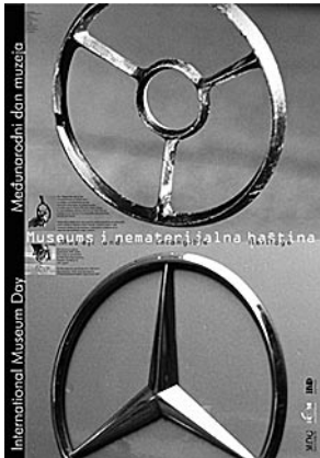
Plakat Muzejskog dokumentacijskog centra na temu Muzeji i nematerijalna baština Autor plakata: Boris Ljubičić

TONČIKA CUKROV □ Muzejski dokumentacijski centar, Zagreb