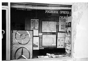
sl.1-2. Pogled na izlog u kojemu je postavljena izložba