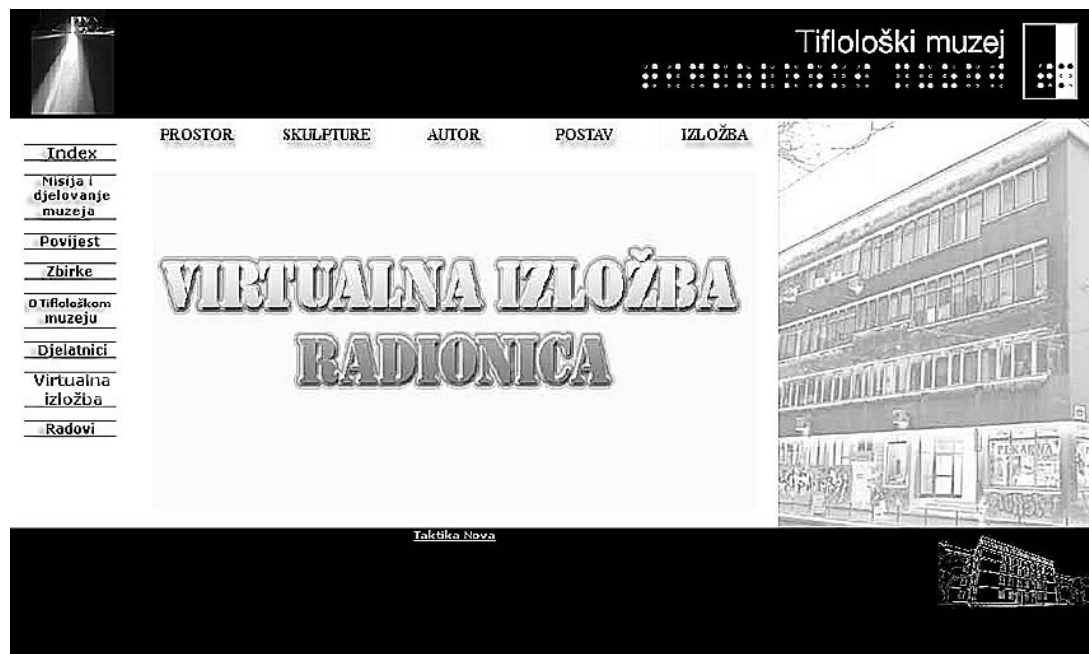
sl.1. Virtualna radionica, http:// www.tifloloskimuzej.org

1. Interni i radni materijal kolegija "Baština u okruženju informacijske tehnologije" na posljediplomskom studiju Filozofskog fakulteta Sveučilišta u Zagrebu, Informacijske znanosti, muzeologija, šk. g. 2004./05. (priredila doc. Žarka Vujić)