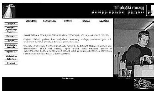
sl.3. Stranica s tekстом o autoru skulptura Ivanu Ferlanu

U skladu s poslanjem našeg muzeja i zacrtanim zadacima koje želimo ostvariti, određen je i cilj virtualne radionice i izložbe - stvaranje novog iskustva, kako kod posjetitelja, tako i kod samog muzeja (to je naša prva virtualna radionica), poticanje promišljanja posjetitelja o