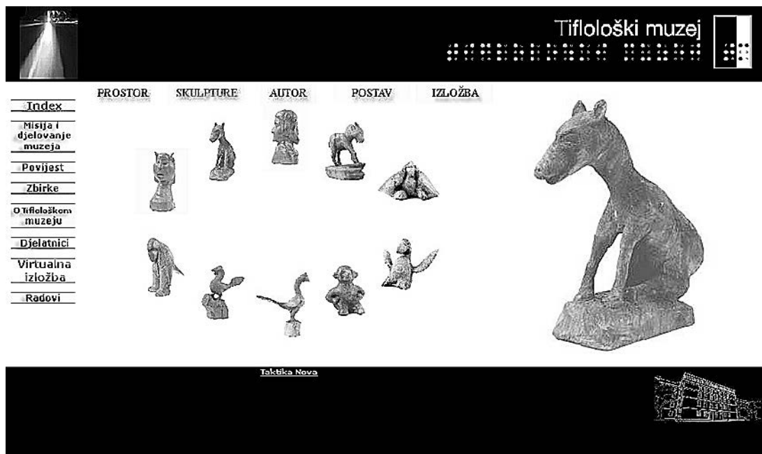
sl.2. Virtualna radionica _uvodna stranica http:// www.tifoloskimuzej.org

samo posjeti web stranice (taj posjet ostaje zabilježen radi praćenja posjećenosti web stranica); aktivan, ako se razvije izravna komunikacija s korisnikom putem, primjerice, razmjene poruka u stvarnom vremenu ili e-poštom.