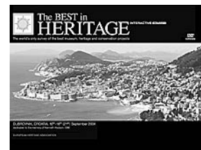
sl.4. Interaktivno DVD izdanje manifestacije "Najbolji u baštini 2004.": naslovnica

Kako sama manifestacija u svom stručnom, programskom dijelu uvijek započinje teorijskim predavanjem,