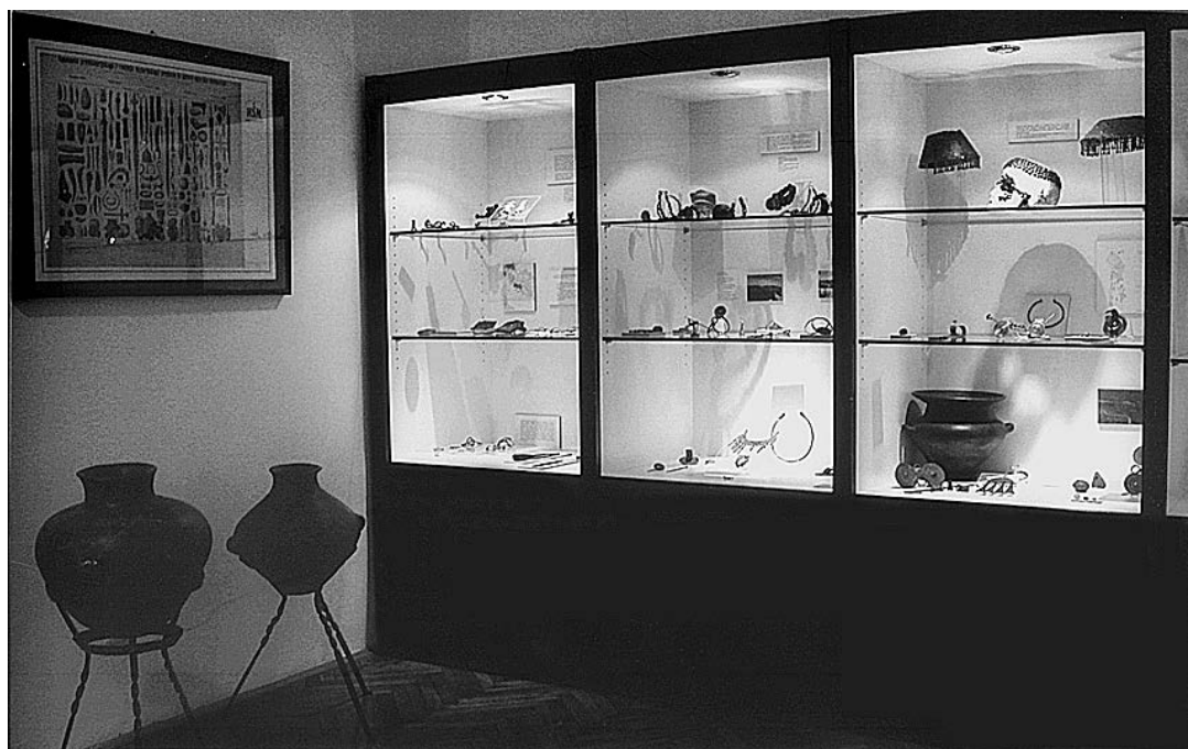
sl.1-5. Muzej Like Gospić, Terra viva , novi stalni arheološki postav, 2004.

U Muzeju Like Gospić prvi je put nakon dugih trideset godina 12. ožujka 2004. otvoren novi stalni arheološki postav. Premda mu je naziv pomalo na tragu romansiranog izričaja - Terra viva , predmnijevajući i ponajmanje znanje latinskog jezika, svakom je posjetitelju prepoznatljiv smisao te riječi. Koliko je zemlja od koje i za koju čovjek živi kulturno dobro, toliko ono zahtijeva i očekuje da svatko od nas dade dostojan obol nastojanju, znanju, umješnosti, svjesnosti ... svemu onom osvitu , prepoznatljivome - civilizacijskome, od prapovijesti do danas. Stoga je možda i sukus postava sadržan u rečenici deplijana - to je čovjek u eksponatu .