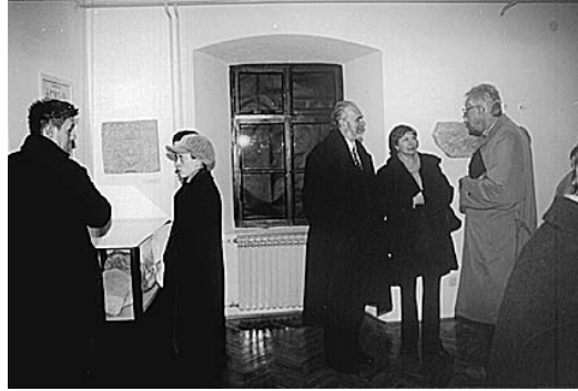
sl.6-7. S otvorenja novog arheološkog postava

pak stavljen pod centralni snop svjetlosti. Postav je potpuno podređen predmetu, jer sveprisutni virtualni svijet kojemu težimo ne uspijeva sasvim posjetitelju podariti izravni dodir s prošlošću, radi kojega on, uostalom, i dolazi u muzej.