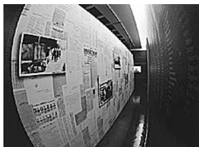
sl.12-15. Kuća terora, Budimpešta, Mađarska.

kjih je zgrada ponovno zaživjela, na mjestu vrlo dragom svim stanovnicima Roubaixa.