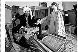
sl. 6-12. Muzej za zdravstvenu skrb, Edirna, Turska, dobitnik nagrade Vijeća Europe 2004.