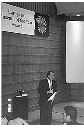
sl.1. Direktor MARQ - Arheološkog muzeja Alicante sa skulpturom Henry Moora, nagradom za Europski muzej godine 2004.