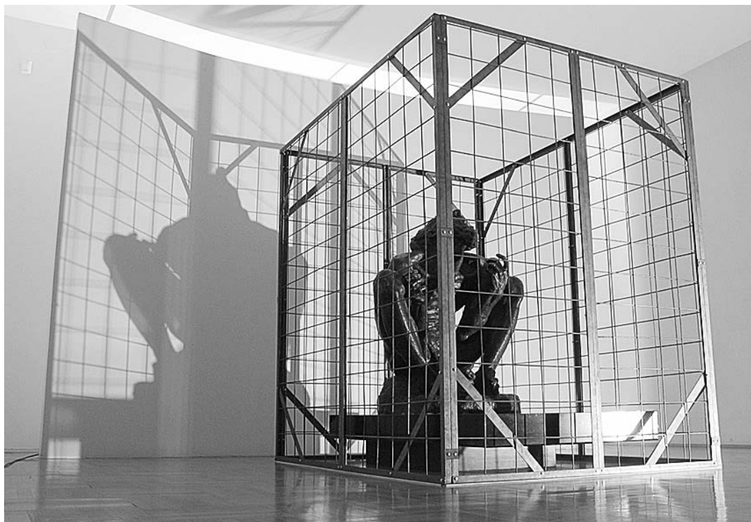
sl.3. Graziano Vignolo, Lamenti incatenati , 2004. Željezo, zvučna kulisa Ivan Meštrović, Job , 1946.

Guillaume Ségur problematizira višedimenzionalnu pojavu realiteta. Susrevši se prvi put s imenom Ivana Meštrovića odnosno s galerijom njegovih radova u Splitu putem službene internetske stranice ( www.mdc.hr/mestrovic ), umjetnik prilikom boravka u Splitu stvara vlastitu realnost prikupljajući informacije o kompleksu i umjetninama koje smatra relevantnima. Nakon toga unutar reprezentativne blagovaonice negdašnje Meštrovićeve vile umjetnik postavlja televizor na kojemu promatraču nudi link koji će ga uputiti na njegovu interpretaciju prostora u kojemu se upravo nalazi ( www.actualwalk.com ). Rad tog umjetnika moguće je zapravo vidjeti u virtualnom/dislociranom prostoru (izvan muzeja!) kada posjetitelj već posjeduje memoriju na doživljenu realnost posjeta Galeriji Ivana Meštrovića. Link na TV ekranu popraćen je zvukom koji privlači pozornost i pokreće prostor, inače lišen komponente zvuka.