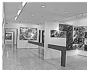
sl.8-9. Moderna galerija, Zagreb, retrospektivna izložba Borisa Demura