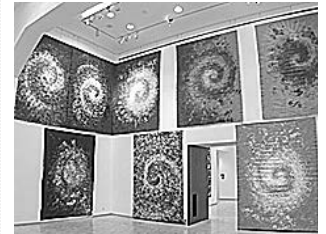
sl.4-7. Moderna galerija, Zagreb, retrospektivna izložba Borisa Demura - detalj postava