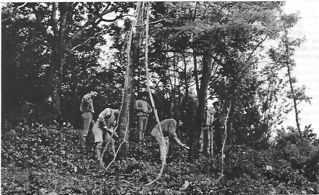
POČETAK ISKOPAVANJA NA LOKALITETU GRADINA MARIĆ U MIKLEUŠKOJ - KRČENJE TERENA

Teren na kome je istraživanje započelo bio je vrlo težak, obrašten gustom šumom, mjestimično i neprohodnim raslinjem. 4)